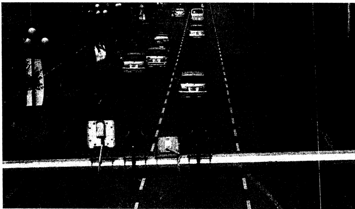
Một điểm lắp đặt camera trên đường phố TP.Biên Hòa

Hệ thống giám sát giao thông bằng camera này do Công an tỉnh Đồng Nai làm chủ đầu tư, đội CSGT Công an TP.Biên Hòa là đơn vị tiếp nhận, quản lý. Dự án được chia thành 2 giai đoạn, giai đoạn 1 có tổng kinh phí gần 92 tỷ đồng, gồm 58 trụ camera được lắp đặt tại 25 điểm giao thông quan trọng và phức tạp trên tất cả các tuyến đường nội ô TP.Biên Hòa và cả quốc lộ 1, 51 đoạn qua TP.Biên Hòa. Tại mỗi trụ camera đều có gắn thêm hai loa phóng thanh, hằng ngày đến giờ cao điểm sẽ phát thanh tuyên truyền, nhắc nhở người tham gia giao thông đi đúng luật. Hệ thống chính thức đi vào hoạt động ngày 25.5.