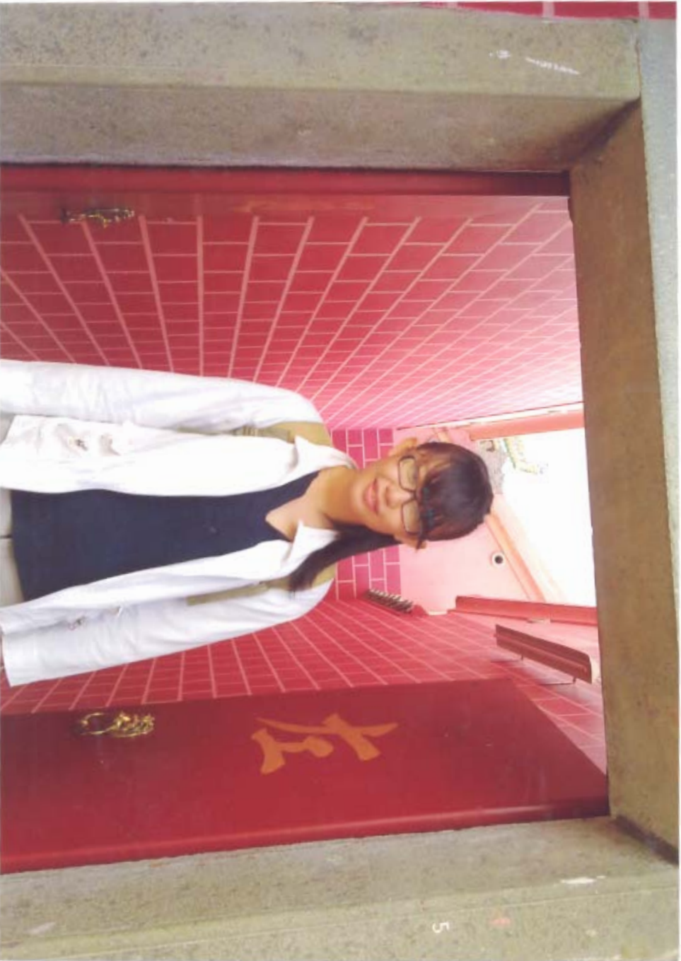
Chùa Ông - Thất phủ Cổ Miếu Di tích lịch sử - văn hóa quốc gia. Công nhận năm