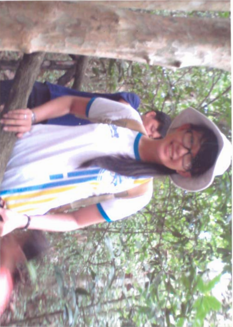
Chuyến Khu D - Căn cứ Trung Ương Cục Miền Nam. Di tích lịch sử cấp quốc gia Công nhận năm 2001.