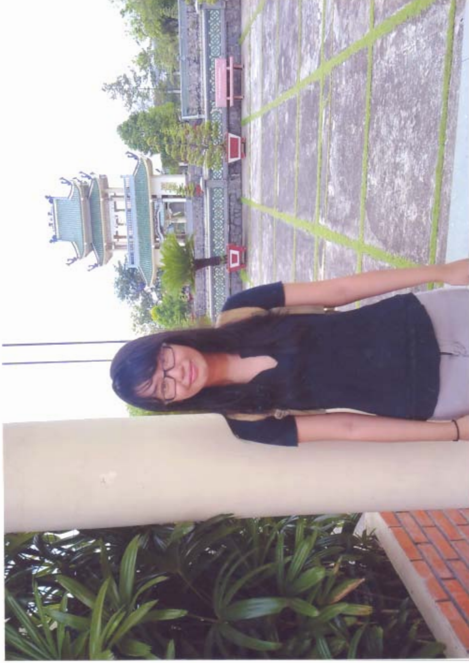
Vân Miêu Nhân Biên Di tích Cấp Quốc gia, công nhận năm