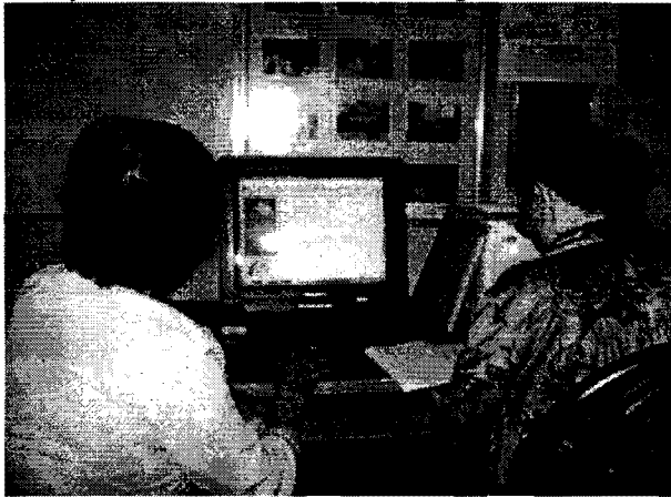
Cùng trao đổi bài.