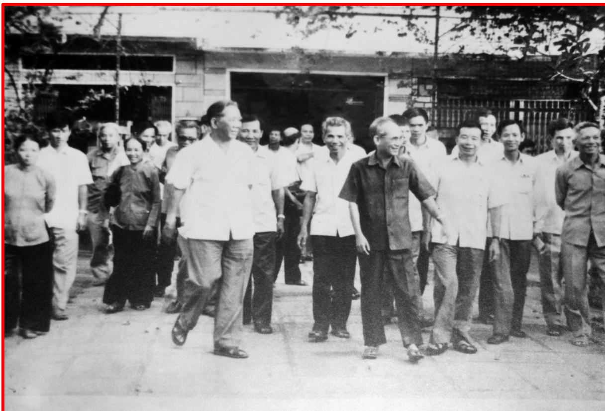
Đ/c Lê Duẩn về tham dự Đại hội