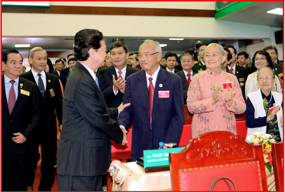
Thủ tướng Nguyễn Tấn Dũng về tham dự Đại Hội