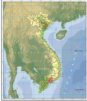
VỊ TRÍ TỈNH ĐỒNG NAI TRONG VIỆT NAM