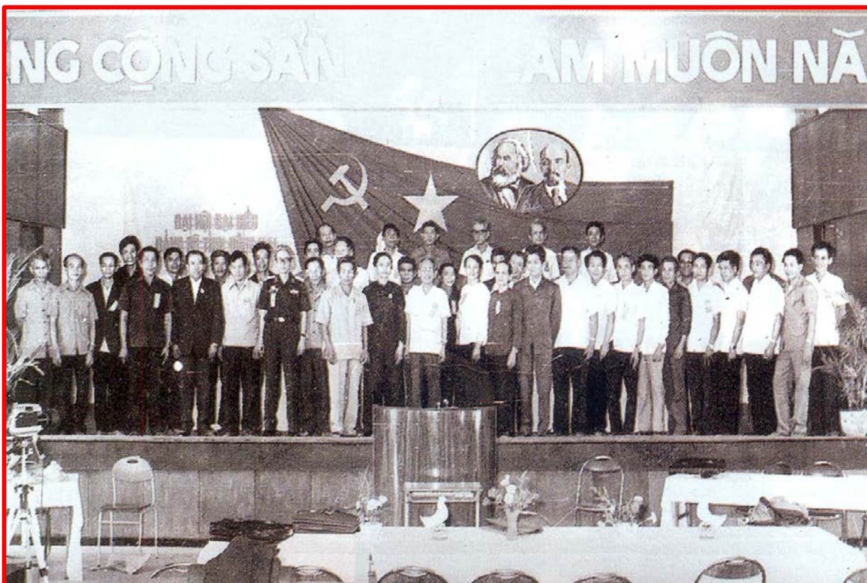
Ban chấp hành ra mắt trước Đại Hội