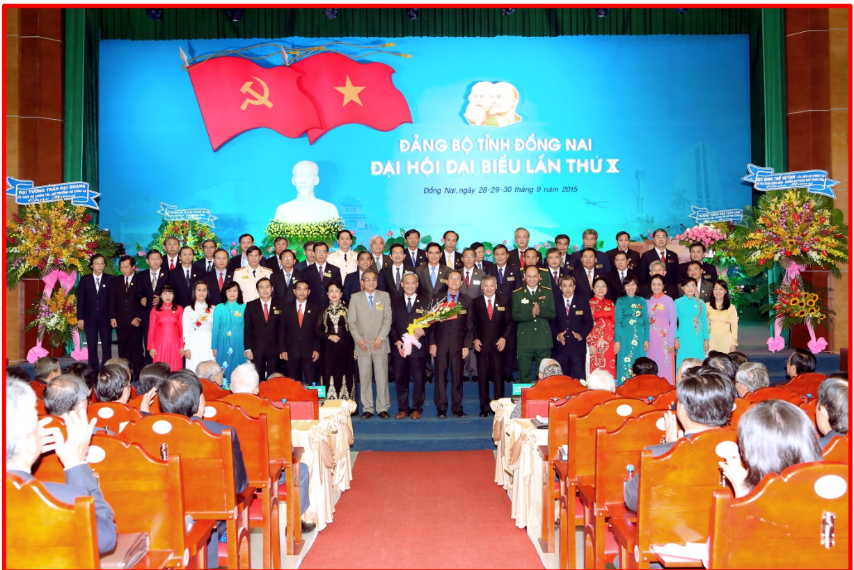
Ban chấp hành ra mắt trước Đại Hội