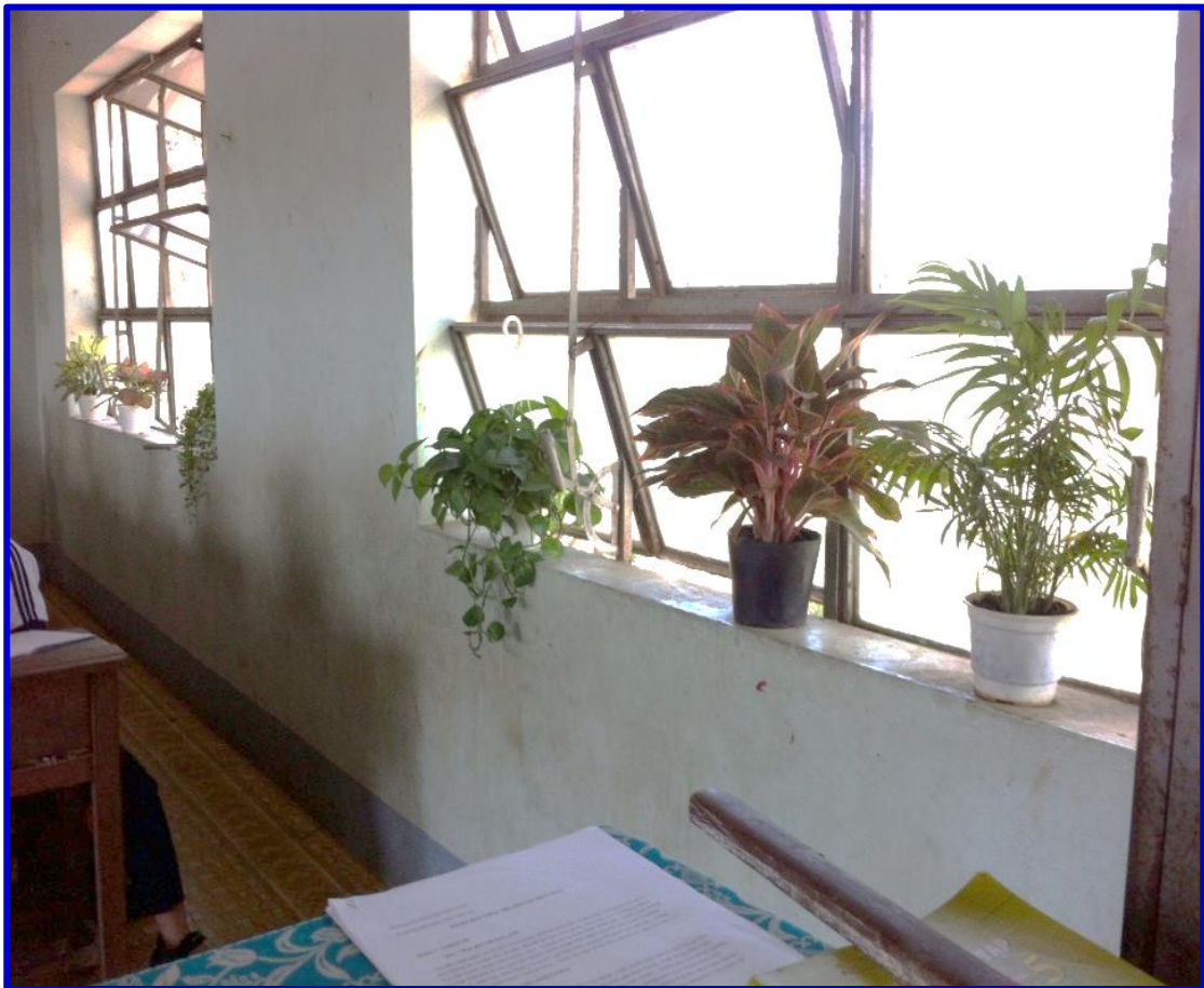
Hình ảnh lớp học thân thiện với môi trường