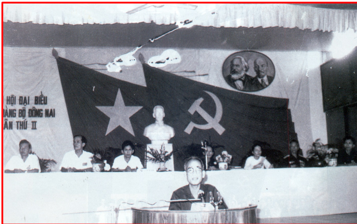
Đoàn chủ tịch báo cáo trước Đại Hội