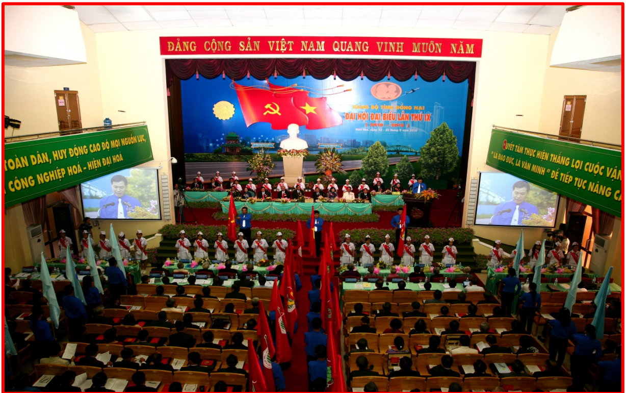
Đoàn Thiếu nhi chúc mừng Đại Hội