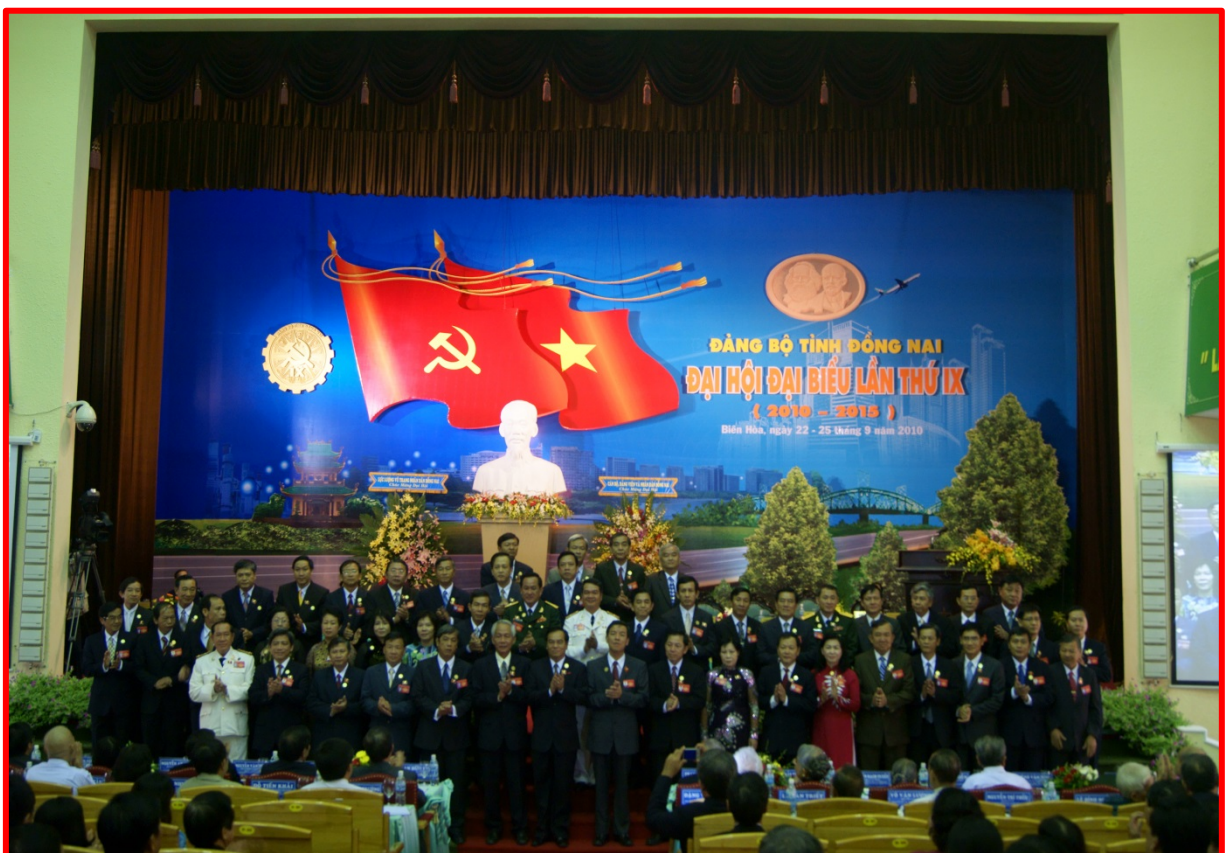
Ban chấp hành ra mắt trước Đại Hội