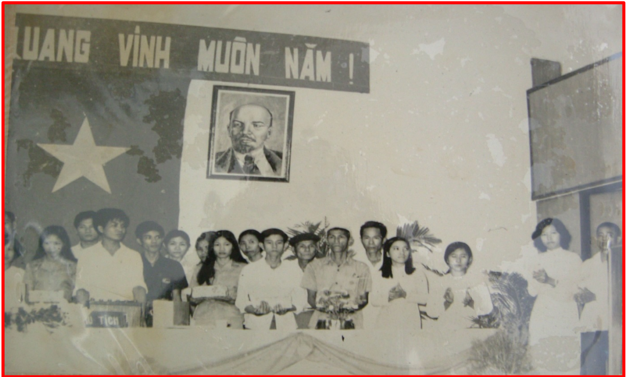
Đoàn đại biểu chúc mừng Đại Hội