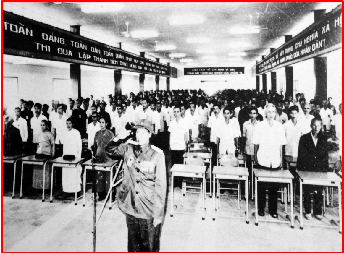
Đại biểu biểu trang nghiêm chào cờ