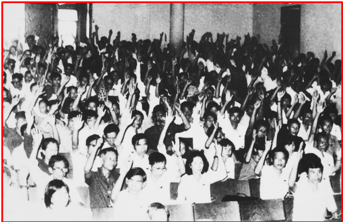
Đại biểu biểu quyết thông qua văn kiện Đại Hội