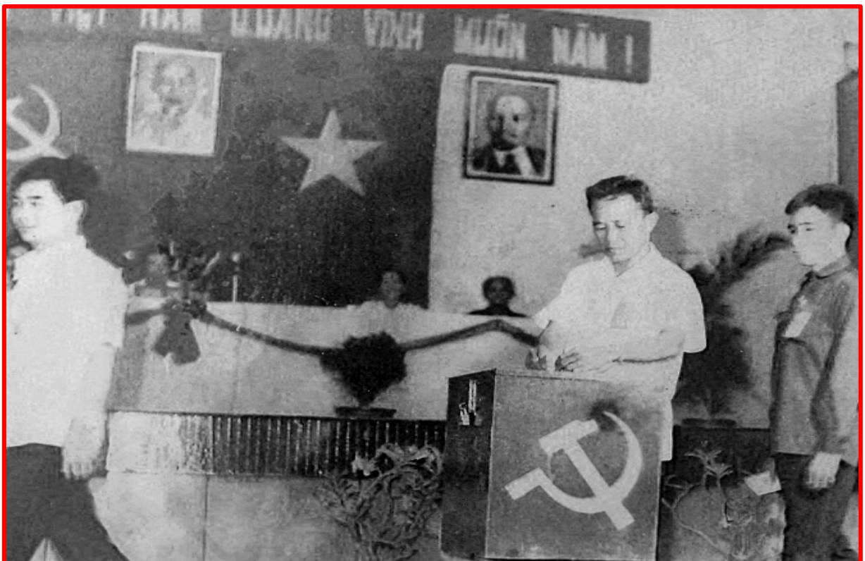
Đoàn đại biểu bỏ phiếu bầu