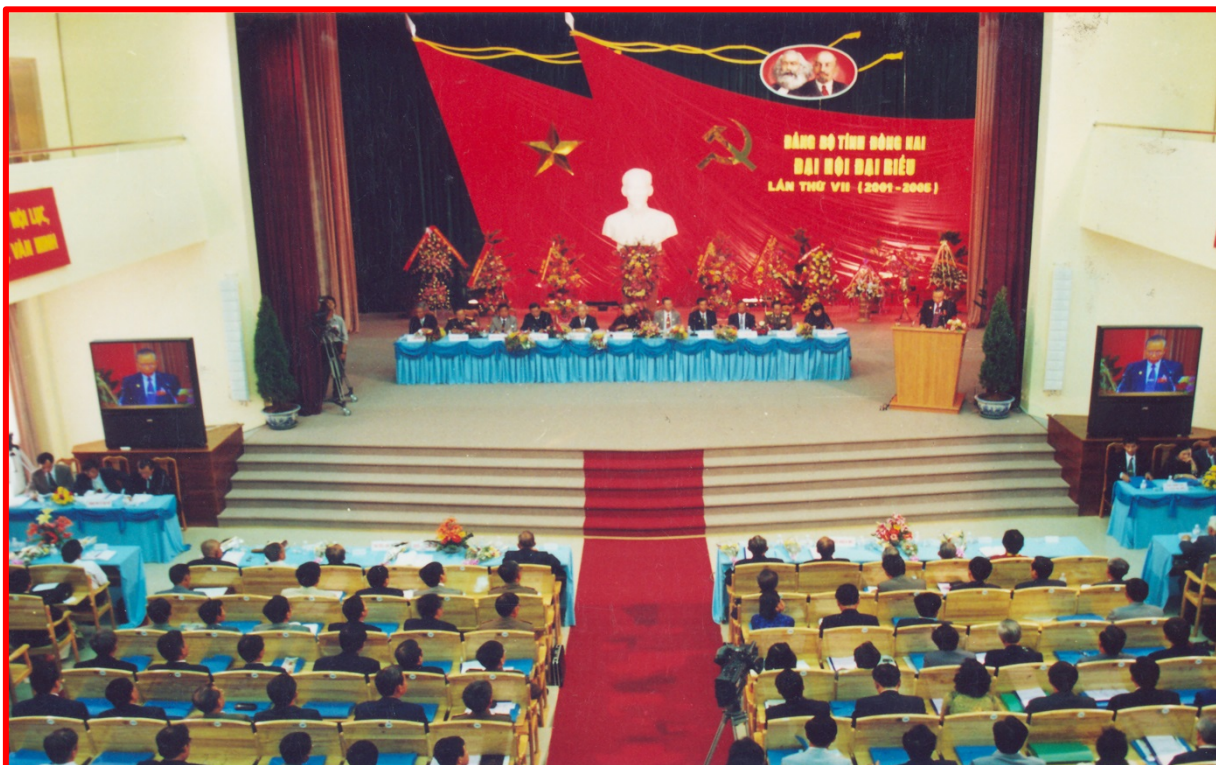
Quang cảnh trong hội trường diễn ra Đại Hội