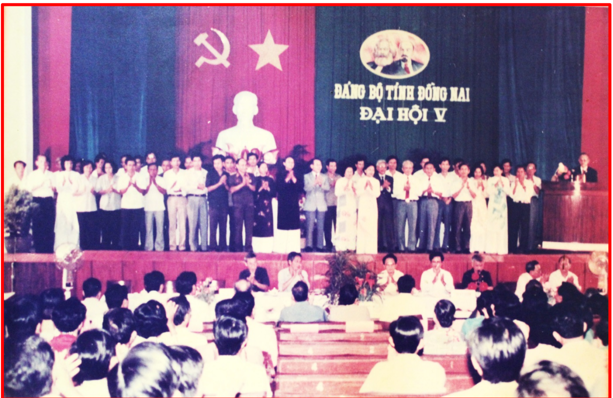
Ban chấp hành ra mắt trước Đại Hội