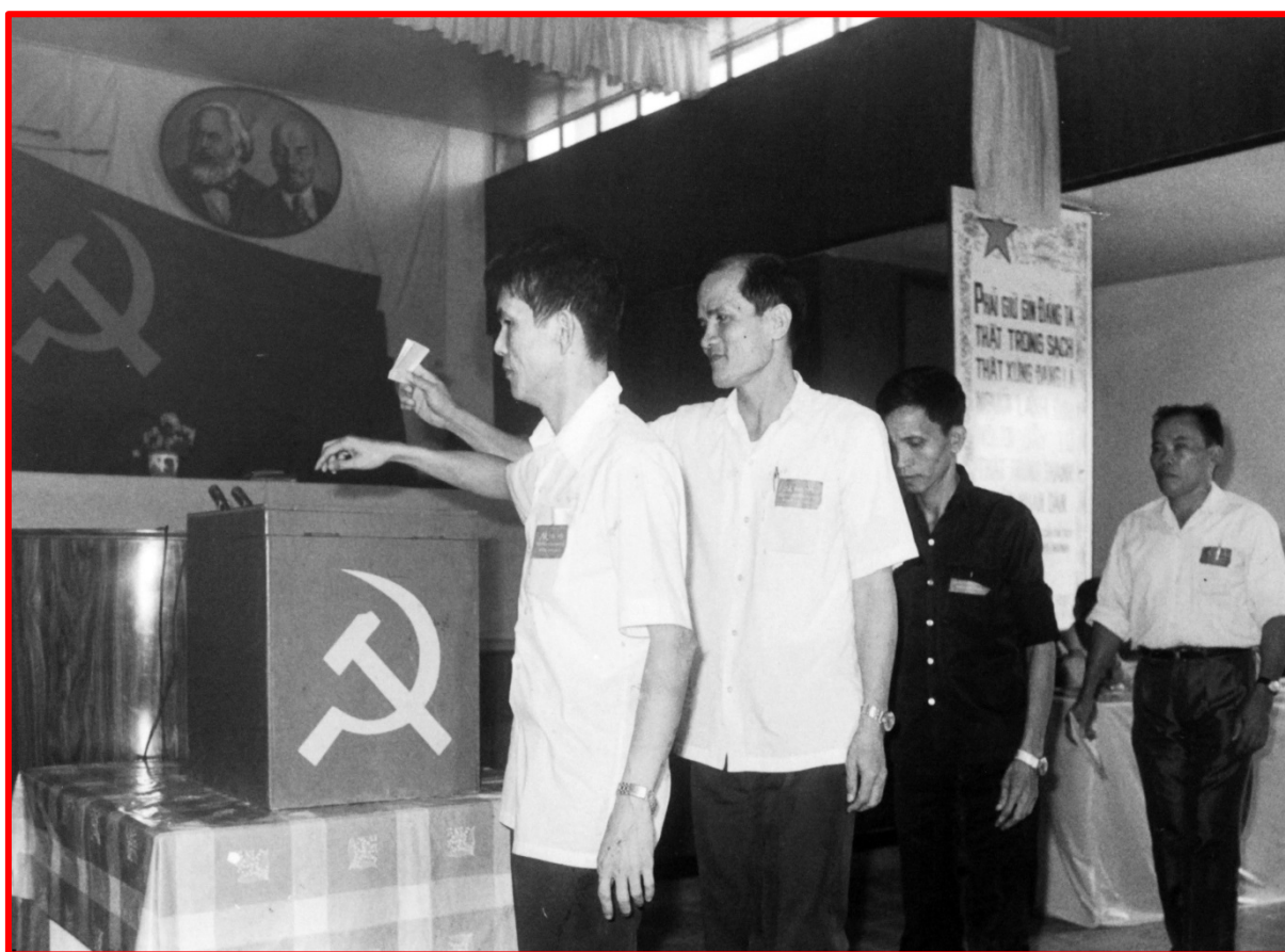
Đoàn đại biểu bỏ phiếu bầu