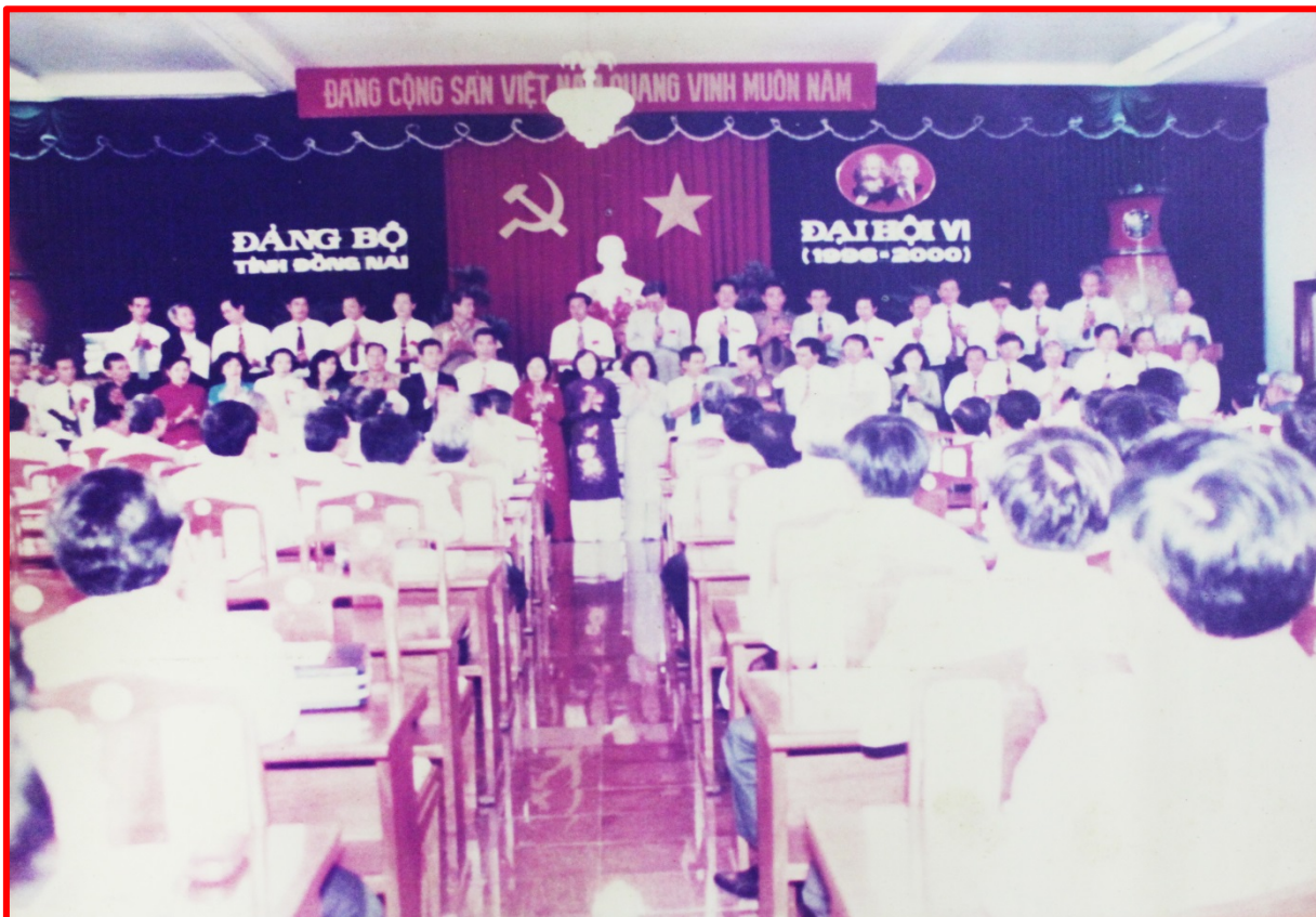
Ban chấp hành ra mắt trước Đại Hội