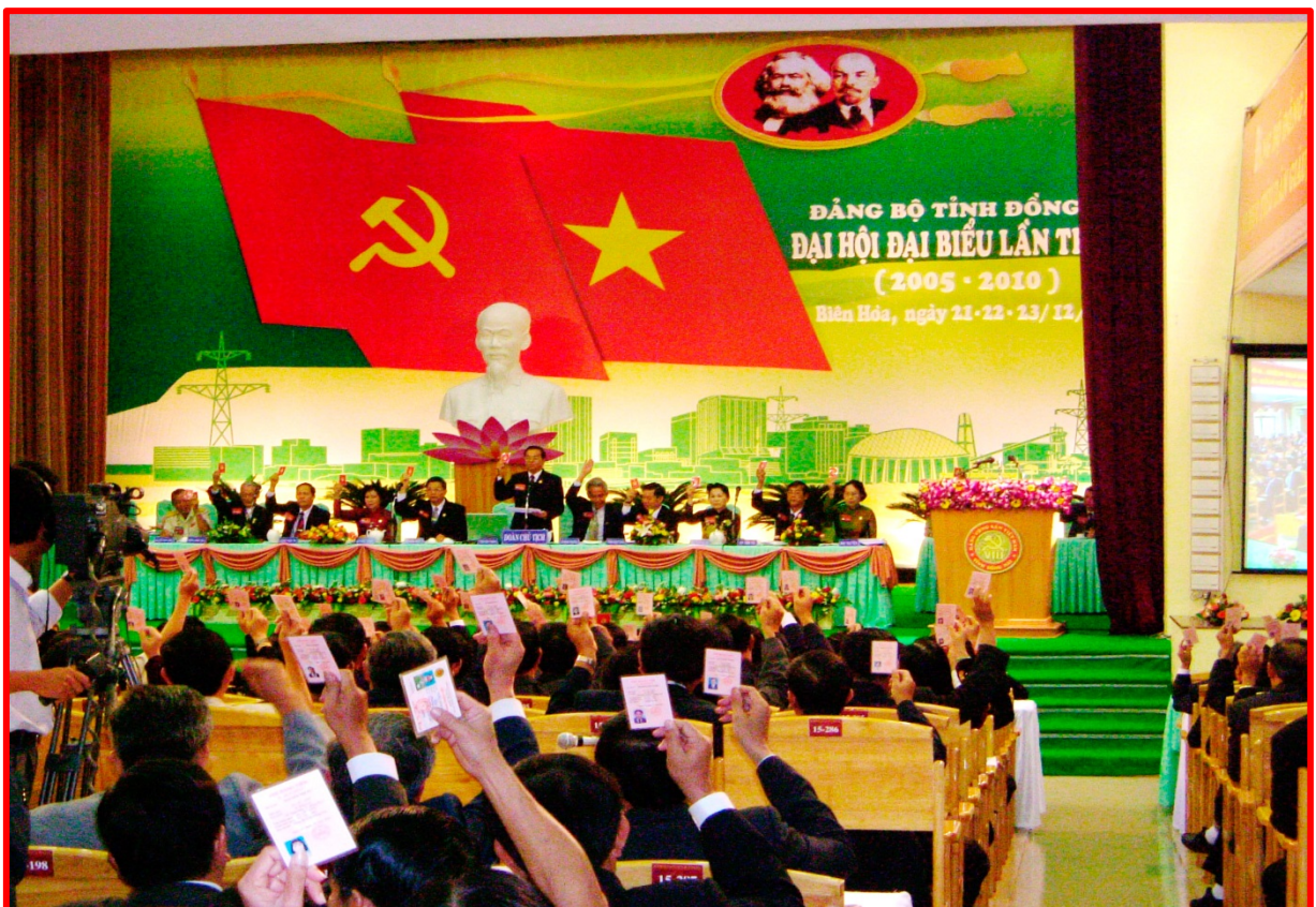
Đại biểu biểu quyết thông qua văn kiện Đại Hội