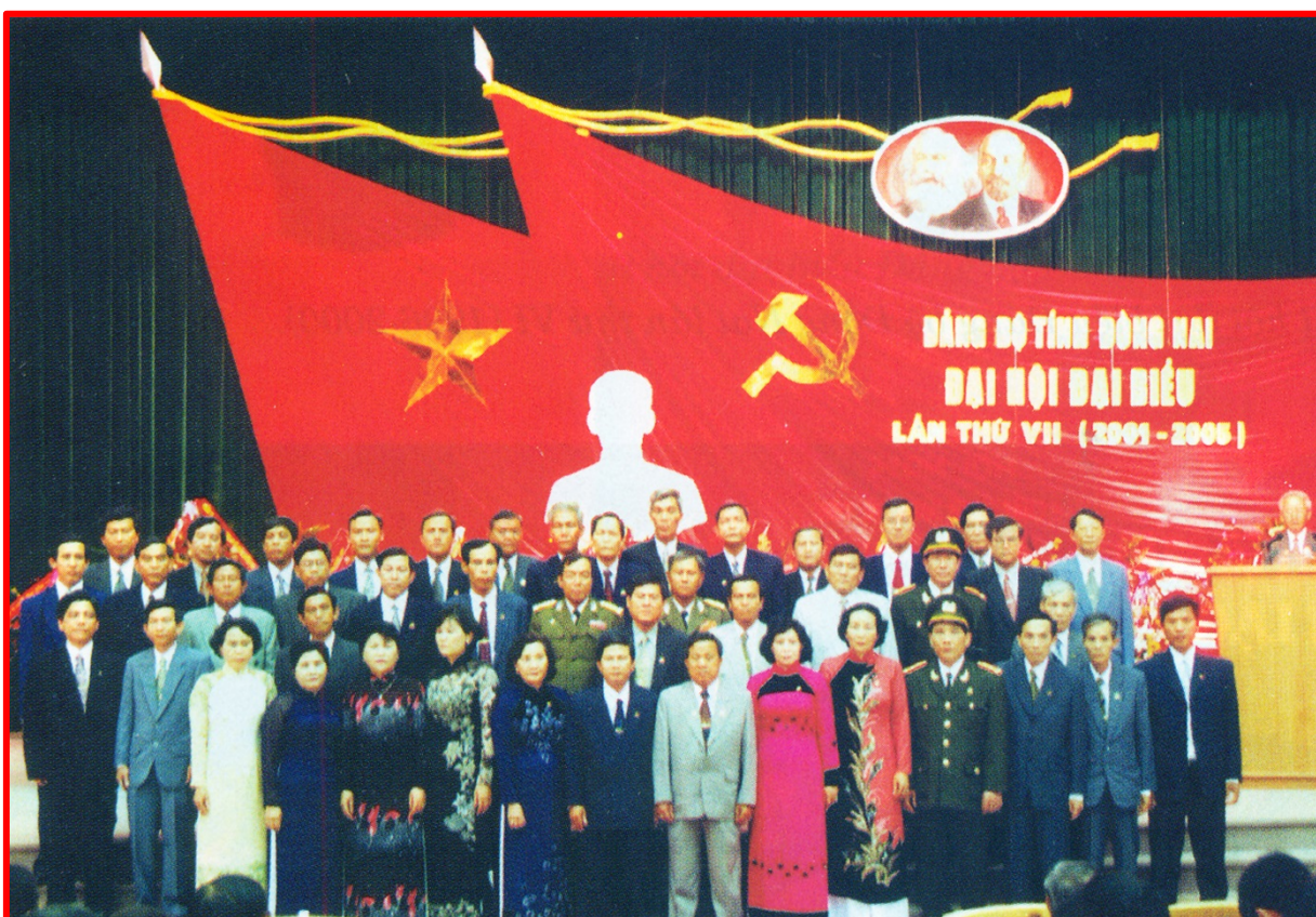
Ban chấp hành ra mắt trước Đại Hội