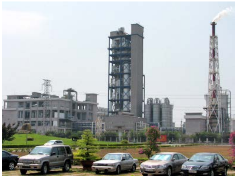
Nhà máy Formosa, 100% vốn của nhà đầu tư Đài Loan ở KCN Nhơn Trạch.

Tỉnh Đồng Nai là địa phương đi đầu trong cả nước về xây dựng và phát triển khu công nghiệp. Các khu công nghiệp của Đồng Nai phát triển mạnh cả về số lượng, khả năng thu hút vốn đầu tư nước ngoài lẫn diện tích đất cho thuê. Đồng Nai cũng là một trong số ít địa phương thu hút được nhiều dự án có qui mô vốn