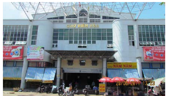
Chợ Biên Hòa