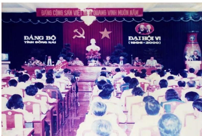
Toàn cảnh Đại hội Đảng bộ tỉnh Đồng Nai lần thứ VI

Tuy nhiên đối với cá nhân tác giả tâm đắc và ấn tượng nhất chủ trương được đưa ra tại Đại hội Đảng bộ tỉnh lần thứ VI năm 1996, đó là: Phấn đấu xây dựng Đồng Nai thành một tỉnh công nghiệp phát triển, từng bước công nghiệp hóa, hiện đại hóa nông nghiệp, nông thôn, đẩy mạnh phát triển thương mại, dịch vụ, du lịch, tiếp tục thực hiện cơ cấu kinh tế công – nông nghiệp – dịch vụ với mức tăng trưởng cao, liên tục, bền vững để đến năm 2000 hình thành cơ cấu kinh tế công nghiệp – dịch vụ – nông nghiệp.