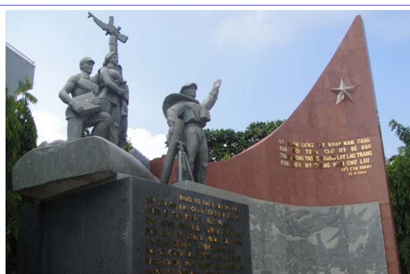
Tượng đài chiến thắng Biên Hòa

Trong chiến tranh cũng như khi đất nước đã hòa bình, thống nhất, truyền thống anh hùng của người Đồng Nai luôn thể hiện sự bình dị, yêu thương, gắn bó và đoàn kết vượt qua mọi khó khăn, thử