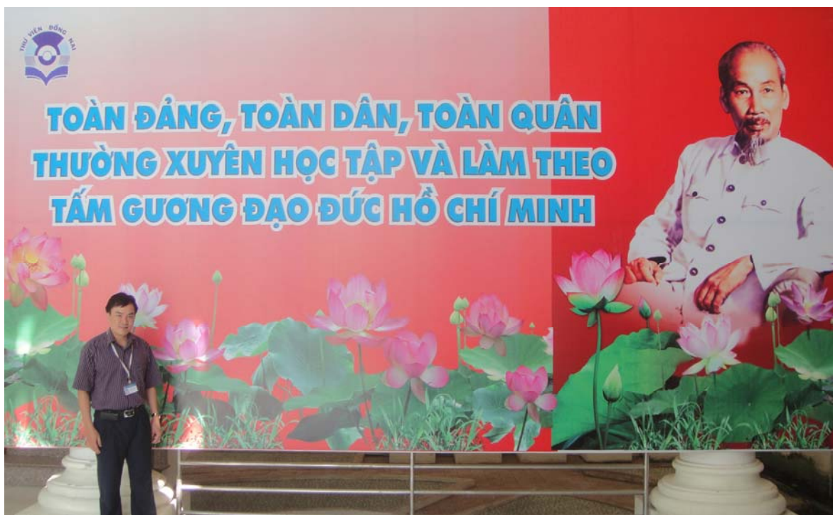
Hình chụp tác giả tại trước sảnh của Thư viện tỉnh Đồng Nai