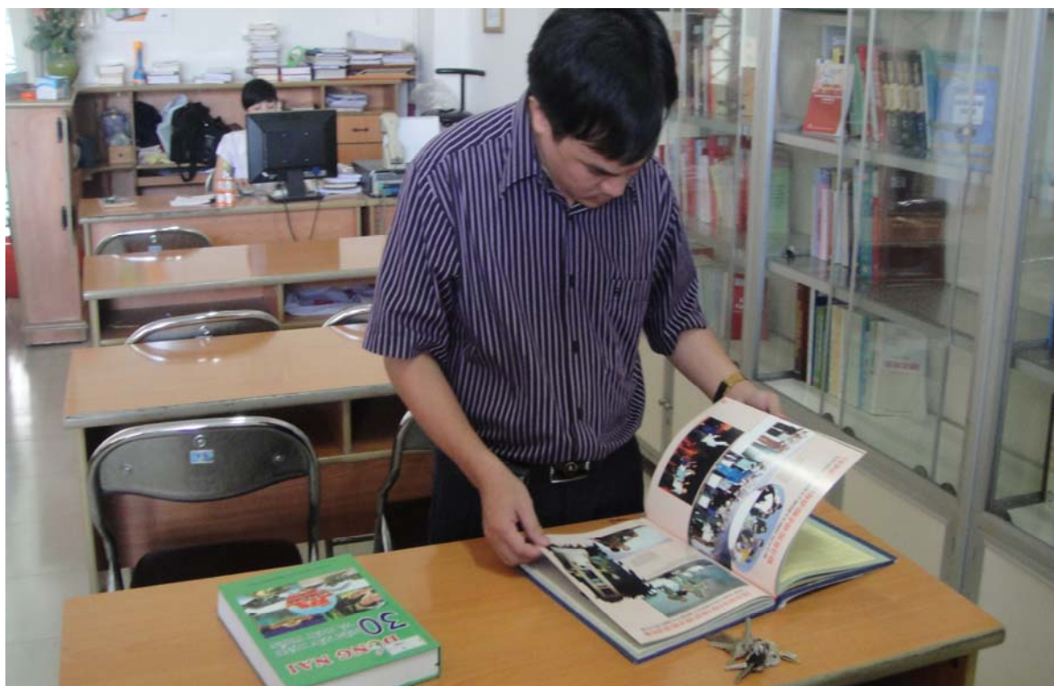
Một thời gian dài tác giả thường xuyên có mặt tại Thư viện tỉnh Đồng Nai để nghiên cứu tài liệu nói về lịch sử Đảng bộ tỉnh Đồng Nai