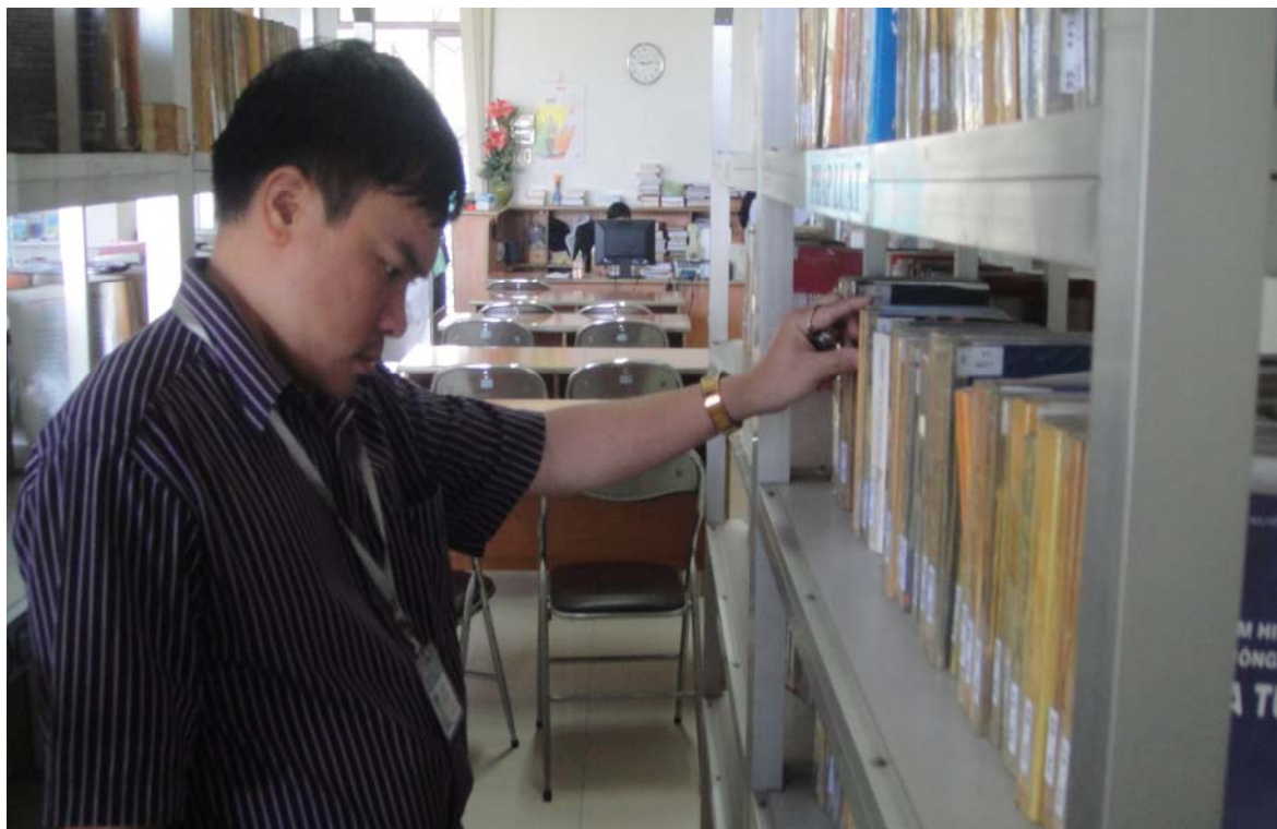
Hình chụp tác giả đang tìm tài liệu tại phòng đọc của Thư viện tỉnh Đồng Nai PHỤ LỤC HÌNH ẢNH