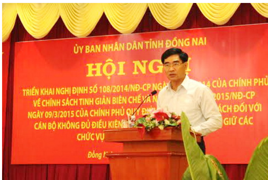
Đồng chí Trần Văn Vĩnh, Phó Chủ tịch UBND tỉnh Đồng Nai chủ trì triển khai Nghị định về chính sách tinh giản biên chế

Có thể nói, tinh giản biên chế, cơ cấu lại đội ngũ cán bộ, công chức, viên chức là chủ trương lớn của Đảng và Nhà nước đã được thực hiện liên tục, thường xuyên trong nhiều năm qua. Đây không chỉ là giải pháp nhằm rút gọn bộ máy, qua đó giảm bớt gánh nặng đối với ngân sách nhà nước, mà còn được xem là một trong những biện pháp quan trọng nhằm nâng cao chất lượng đội ngũ cán bộ, công chức, viên chức, qua đó nâng cao năng lực, hiệu quả của hệ thống chính trị.