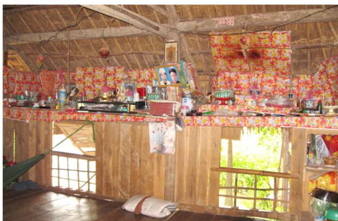
Bàn thờ tổ tiên của người M'ong

Có thể nói, văn hóa Đồng Nai là sự hòa nhập, đan xen, chồng chất, kết tinh bởi nhiều dòng văn hóa, nhiều nền văn hóa thích ứng với điều kiện của vùng đất mới. Dòng văn hóa bản địa của người Chăm, Mạ, Khmer, Xtiêng, Châu Ro... còn lấp lánh trong quan hệ giao lưu với người Việt hiện nay. Dòng văn hóa Trung bộ, Bắc bộ - tài sản tinh thần người Việt mang theo vẫn liền mạch huyết quản, nhưng đến vùng đất mới đã có bước chuyển đổi cho phù