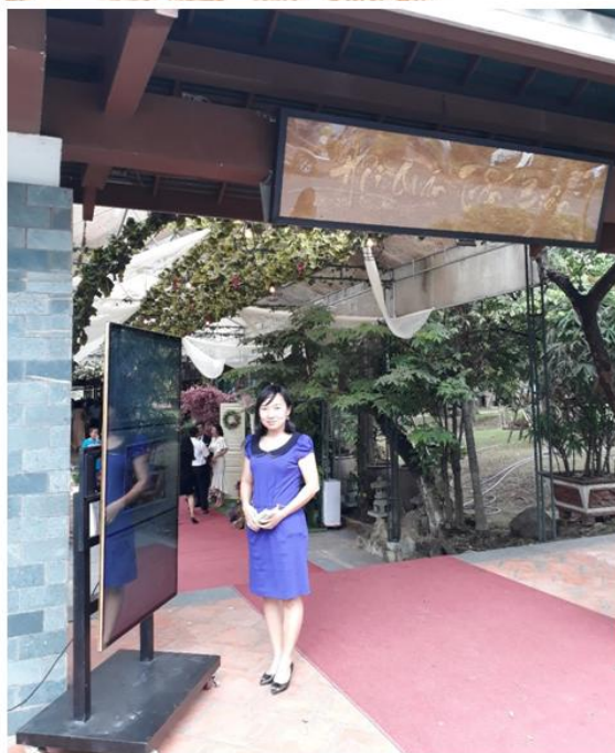
Tác giả tại Hội quán Trấn Biên

Hội quán Trấn Biên được xây dựng năm 2013, với diện tích 1.000m 2 . Hội quán ra đời với mục tiêu trở thành một địa điểm giao lưu văn hóa cho người dân Biên Hòa. Hội quán được thiết kế theo mô hình một quán café sách - nhà hàng với không gian rộng rãi có cả trong và ngoài trời, cùng với phòng triển lãm và sân khấu nhỏ. Thời gian qua, Hội quán Trấn Biên đã đáp ứng được nhu cầu thưởng thức dừng chân của du khách khi tham quan Văn miếu.