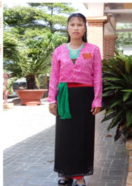
Trang phục dân tộc Mường

- Trang phục truyền thống: Trong các dịp lễ hội hay đám cưới, người Mường, đặc biệt là phụ nữ mặc trang phục truyền thống rất đẹp. Phụ nữ mặc bộ áo váy rất công phu. Trước tiên phụ nữ Mường mặc bên trong là chiếc yếm trắng, sau đó mặc chiếc áo cánh ngắn màu trắng. Tiếp đến, mặc váy dài màu đen bên ngoài. Váy dài bằng vải đen may dài từ thắt lưng tới bàn chân người mặc. Trên lưng váy có chạp thêm một dải vải màu thổ cẩm. Trên chạp váy Mường là những chi tiết hoa văn được dệt rất công phu với hình rồng, công, phượng hoặc trái mây... Hoa văn cũng thể hiện được thành phần giai cấp của người mặc. Nếu đi dự lễ hoặc đám cưới thì người Mường còn thêm bên ngoài một chiếc áo choàng xẻ tà để che phủ từ trên xuống dưới trông rất thướt tha. Trên đầu phụ nữ Mường đội chiếc khăn nhỏ màu trắng che láy mái tóc trên đỉnh đầu. Ngoài bộ trang phục,