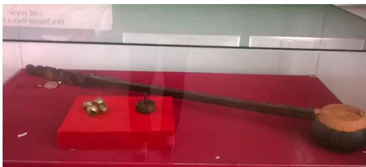
Đàn tình dùng để hát Then của người Tây được trưng bày tại Bảo tàng Đồng Nai

Trong sinh hoạt thông thường, người Đồng Nai xưa có sinh hoạt nghệ thuật: hò hát, lý, kể vè, nói thơ, nói