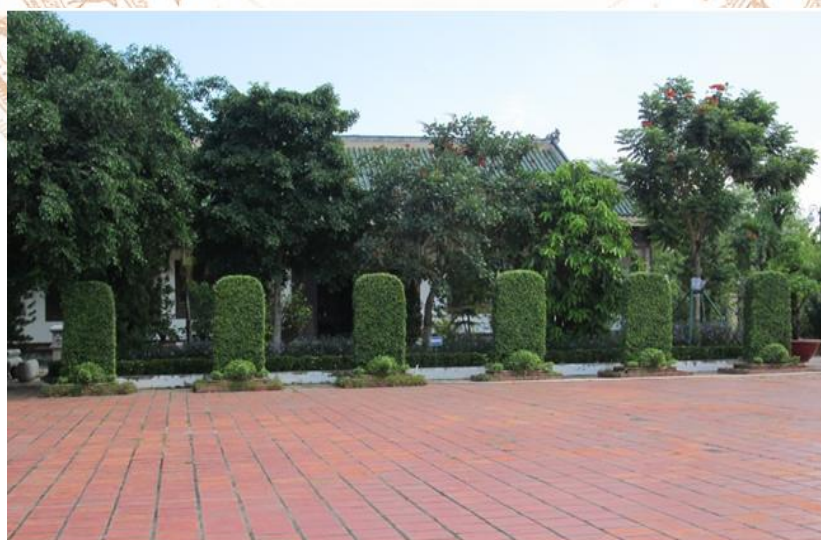
Sân Đại bái

Sân Đại bái hình vuông, lát gạch tàu nối cửa Đại thành, nhà bia Khổng Tử và nhà Bái đường (Nhà thờ chính) theo trục thần đạo; nối nhà Văn vật khố với