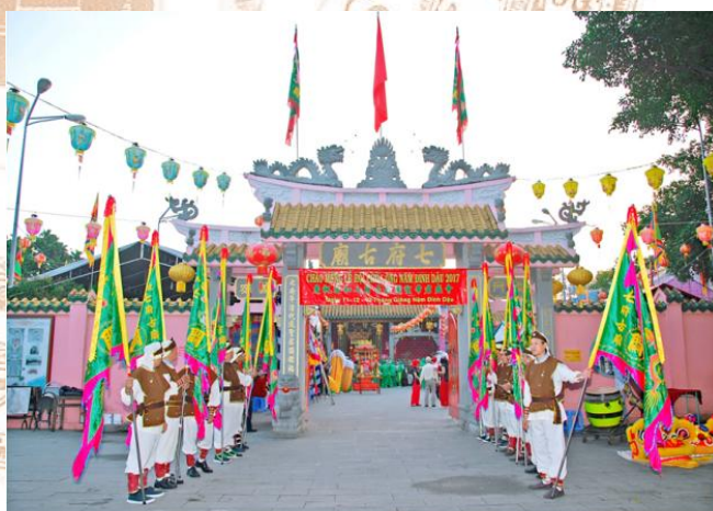
Lễ hội chùa ông.