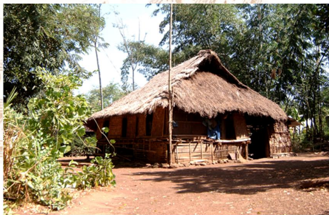
Nhà ở truyền thống của dân tộc Mường (huyện Định Quán)

Với địa hình cư trú tập trung trong rừng sâu, núi cao nên nhà của các dân tộc ở Đồng Nai chủ yếu là loại nhà sàn. Tùy thuộc mỗi dân tộc mà nhà sàn có độ dài ngắn khác nhau. Nhà sàn được dựng trên những cột trụ cao để tránh thú dữ, và sự ẩm ướt của môi trường. Nó thường “cao chừng 1,5m, dựng theo hướng đông tây tránh mặt trời đi qua đòn dông nhà, hai cửa hông có hai thang bằng tre hoặc gỗ. Thang người đi ở bên trái, thang chuồng gà ở tay phải. Nhà có trở một số cửa sổ, cửa ra vào không có cánh để đóng mở mà dựng như phiên liếp. Khoảng giữa rộng rãi là nơi ngồi chơi ăn cơm. Khoảng sàn phía đông được đắp một ô đất chống cháy để làm bếp đun nấu, nửa sàn nhà phía tây là sạp tre dài cao hơn sàn một chút được trải chiếu đệm làm nơi ngủ của gia đình. Phía trên nơi ngủ là bàn thờ nhang cúng nhang lúa”.