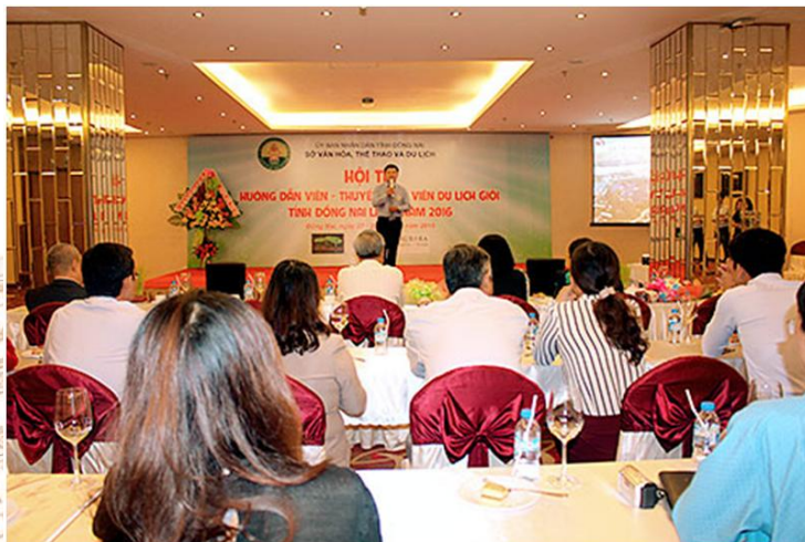
Thí sinh tham gia phần thi thuyết minh về du lịch

thuyết minh viên cần được bồi dưỡng, tự trao đổi kiến thức về di sản văn hóa của vùng đất Biên Hòa - Đồng Nai. Sự hiểu biết sâu sắc về kiến thức văn hóa, con người, vùng đất Đồng Nai là điều kiện thuận lợi cho thuyết minh viên trong công tác hướng dẫn khách tham quan và quảng bá về di tích Văn miếu Trấn Biên;