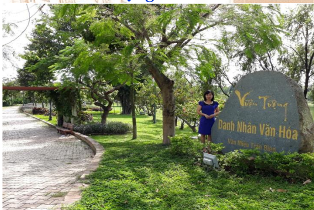
Tác giả chụp ảnh tại Vườn tượng Danh nhân Văn hóa