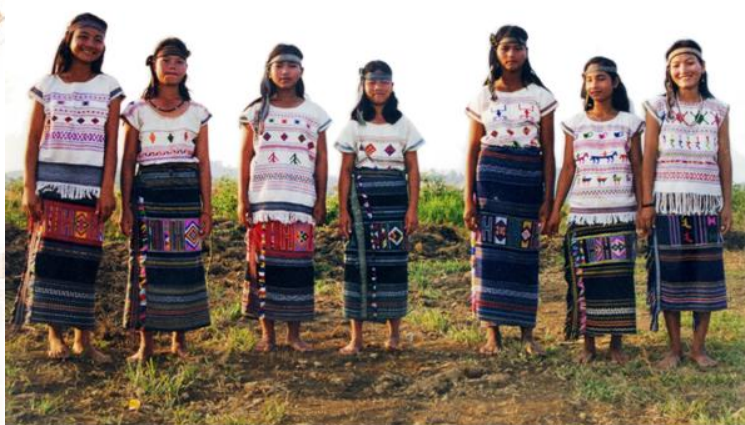
Trang phục của phụ nữ Mạ