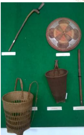
Một số hiện vật của các đồng bào được trưng bày, triển lãm tại Bảo tàng Đồng Nai

Tóm lại, các dân tộc ít người ở Đồng Nai - dù là dân bản địa hay người đến sau - sống bằng nông nghiệp là chính. Đại bộ phận các dân tộc "ăn rừng", "ăn nước trời" làm nương rẫy du canh, đao canh hỏa nậu, quảng canh... nên năng suất cây trồng nói chung thấp.