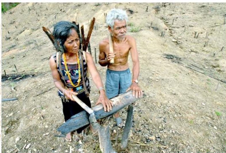
Dân tộc Stiêng canh tác nương rẫy.

+ Chăn nuôi, săn bắn, đánh cá: Mỗi gia đình Stiêng thường chăn nuôi một ít gà vịt, heo; gia đình khá giả thì nuôi trâu, chăn nuôi là sản xuất phụ, chưa có đầu tư gì về khoa học kỹ thuật, trước đây chủ yếu dùng vào các lễ cúng khi vào mùa trồng tía, cúng chữa bệnh, đám cưới, đám ma, mừng được mùa... chứ chưa có sản phẩm hàng hóa. Đến nay, tình hình đã biến đổi, ở ấp 4 xã Xuân Hưng (huyện Xuân Lộc) có gia đình nhờ chăn nuôi heo đã có thể xây nhà gạch chắc chắn. Ngoài thời giờ làm nương rẫy, đàn ông Stiêng còn tranh thủ săn bắn thú rừng: voọc, cheo, mên, nai, heo rừng... xưa kia còn săn bắn các thú lớn: voi, cạp, gấu... Công cụ săn bắn là ná và tên độc. Vào mùa khô, bà con thường bắt cá dưới suối bằng cách lấy rễ cây tầm đàn hoặc trái buông giã nát rồi thả xuống khúc suối. Cá trúng độc nổi lên, người ta lấy rỏ vớt.