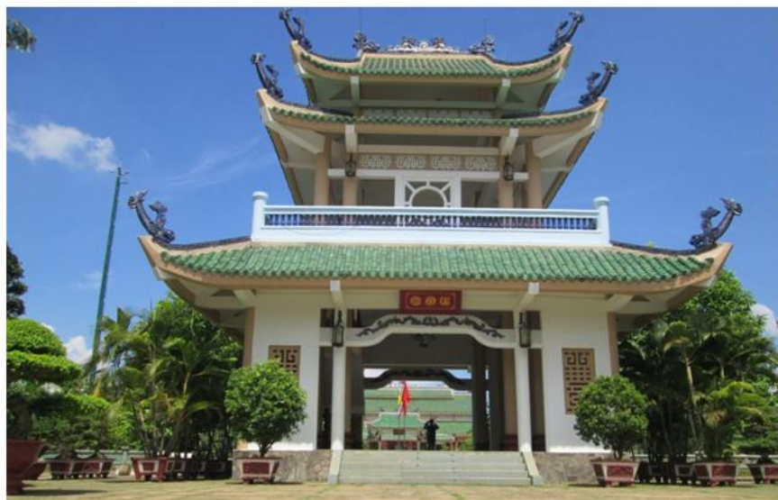
Khuê Văn Các

Khu thứ 3 được tiếp nối bởi Khuê Văn các, có diện tích 10m 2 , được xây dựng trên một nền vuông; kiến trúc cổ lâu, mái lợp ngói lưu ly màu xanh ngọc bằng gốm tráng men; các đầu đao được gắn phù điêu cách điệu hình chim hạc bằng gốm men xanh cong vút, biểu trưng cho sự cao quý, thanh khiết, trường thọ và an lạc. Trên đỉnh mái trang trí hai con rồng cách điệu trong tư thế hồi long và “Lưỡng long châu nguyệt”. Theo cách lý giải truyền thống về thiên thể: Khuê là tên một ngôi sao trong chòm 28 sao, là đầu bạch hổ phương Tây, có 16 ngôi sao sắp xếp khúc khuỷu giống hình chữ Văn. Trong sách hiếu kinh có ghi: “Khuê chủ văn chương”, về sau người ta coi sao Khuê biến hóa là người đứng đầu của quan văn.