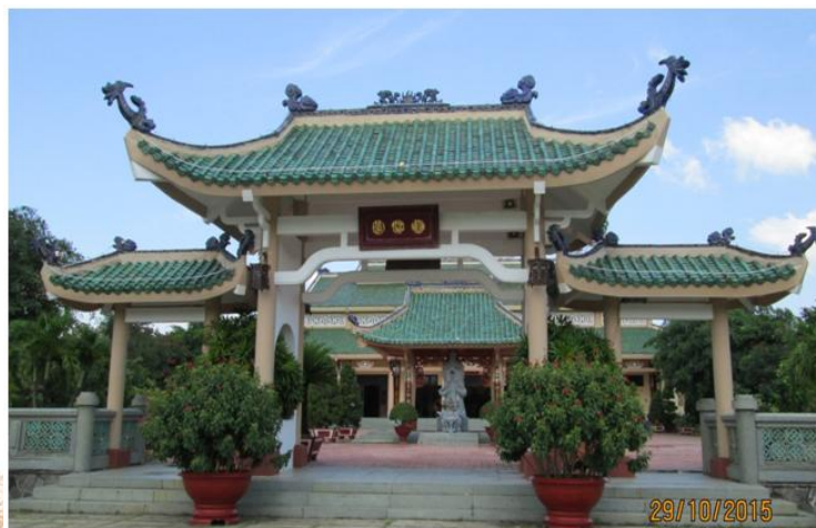
Văn Miếu môn

Khu nội tự của Văn miếu Trấn Biên tôn nghiêm được ngăn cách với không gian bên ngoài bằng hệ thống tường rào bằng sắt xung quanh. Văn Miếu môn là cổng ra vào của Văn miếu, nơi ngăn cách không gian bên trong với bên ngoài. Văn miếu môn có kiến trúc kiểu tam quan, một cổng chính và hai cổng phụ; mái dạng cổ lầu, lợp ngói lưu ly màu xanh ngọc bằng gốm tráng men, hệ thống đầu đao được gắn phù điêu cách điệu hình chim hạc bằng gốm men xanh cong vút biểu tượng cho sự cao quý, thanh khiết, trường thọ, bền vững, cao sang và an lạc.