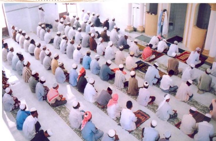
Lễ cầu nguyện trong tháng Ramadan của dân tộc Chăm (Xuân Hưng, Xuân Lộc)

- Lễ hội: Người Chăm sử dụng lịch riêng gọi là Hồi lịch, lịch này quy định một năm có 12