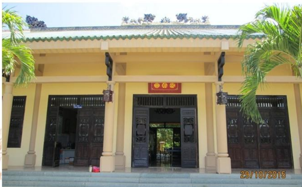
Nhà Đề danh

Đối xứng với Nhà truyền thống là Nhà đề danh, là nơi ghi danh những cá nhân, đơn vị tập thể đã có công đóng góp to lớn cho sự nghiệp văn hóa, khoa học, giáo dục của tỉnh Đồng Nai sẽ được ghi danh trong bảng vàng, đề danh trên bia đá. Nhà đề danh được thiết kế và có diện tích giống như Nhà truyền thống. Hiện nay, Nhà đề danh là nơi làm việc của Trung tâm Văn miếu Trấn Biên.