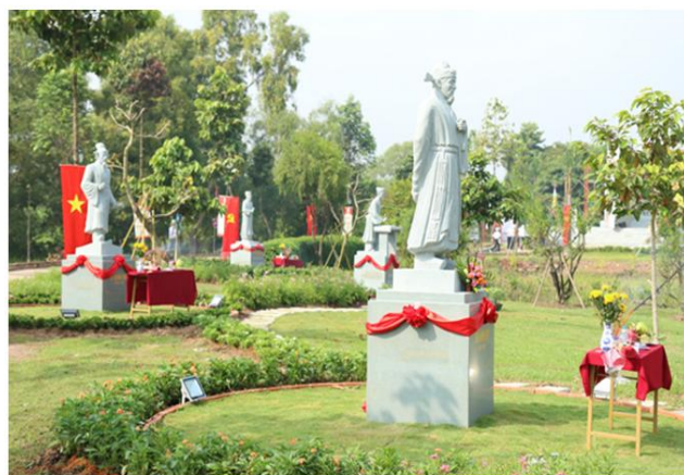
Vườn tượng Danh nhân – Nơi tôn vinh văn hóa – giáo dục Việt Nam