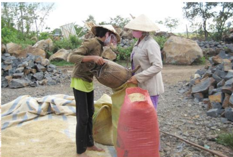
Dân tộc Koho phơi lúa