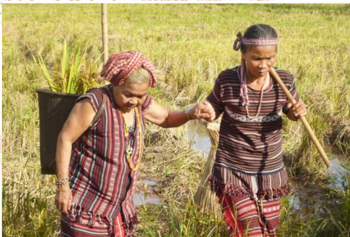
Trang phục dân tộc Châu Ro

+ Về ăn uống: Người Châu Ro ăn cơm tẻ là chính, canh bèo, đọt mây nướng, lá nhíp ống thục là thức ăn quen thuộc. Người Châu Ro hút thuốc lá sợi bằng tẩu. Trong dịp lễ, tết thường có: cơm lam, thịt nướng, rượu cần.