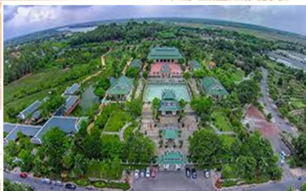
Toàn cảnh Văn Miếu Trấn Biên