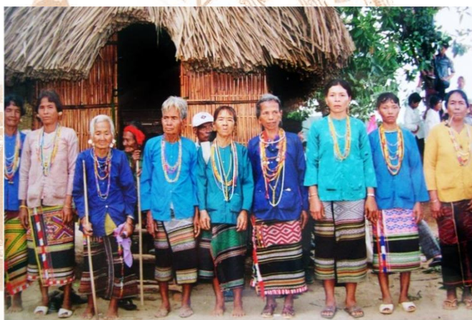
Trang phục truyền thống của đồng bào dân tộc Stieng

Xưa kia các dân tộc bản địa ở Đồng Nai cũng có hội đồng già làng như các dân tộc ở Tây Nguyên - Trường Sơn, ngày nay không còn nữa. Nhà sàn dài cũng biến mất khoảng vài chục năm nay. Chế độ theo dòng cha ở các mức độ khác nhau. Các đơn