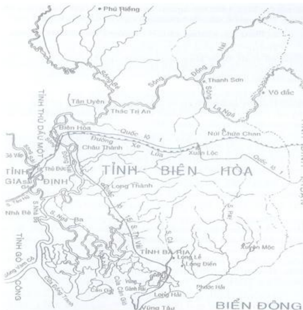
Bản đồ tỉnh Biên Hòa thời thuộc Pháp

Đối với chính quyền thực dân, tỉnh Biên Hòa vẫn giữ nguyên cơ cấu như giai đoạn trước. Trong năm 1951, chính quyền thuộc địa, Pháp đổi quận Bà Rá thành quận Sông Bé, cắt chuyển vào tỉnh Thủ Dầu Một.