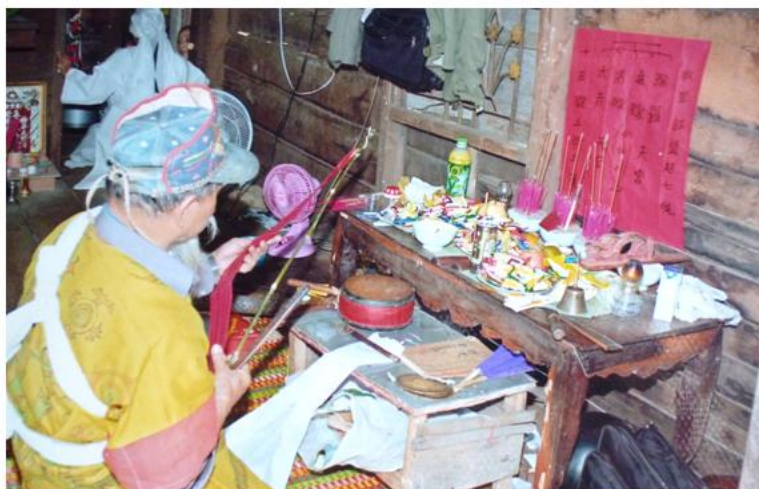
Nghi lễ cúng trong đám tang của dân tộc Nùng

Vào dịp Tết, người Nùng mua giấy lì xì màu đỏ in trang kim dán trước cửa ra vào mong được hên trong mọi việc làm ăn. Việc dán giấy lì xì có thể là do họ chịu ảnh hưởng của người Hoa. Ở bếp, người ta cũng thờ ông Táo nhưng không có lệ cúng ông Táo châu Trời ngày 23 tháng chạp. Người ta cấm kỵ việc nấu thịt chó, mèo, trâu ở bếp vì sợ xui. Các món thức ăn để cúng nhất thiết không được dùng thịt các loại gia súc nói trên.