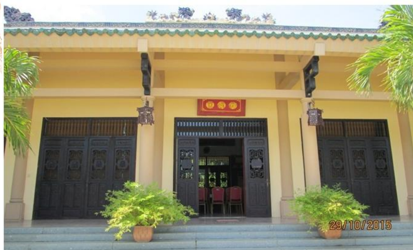
Nhà Truyền thống

Nằm bên trái hồ Thiên quang tỉnh, là nơi giao lưu họp mặt, hội thơ, tọa đàm về lịch sử sự hình thành và phát triển; văn hóa, khoa học, giáo dục, con người xứ Đồng Nai xưa và nay. Hiện tại, Nhà Truyền thống có trưng