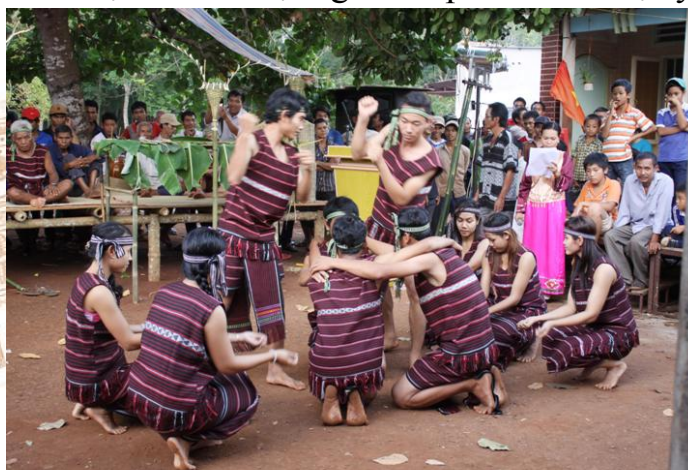
Lễ hội Sayangva.

Mỗi một năm các dân tộc thường tổ chức các buổi lễ hội kéo dài hàng ngày, thậm chí cả tuần như lễ hội mừng Lúa mới của người Mạ, người Stiêng, lễ hội Đâm trâu, lễ cầu mưa... Để tổ chức một buổi lễ hội người ta phải chuẩn bị kỹ càng mọi thứ trong nhiều ngày với thật nhiều lễ vật như trâu, lợn, gà, trầu cau, gạo nếp, cơm lam... Cùng với các nghi lễ trình trọng là các tiết mục sinh hoạt văn hóa nghệ thuật cộng đồng: múa, hát, đánh công chiêng, thổi khèn... Đó là cách mà người đồng bào dân tộc gửi lời cảm tạ tri ân tới thần linh đã ban cho họ một năm no đủ, mùa màng bội thu, mưa thuận gió hòa.