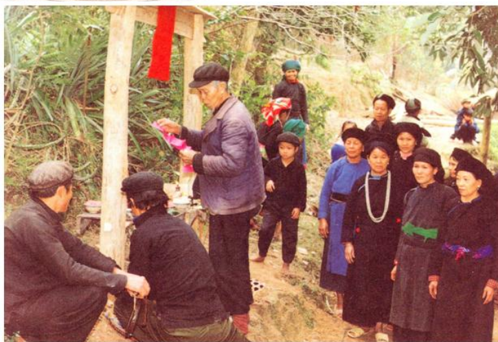
Lễ mừng năm mới của dân tộc Tày

Sinh hoạt vật chất của người Tày hiện nay tương đối giống người Việt. Tuy nhiên phong tục tập quán vẫn được họ lưu giữ. Người Tày, ăn uống giống người Hoa hơn người Việt. Buổi sáng họ nấu cháo và hai bữa cơm chính. Họ ăn các món chiên xào