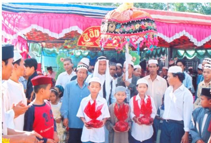
Lễ cưới của dân tộc Chăm (xã Xuân Hưng, Xuân Lộc)