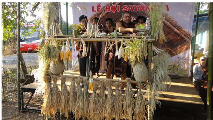
Cúng thần lúa, nghi thức chính của lễ hội SaYangVa