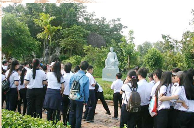
Học sinh tham quan Vườn tượng Danh nhân văn hóa

Chủ tịch Hồ Chí Minh, Chu Văn An, Nguyễn Trãi, Nguyễn Bình Khiêm, Nguyễn Du, Lê Quý Đôn... Cần đề danh, ghi danh tôn vinh những hiền tài, nguyên khí quốc gia ở địa phương; ghi danh các Tiên sĩ có công lao to lớn đối với địa phương... có hình thức bảng vàng hoặc bia đá để lưu giữ lâu dài như: Đối với những cử nhân Nho học sẽ