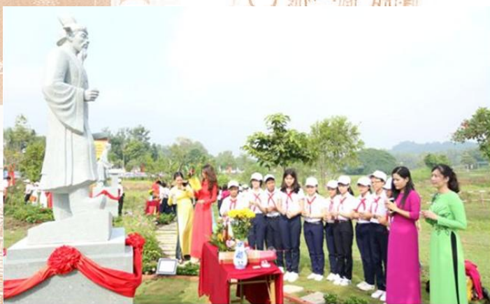
Giáo viên và học sinh đến dâng hương tại vườn tượng danh nhân

Hàng năm, vào ngày 23/4, Trung tâm Văn miếu Trấn Biên phối hợp với Ban Tuyên giáo Tỉnh ủy, Sở Giáo dục và Đào tạo, Sở Văn hóa, Thể thao và Du lịch, Sở Thông tin Truyền thông, Nhà xuất bản Đồng Nai, Hội Văn học Nghệ thuật tỉnh... tổ chức “Ngày hội sách và văn hóa đọc” tại Văn miếu Trấn Biên nhằm hưởng ứng thông điệp của UNESCO về “Ngày sách và bản quyền thế giới 23/4”. Việc tổ chức “Ngày hội sách và văn hóa đọc” nhằm nâng cao nhận thức, ý thức của người dân, đặc biệt tầng lớp thanh thiếu niên, sinh viên, học sinh về giá trị, tầm quan trọng về việc đọc sách đối với việc giáo dục và hình thành nhân cách con người: Chân - thiện - mỹ. Từ đó có kế hoạch tuyên truyền, khuyến khích việc đọc sách, hình thành thói quen đọc, tạo nên nền tảng quan trọng cho việc tự học, học tập suốt đời của các tầng lớp nhân dân, góp phần xây dựng xã hội học tập. “Ngày hội sách và văn hóa đọc” cũng là dịp để tôn vinh sách, tác giả, tác phẩm, tôn vinh những người làm việc trong lĩnh vực xuất bản, phát hành, thư viện, quảng bá sách với công chúng của tỉnh;