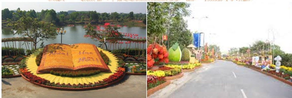
Đường hoa Văn miếu Trấn Biên ngày tết

Hàng năm, nhiều chương trình sinh hoạt văn hóa lớn, những sự kiện quan trọng của tỉnh, thành phố Biên Hòa đã chọn và giao cho Văn miếu Trấn Biên thực hiện như: tổ chức các hoạt động dâng hương tưởng nhớ chủ tịch Hồ Chí Minh kỷ niệm ngày sinh và ngày mất của Chủ tịch Hồ Chí Minh (19/5 và 21/7 âm lịch); các hoạt động về nguồn, triển lãm, tọa đàm, sinh hoạt chuyên đề giới thiệu về cuộc đời và sự nghiệp các danh nhân văn hóa được thờ trong Văn miếu; các ngày lễ Tết thầy vào ngày 03/01 (âm lịch), ngày giải phóng miền Nam thống nhất đất nước (30/4), ngày Quốc khánh (02/9), ngày Nhà giáo Việt Nam (20/11),... Các ngày lễ này được tiến hành lễ theo nghi thức cổ truyền và hiện đại với những sinh hoạt phù hợp và các hình thức sinh hoạt văn hóa lành mạnh, đa dạng, phục vụ nhu cầu tín ngưỡng và giải trí của nhân dân, du khách trong và