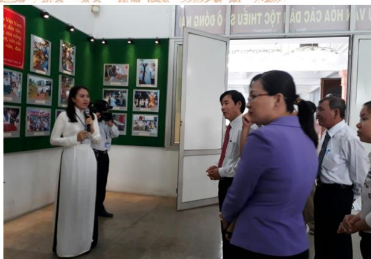
Đại biểu nghe thuyết minh triển lãm Sắc màu các dân tộc thiểu số tại Bảo tàng Đồng Nai

Vấn đề dân tộc có vị trí chiến lược, quan trọng trong sự nghiệp cách mạng nước nhà. Sinh thời Chủ tịch Hồ Chí Minh đã nói: “... Đồng bào Kinh hay Thô, Mường hay Mán, Gia Rai hay Ê đê, Xê Đăng hay Ba Na và các dân tộc thiểu số khác, đều là con cháu Việt Nam, đều là anh em ruột thịt. Chúng ta sống chết có nhau, sướng khổ cùng nhau, no đói giúp nhau... ”. Nhận thức được giá trị nhân văn đó, trải qua hơn ba thế kỷ hình thành và phát triển, cộng đồng các dân tộc (trên địa bàn tỉnh Đồng Nai có khoảng 37 dân tộc) đã gắn bó với nhau trong suốt tiến trình lịch sử đấu tranh chống kẻ thù xâm lược, bảo vệ bờ cõi, giành độc lập, tự do và xây dựng quê hương đất nước. Những năm qua, được sự quan tâm của Đảng và Nhà nước, dưới sự lãnh đạo, chỉ đạo của các cấp