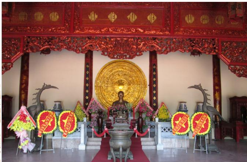
Nhà Bái đường

Qua sân Đại bái là Nhà Bái đường, đây là công trình kiến trúc quan trọng nhất của quần thể kiến trúc Văn miếu Trấn Biên. Nhà Bái đường được xây dựng theo kiến trúc cổ (ba gian hai chái); gồm 7 gian được phân định với nhau bằng các hàng cột.