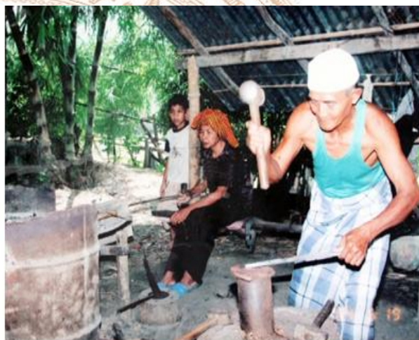
Nghề rèn của dân tộc Chăm ở Đồng Nai

Trên địa bàn tỉnh Đồng Nai hiện có các nghề và làng nghề truyền thống như: Đan lát, mây tre tại phường An Bình, thành phố Biên Hòa; đan sọt tại xã Phú Sơn, huyện Tân Phú; trồng dâu nuôi tằm tại xã Nam Cát Tiên, huyện Tân Phú và xã Xuân Bắc, huyện Xuân Lộc; may thêu, kết cườm, dệt vải tại phường Tân Mai, thành phố Biên Hòa; dệt thổ cẩm tại xã Tà Lài, huyện Tân Phú và thị trấn Định Quán, xã Túc Trưng, huyện Định Quán; gỗ mỹ nghệ tại xã Bình Minh, huyện Trảng Bom; chạm khắc đá tại phường Bửu Long, thành phố Biên Hòa; gốm mỹ nghệ tại xã Tân Hạnh và xã Hóa An, thành phố Biên Hòa; chế biến tinh bột tại xã Trà Cỏ, huyện Trảng Bom; nghề bánh tráng tại xã Thạnh Phú, huyện Vĩnh Cửu; trồng bưởi tại xã Tân Bình, huyện Vĩnh Cửu; trồng và chế biến các sản phẩm từ chuối tại huyện Định Quán và huyện Tân Phú; trồng chôm chôm, sầu riêng tại thị xã Long Khánh... Nói chung, các nghề đan lát, dệt... chưa tách khỏi nghề nông và chưa có sản phẩm hàng hóa đáng kể, chủ yếu mang tính tự cung tự cấp.