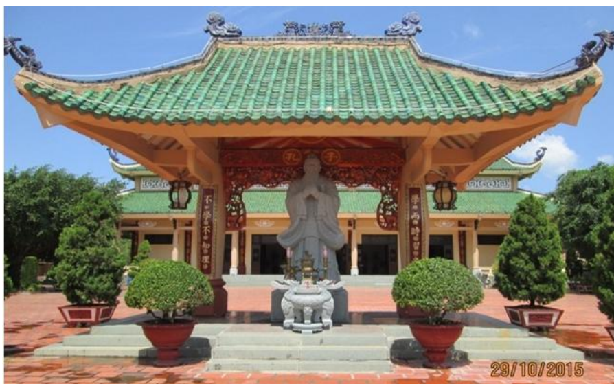
Miếu thờ Khổng Tử

Qua cửa Đại thành là nhà bia thờ Khổng Tử có diện tích khoảng 5m 2 , có kiến trúc đơn giản, hai cột đỡ mái; mái lợp ngói lưu ly màu xanh ngọc bằng gốm tráng men, các đầu đao được gắn phù điêu cách điệu hình chim hạc bằng gốm men xanh cong vút - biểu trưng cho sự cao quý, thanh khiết, trường thọ và an lạc. Bên trong đặt tượng Khổng Tử làm bằng đá xanh Bửu Long nguyên khối. Mẫu tượng Khổng Tử được thực hiện theo mẫu ở vườn Luận ngữ - Khu di sản văn hóa thế giới, Khúc Phụ, Sơn Đông, Trung Quốc