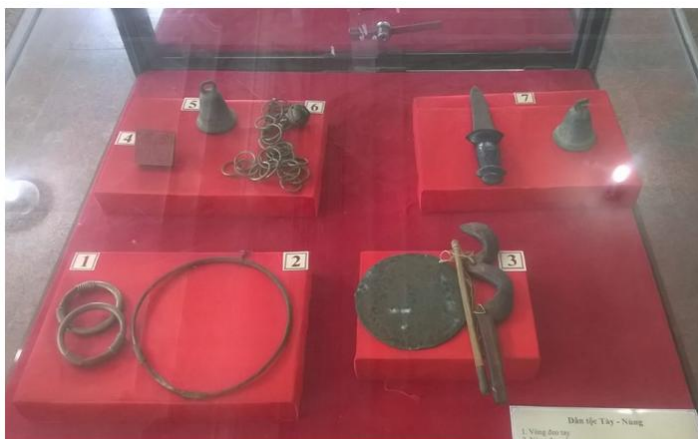
Trang sức của dân tộc Tày - Nùng