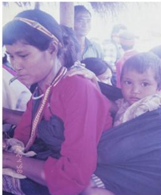
Tục điệu con của dân tộc Stiêng

Chồng chết, vợ cắt tóc ngắn; vợ chết, chồng cạo trọc hàm ý để tang. Ba ngày sau, gia đình người quá cố cúng mở cửa mã là lễ cúng cuối cùng (do chịu ảnh hưởng phong tục một số dân tộc anh em). Người Stiêng không cúng giỗ hàng năm. Chỉ khi nào gia đình có người đau ốm, đi coi bói, thấy nói do ông bà