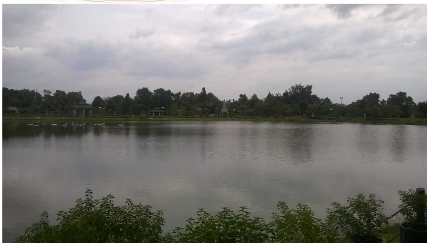
Toàn cảnh Vườn tượng Danh nhân Văn hóa Văn Miếu Trấn Biên