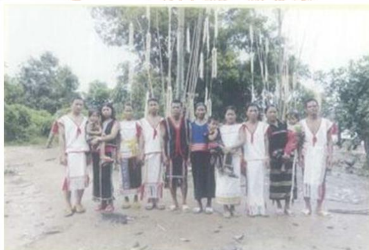
Người Rơ Măm trong trang phục truyền thống

Dân tộc Rơ Măm cũng như nhiều dân tộc khác, đó là tín ngưỡng vạn vật hữu linh. Tất cả các sự vật, hiện tượng đều gắn với thần và ma. Các vị thần gọi chung là Yàng, chưa phân định rõ ràng, thứ bậc nhưng một lòng thờ phụng để cầu xin sự che chở từ đấng siêu nhiên dành cho những con người bé nhỏ. Quản lý xã hội truyền thống tộc người chủ yếu là do già làng (chủ làng), hội đồng già làng, nay có thêm hệ thống quản lý của Nhà nước.