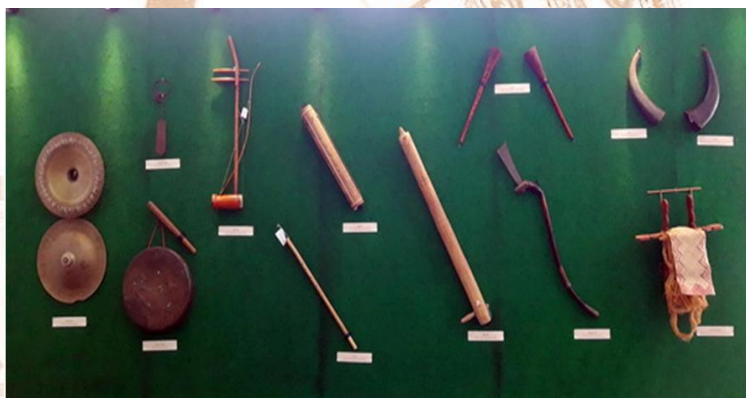
Bộ nhạc cụ của các dân tộc được trưng bày tại triển lãm tại Bảo tàng Đồng Nai

Tiếp nối quá trình phát triển lịch sử, cư dân Miền Nam nói chung, dân cư Đồng Nai nói riêng họ đã sáng tạo nên rất nhiều loại nhạc khí và thể loại âm nhạc để phục vụ trong các lễ hội cúng các thần linh cũng như sử dụng trong đời sống hàng ngày để bộc lộ tâm tư tình cảm và để lưu truyền cho con cháu, hay để giao tiếp với thế giới thần linh trong tâm tưởng, ước mơ một cuộc sống ấm no hạnh phúc. Các loại nhạc cụ dân gian độc đáo như đàn đá Bình Đa, đàn tính (hát then), sáo trúc, cồng chiêng đồng, thanh la, khèn bầu, khèn môi.