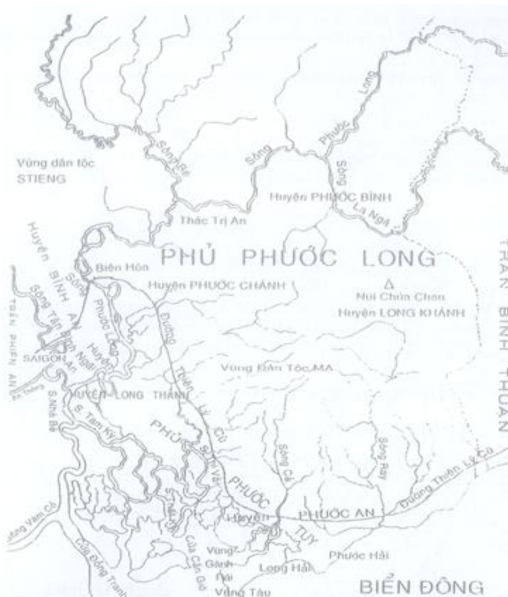
Bản đồ Vùng đất Biên Hòa – Đồng Nai thời phủ Phước Long

Từ năm 1837, tỉnh Biên Hòa có 2 phủ Phước Long, Phước Tuy và 6 huyện: Phước Chánh, Bình An, Long Thành, Phước An; hai huyện mới là Long Khánh, Ngãi Giao. Phủ Phước Tuy thành lập trên cơ sở 2 huyện Long Thành, Phước An. Huyện Long Khánh thành lập trên cơ sở tách phần đất phía Bắc của 2 huyện Long Thành, Phước An gồm 6 tổng: Long Xương, Long Cơ, An Trạch, An Viễn, Tập Phước và Khánh Nhân. Huyện Ngãi An được thành lập trên cơ sở người dân thiểu số ở thủ An Lợi hợp với 3 tổng người Kinh chia thành 5 tổng.