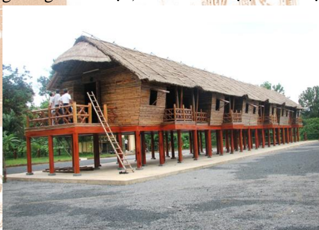
Nhà dài của dân tộc Châu Ro

Về ngôn ngữ, tiếng nói thuộc nhóm ngôn ngữ Môn – Khmer, ngữ hệ Nam Á, cuộc sống gắn với hệ sinh thái rừng núi trung du miền Đông; có quan hệ mật thiết với các tộc người Mạ, Xtiêng, Koho, Raklây; hình như các tộc người này có quan hệ “họ hàng” với nhau về nguồn gốc dân tộc, tổ chức xã hội, sinh hoạt văn hóa... cũng như người Mạ, Xtiêng, Koho, người Châu Ro chưa có chữ viết, việc truyền bá kiến thức cho thế hệ sau đều theo lối truyền khẩu. Hiện nay trên địa bàn Đồng Nai, người Châu-Ro có khoảng 16.169 người chiếm 8,55% nhân khẩu là đồng bào dân tộc thiểu số trên toàn tỉnh, xếp đứng thứ 4 trong gần 40 thành phần dân tộc tỉnh Đồng Nai.