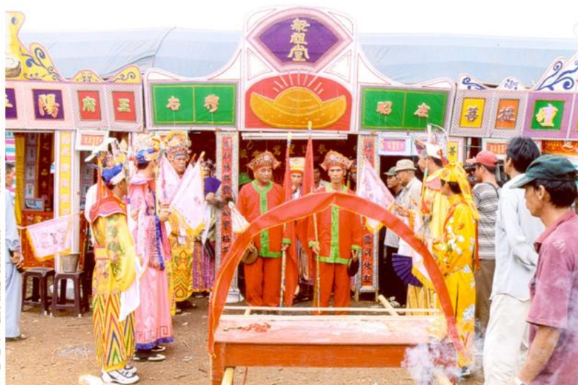
Lễ hội Tả Tài Phán của dân tộc Hoa

Lễ cưới của người Hoa ngày nay tương tự người Việt, thường chia làm hai giai đoạn. Khi đôi trai gái ưng nhau và được hai gia đình chấp thuận thì người