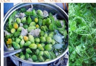
Lau cá thác lác với khổ qua