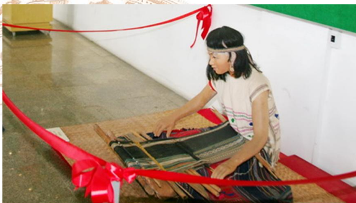
Quá trình dệt thổ cẩm được phục dựng và triển lãm tại Bảo tàng Đồng Nai

Các dân tộc ở Đồng Nai, đa phần là các dân tộc thiểu số thường tập trung sống trong rừng hoặc sườn đồi với địa hình núi cao. Chính vì thế đời sống kinh tế của họ đều bắt đầu với việc săn bắt thú rừng và hái lượm rau quả, với lối sống du canh du cư. Đàn ông thường vào rừng săn bắt tập thể hay làm nương rẫy với dụng cụ ná, tên, dao, rìu, cuốc... Thiên chức của người phụ nữ thường là công việc dệt vải, chăm con và thêu thùa.