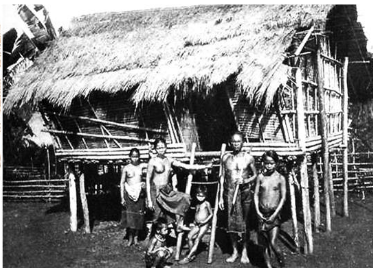
Nhà ở truyền thống của dân tộc Stiêng