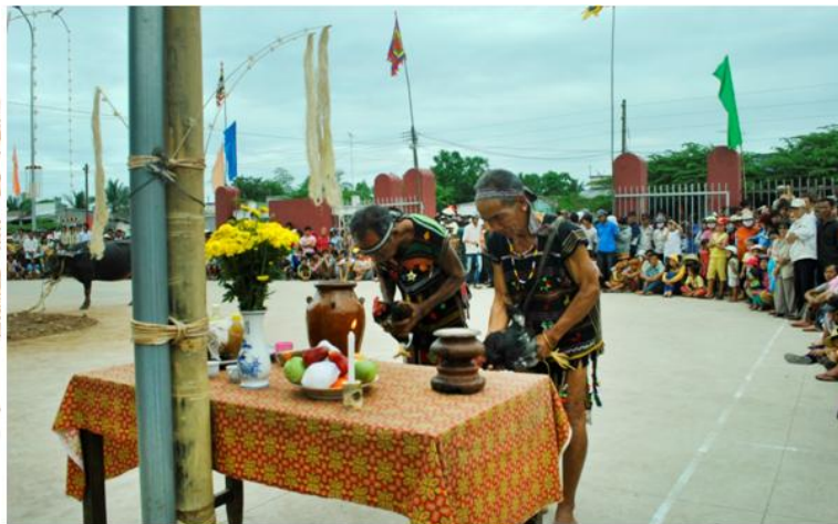
Già làng dân tộc Mạ khấn thần linh trong lễ hội Yang Bonom.

Là cư dân nông nghiệp cổ truyền, mỗi năm họ có nhiều lễ cúng. Người Mạ ở ấp Hiệp Nghĩa (thị trấn Định Quán) coi ngọn núi Đàng Kar gần đó là nơi linh thiêng có chư thần cư ngụ nên xưa kia thường cúng Yang bonom vào cuối năm âm lịch. Cả cộng đồng cư dân Mạ trong ấp góp lễ vật, cử một già làng đọc lời khấn cầu phúc cho bòn . Người ta làm lễ cúng thần rừng ( yu xin bri ) vào dịp Tết âm lịch tại nhà tôm bri - vị già làng đại diện bảo vệ chủ quyền, đất đai nương rẫy và khu vực rừng thuộc phạm vi bòn . Bắt đầu mùa vài trận, bà con làm lễ cúng hồn lúa ( lở Yàng túyt kòi ) tại rẫy trước khi chọc lỗ tía hạt... Lúa vào đồng, bà con lễ tạ ơn lúa mẹ ( yú tam non ).