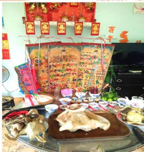
Lễ vật cúng chu xiu của dân tộc Hoa (Định Quán)

Gia đình người Hoa mang tính chất phụ hệ gia trưởng sâu sắc. Tộc trưởng xưa kia có quyền uy nhất định đối với các thành viên trong dòng họ. Ngày nay, tình hình đã thay đổi nhiều, người giàu thường có uy thế hơn tộc trưởng. Gia đình người Hoa xưa kia là gia đình lớn, có khi mấy thế hệ cùng chung sống. Nếu năm thế hệ cùng sống dưới một mái nhà (ngũ đại đồng đường) thì gia đình đó được coi là đại phúc. Nay gia đình nhỏ thay thế gia đình lớn, số gia đình ba thế hệ cùng sống chung không nhiều. Trong nhà, người cha hoặc người chồng làm chủ, quyết định mọi việc lớn, nhỏ. Trước đây, con gái Hoa ít được học hơn con trai, ngày nay tình hình đã thay đổi, họ được học hành ngang nam giới, tham gia nhiều công tác xã hội, dần dần tiến tới sự bình đẳng nam nữ thực sự.