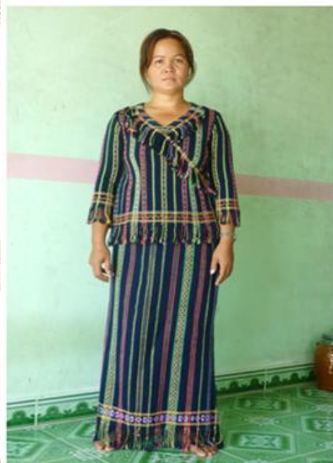
Trang phục của dân tộc Koho

Phụ nữ Koho mặc váy có hoa văn, áo và quần khăn trên đầu. Búi tóc thường cài chiếc lược sừng trâu và con dao nhỏ cán cong, nhiều cô trang điểm thêm chiếc lông chim pling vào các dịp lễ hội. Đồ trang sức của phụ nữ phong phú hơn nam giới, ngoài lục lạc đính vào gấu váy để tạo âm thanh vui tai và làm căng chiếc váy làm tăng tính thẩm mỹ, còn có: vòng đồng, chuỗi hạt, kiềng, bông tai, nhẫn, nhẫn cưới... Vòng đồng đeo tay là vật thiêng liêng tượng trưng cho sự thủy chung, là chứng tích của tình yêu nồng thắm. Lục lạc cũng được đính vào một số vật tùy thân có giá để khi lỡ rơi rớt cũng dễ tìm (do âm thanh phát ra).