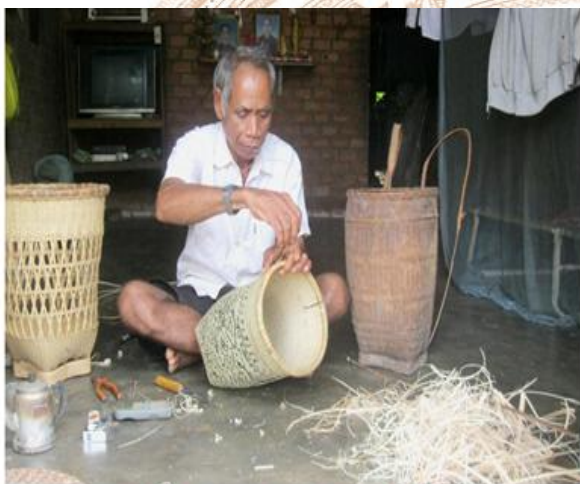
Nghề đan lát của dân tộc Mạ ở Đồng Nai

Hình thái kinh tế chiếm đoạt: hái lượm rau, củ, quả, săn bắn chim và thú trong rừng, đánh cá ở suối... trước đây giữ vị trí đáng kể trong đời sống hàng ngày thì nay chỉ là rất phụ vì rừng không còn bao nhiêu (dưới 25% diện tích tự nhiên).