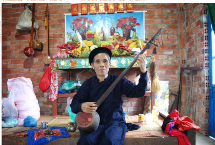
Bà Then của dân tộc Tày (xã Phú Tân, huyện Cẩm Mỹ)

Người Tày ở Đồng Nai có lịch sử di dân từ năm 1954 bắt đầu từ một bộ phận theo quân đội của Vòng A sang vào Sông Mao (Bắc Bình, Bình Thuận), sau đó vào Đồng Nai và một số nơi khác. Sau năm 1975, tiếp tục có nhiều đợt người Tày di dân đến Đồng Nai để làm ăn kinh tế.