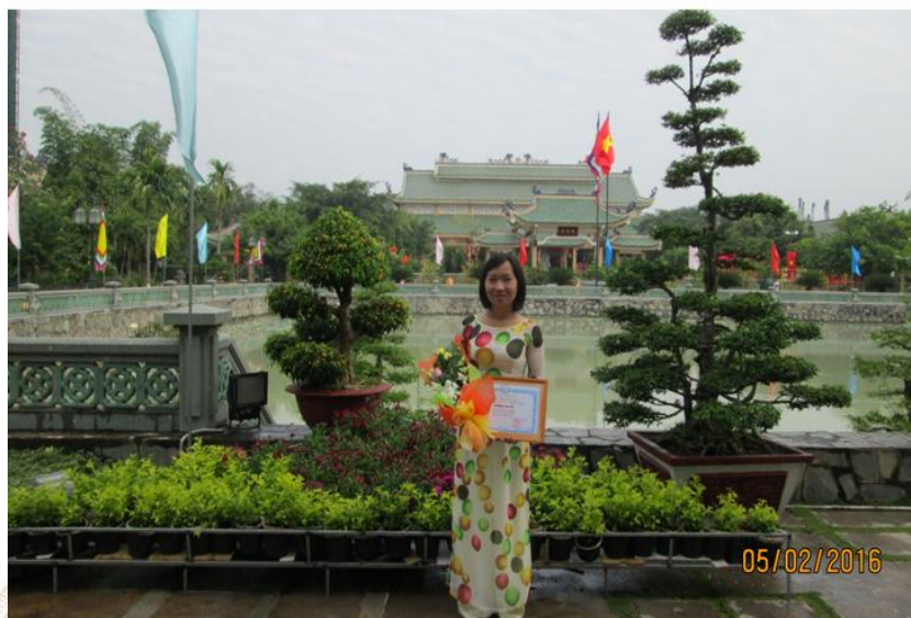
Ảnh: Tác giả bên Thiên Quang Tỉnh

Thiên Quang tỉnh (Giếng ánh sáng của mặt trời) hình vuông, xung quanh được xây bằng đá xanh Bửu Long, hàng rào bao quanh bằng đá Bửu Long, quanh năm nước đầy, mặt nước trong xanh phẳng lặng, được thả các loại cá và sen. Người xưa có quan niệm rằng Giếng hình vuông tượng trưng cho đất, cửa hình tròn trên gác Khuê Văn tượng trưng cho bầu trời trời. Tinh hoa của cả trời đất đều tập trung nơi trung tâm văn hóa, giáo dục uy nghiêm này.