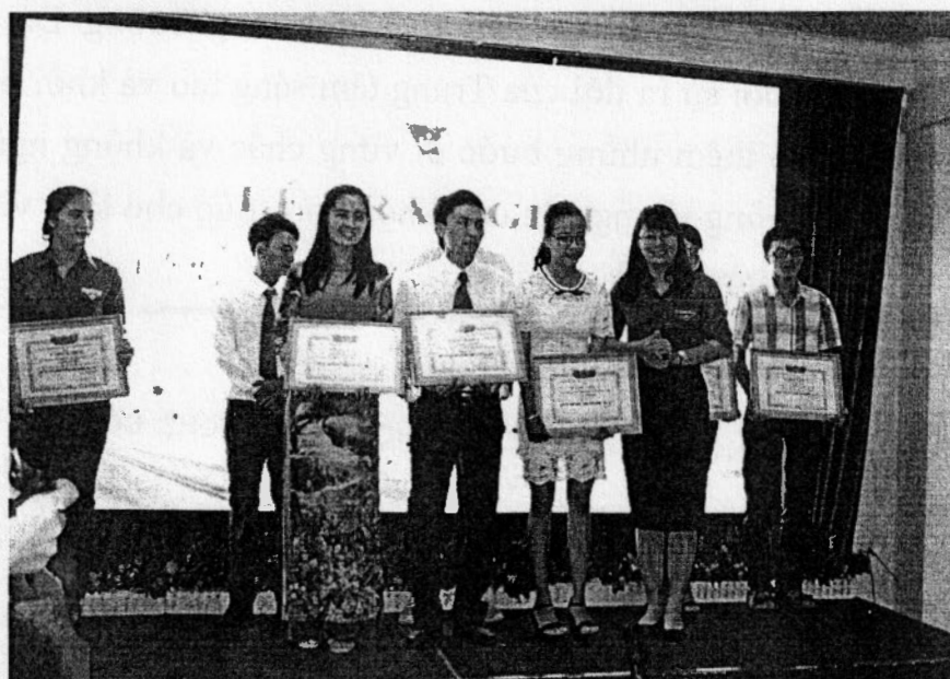
Tập thể giảng viên và sinh viên trường đại học công nghệ Đồng Nai nhận giải tại cuộc thi thấp sáng ý tưởng khởi nghiệp

Đại học. Các bạn sinh viên phải không ngừng tìm tòi, học hỏi những công nghệ mới, có tính sáng tạo để phát triển thành những dự án khởi nghiệp áp dụng vào cuộc sống thực tiễn”. Bên cạnh đó, Tiến sĩ Đặng Kim Triết khẳng định: ”Lãnh đạo Trường Đại học Công nghệ Đồng Nai sẽ luôn đồng hành và hỗ trợ cao nhất cho các Sinh viên có ý tưởng khởi nghiệp”.