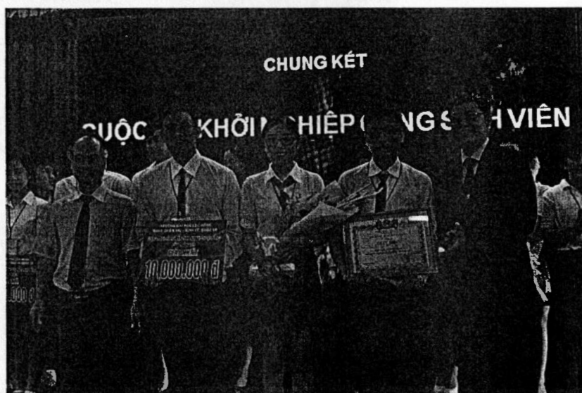
Chung kết cuộc thi khởi nghiệp của trường đại học Lạc Hồng năm 2018