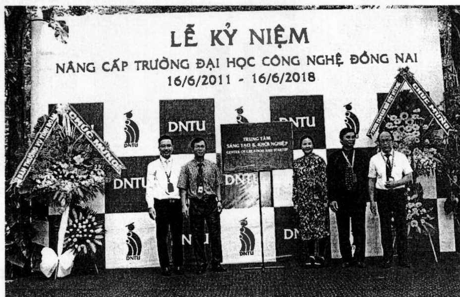
Lễ khai trương trung tâm sáng tạo và khởi nghiệp của trường đại học công nghệ Đồng Nai