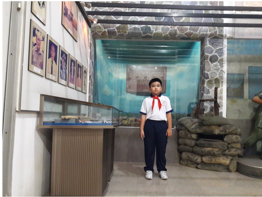
Tác giả tham quan mô hình trưng bày thể hiện trận nổi dậy phá nhà Lao Tân Hiệp diễn ra năm 1956