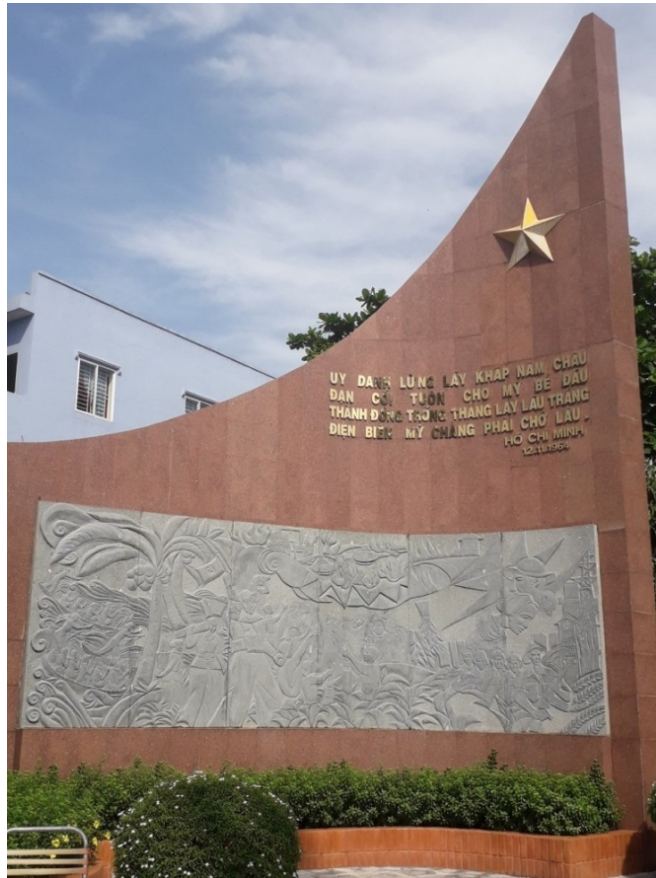
Cụm tượng đài chiến thắng Sân bay Biên Hòa