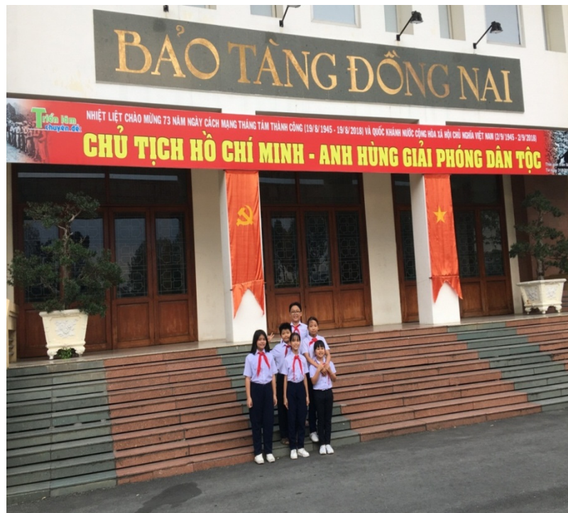
Các bạn cùng lớp 5/6 tại Bảo tàng Đồng Nai