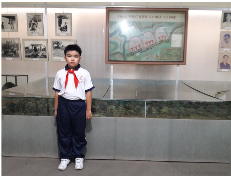
Tác giả tham quan mô hình thể hiện trận đánh giao thông La Ngà tại Bảo tàng tỉnh Đồng Nai