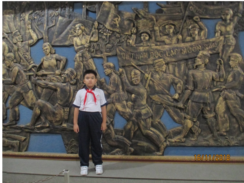
Tác giả tham quan Bảo tàng tỉnh Đồng Nai