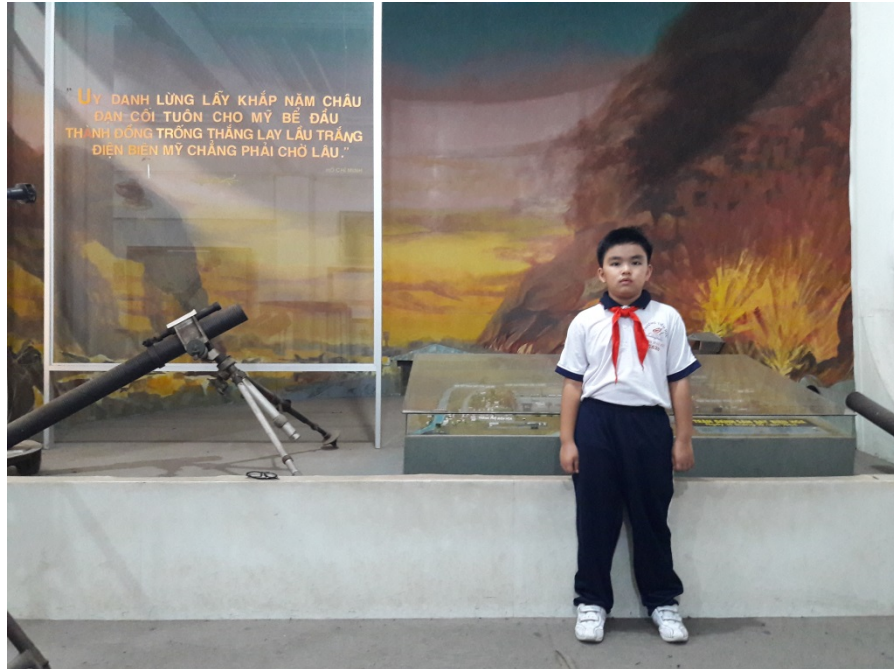
Tác giả tham quan mô hình trận đánh vào sân bay Biên Hòa diễn ra năm 1964