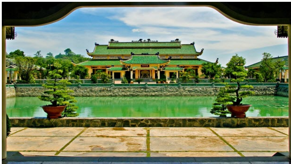
Văn miếu Trần Biên ở thành phố Biên Hòa