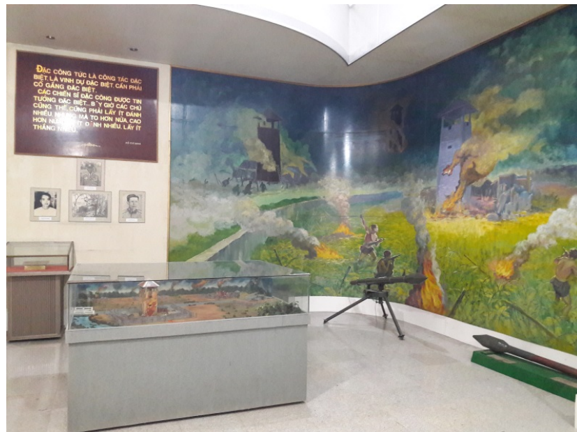
Trưng bày về trận đánh tháp canh Cầu Bà Kiên tại Bảo tàng Đồng Nai