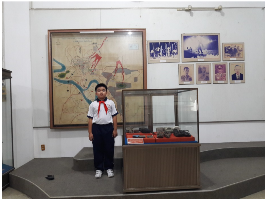
Tác giả tham quan mô hình, hiện vật, hình ảnh các vị lãnh đạo trận Tổng tiến công và nổi dậy Xuân Mậu Thân năm 1968