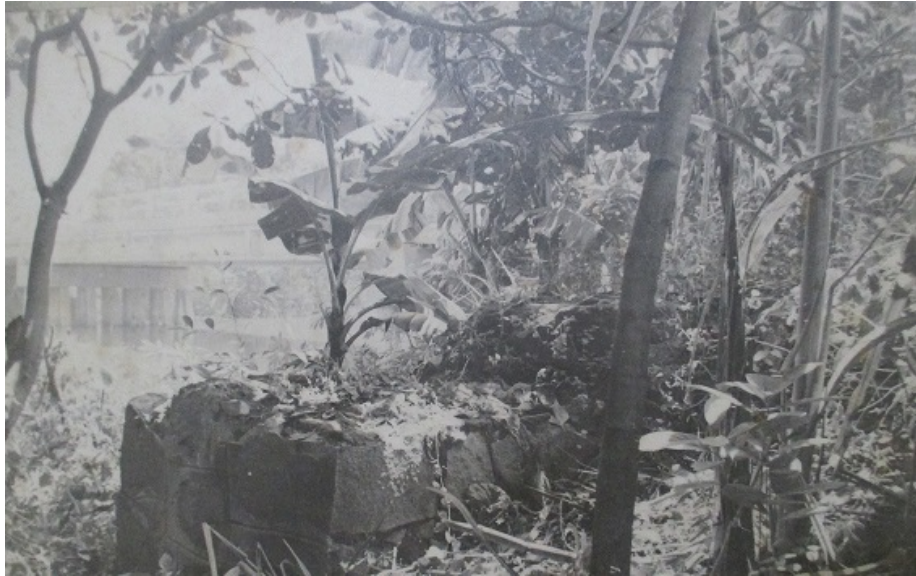
Tháp canh cầu Bà Kiên do Pháp xây dựng – nơi sản sinh ra cách đánh đặc công anh hùng