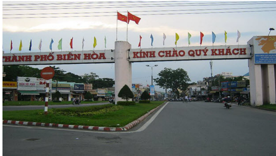
Một góc quang cảnh thành phố Biên Hòa