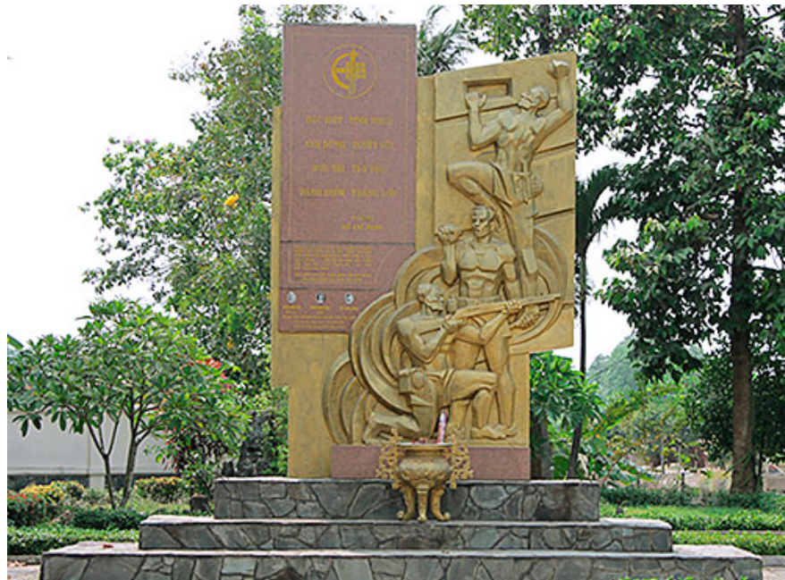
Tượng đài chiến thắng tháp canh cầu Bà Kiên năm 1948 (Ngày nay thuộc xã Thạnh Phước, thị xã Tân Uyên, tỉnh Bình Dương)