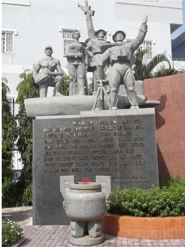
Tượng đài kỷ niệm chiến thắng Sân bay Biên Hòa năm 1964