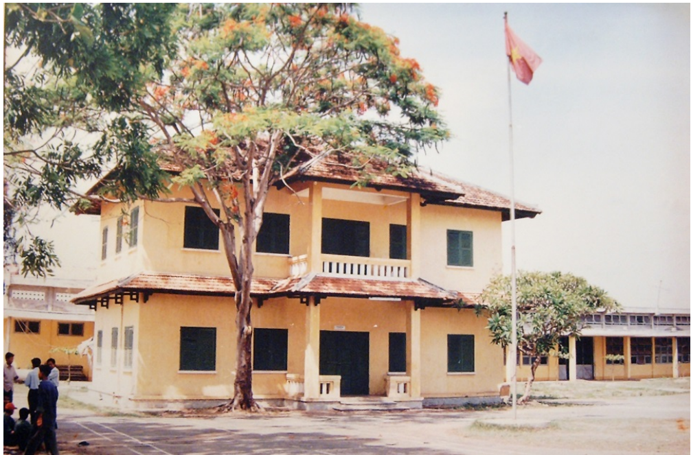
Di tích Nhà Xanh nơi diễn ra trận đánh Mỹ đầu tiên của quân dân Biên Hòa – Đồng Nai, năm 1959