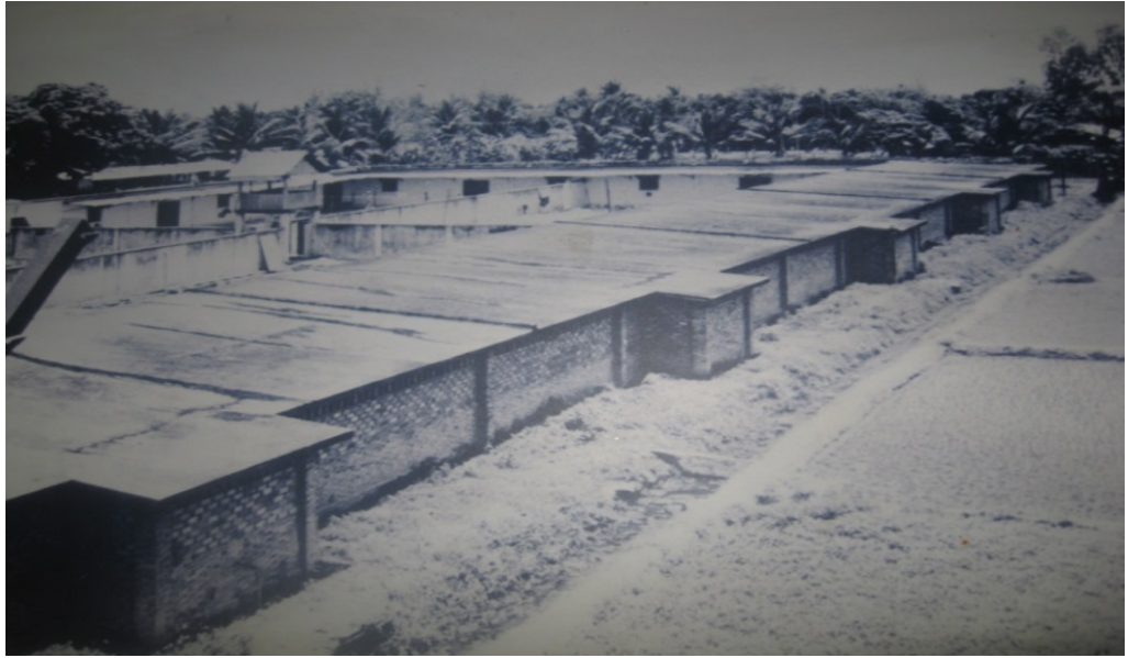
Nhà Lao Tân Hiệp (Trung tâm huấn chính Biên Hòa)