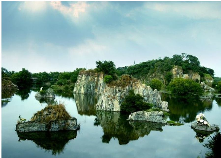
Danh thắng Bửu Long ở thành phố Biên Hòa