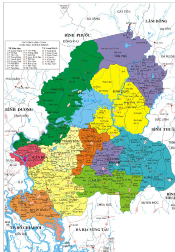
Bản đồ địa giới hành chính tỉnh Đồng Nai ngày nay