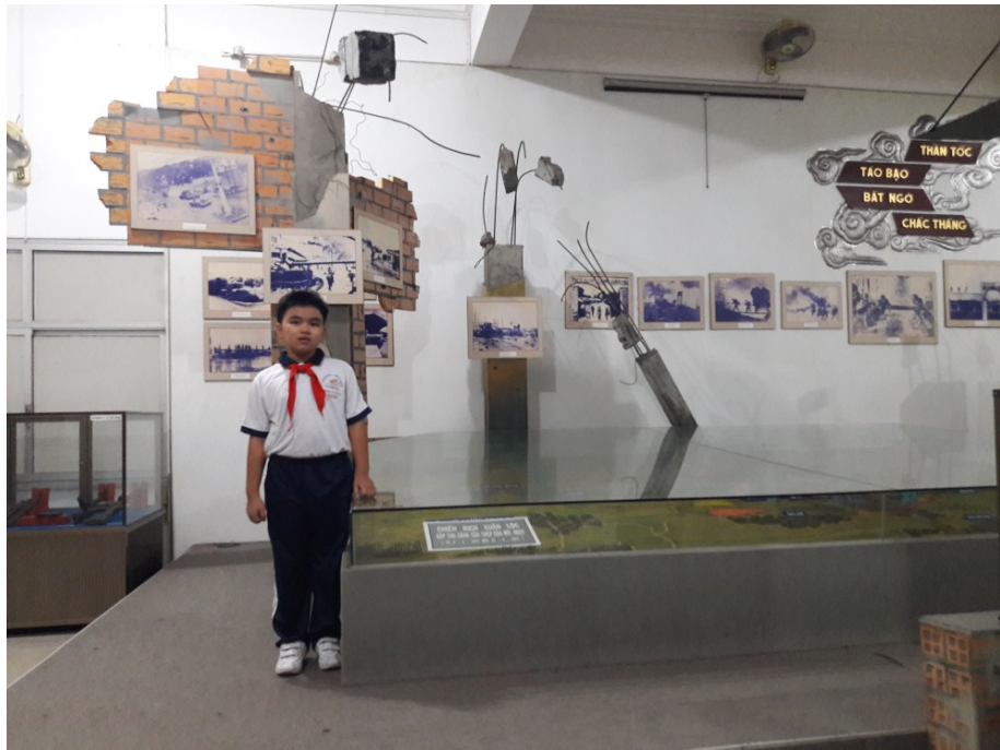
Tác giả tham quan mô hình chiến dịch Xuân Lộc diễn ra 12 ngày đêm (từ ngày 09/4/1975 – 21/4/1975)