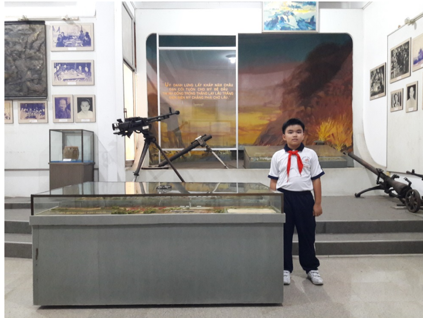
Tác giả tham quan mô hình trận đánh vào Tổng kho liên hợp hậu cần Long Bình diễn ra năm 1966