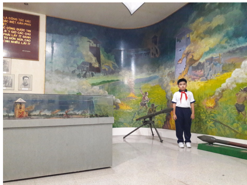
Tác giả tham quan Trận đánh tháp canh Cầu Bà Kiên diễn ra ngày