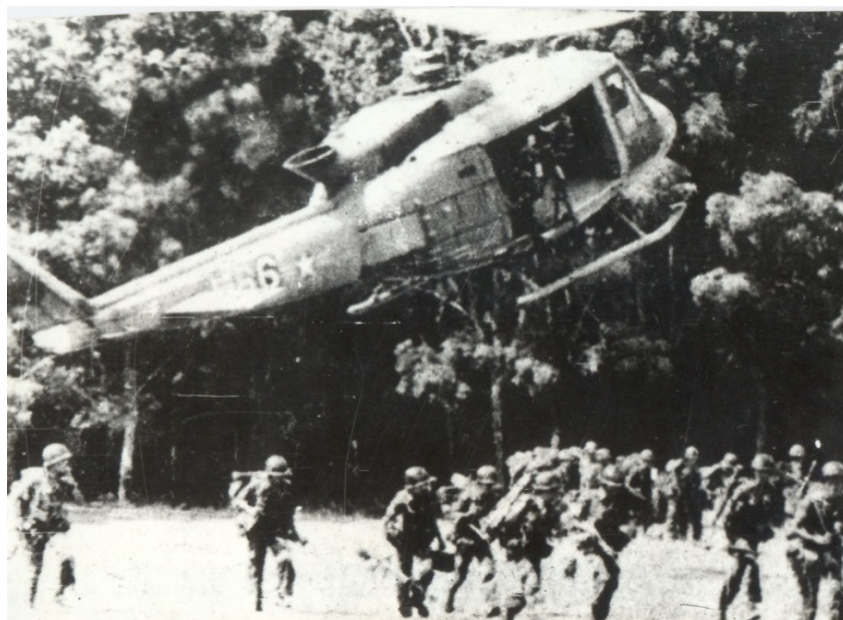
Quân đội Mỹ chi viện cho mặt trận Xuân Lộc, năm 1975