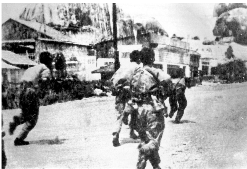
Quân giải phóng tiến đánh Chi khu Định Quán năm 1975

Ngay từ 17 giờ ngày 26 tháng 4 đạn pháo 130 ly của ta trum lên căn cứ Nước Trong (Long Thành ). Pháo vừa ngưng, bộ binh xe tăng ta từ nhiều hướng tiến công mãnh liệt. Sư đoàn 304 Quân đoàn 2 đánh chiếm căn cứ Nước Trong. Sư đoàn 325 Quân đoàn 2 tiến vào chi khu Long Thành. Lực lượng vũ trang địa phương tiểu đoàn 240 Biên Hòa phối hợp với quân chủ lực đánh phân khu Phước Thiện.