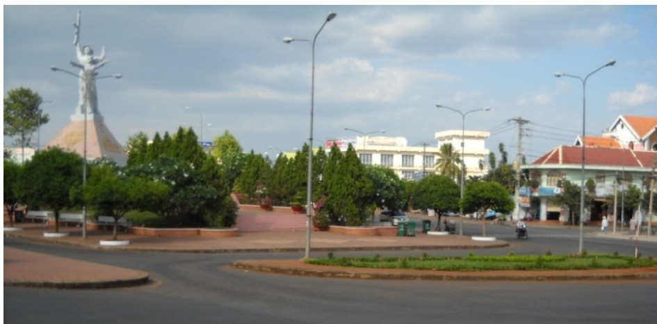
Trung tâm Thị xã Long Khánh, tỉnh Đồng Nai

92,8% dân số, kể đến người Hoa, Chơ-ro, Chăm, Nùng, Mạ, Cơ Ho, Xtiêng, Khơ-me và các dân tộc anh em khác.