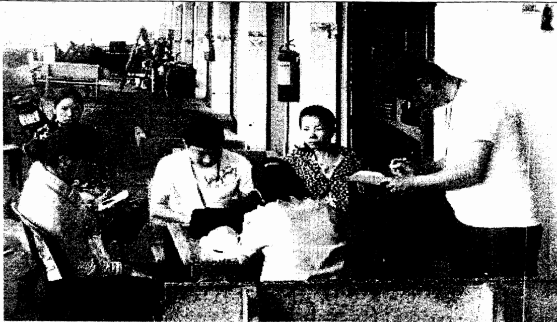
Lập biên bản một điểm bán xăng phát hiện có gian lận