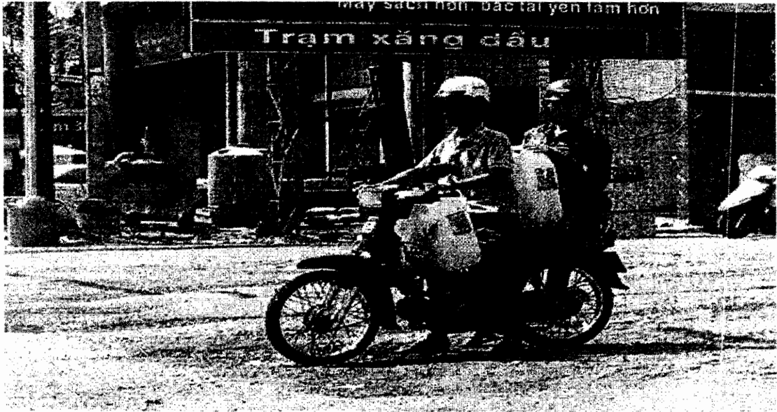
Bà Phương đóng vai người đi mua lẻ xăng để nghiên cứu hành vi gian lận tại một điểm bán xăng