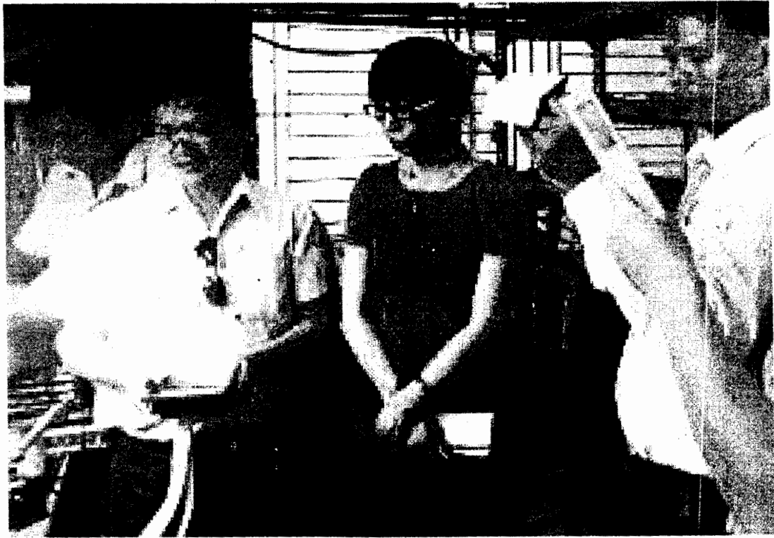
Cùng đồng đội kiểm tra bắt quả tang một điểm bán xăng có gian lận