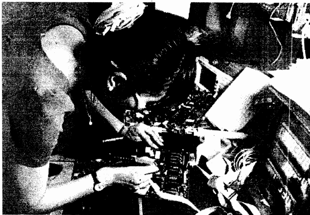
“Nữ tướng” tự mình tìm hiểu hoạt động kỹ thuật của các bo mạch để phục vụ công tác kiểm tra, xử lý