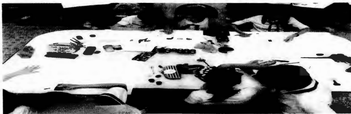
Học sinh thực hành vẽ nhóm sau tiết học

Là một giáo viên dạy mỹ thuật với 12 năm công tác trong nghề cô cho rằng dạy mỹ thuật nếu chỉ dừng lại ở nhận thức, khái niệm thì sẽ nửa vời và xa rời cuộc sống. Chính vì vậy, môn này đã được các giáo viên trong tỉnh tổ chức thành dạy học theo chủ đề nhằm tạo điều kiện để học sinh được thuyết minh về sản phẩm của mình, biết bảo vệ quan điểm bản thân, lắng nghe ý kiến của người khác