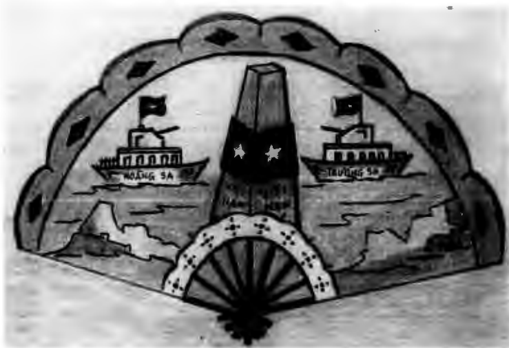
Hình ảnh “Lồng ghép biển đảo Hoàng Sa - Trường Sa là của Việt Nam qua vẽ trang trí đồ vật”