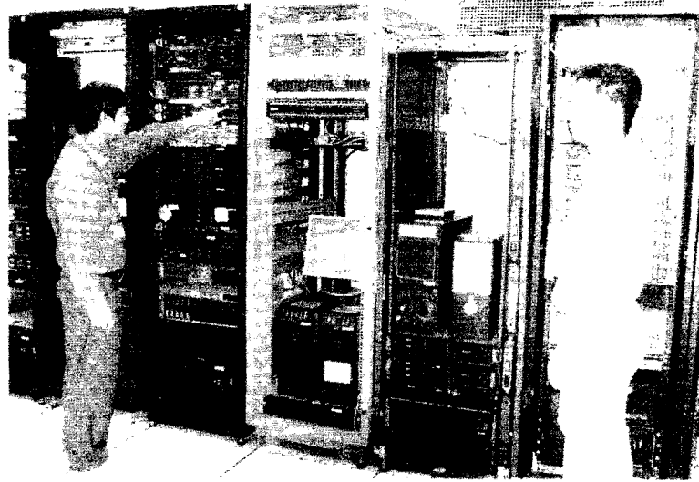
Phòng Datacenter lưu trữ thông tin bảo mật được nhiều đơn vị lựa chọn đặt thuê