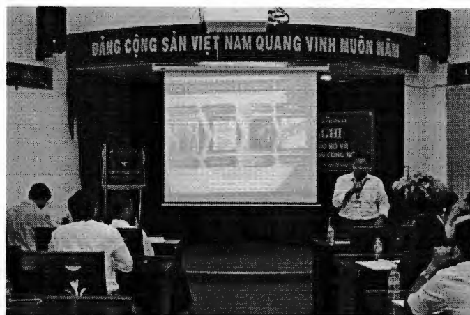
Hội nghị tập huấn “Bảo hộ và khai thác quyền Kiểu dáng công nghiệp” tổ chức ngày 26/5/2017

hành các tài liệu tuyên truyền như Bộ sách về Sở hữu trí tuệ gồm: “Tạo dựng một nhãn hiệu” ; “Tạo dáng sản phẩm” ; “Sáng tạo tương lai” nhằm giới thiệu chi tiết kiến thức về các đối tượng sở hữu công nghiệp dành cho các doanh nghiệp vừa và nhỏ.