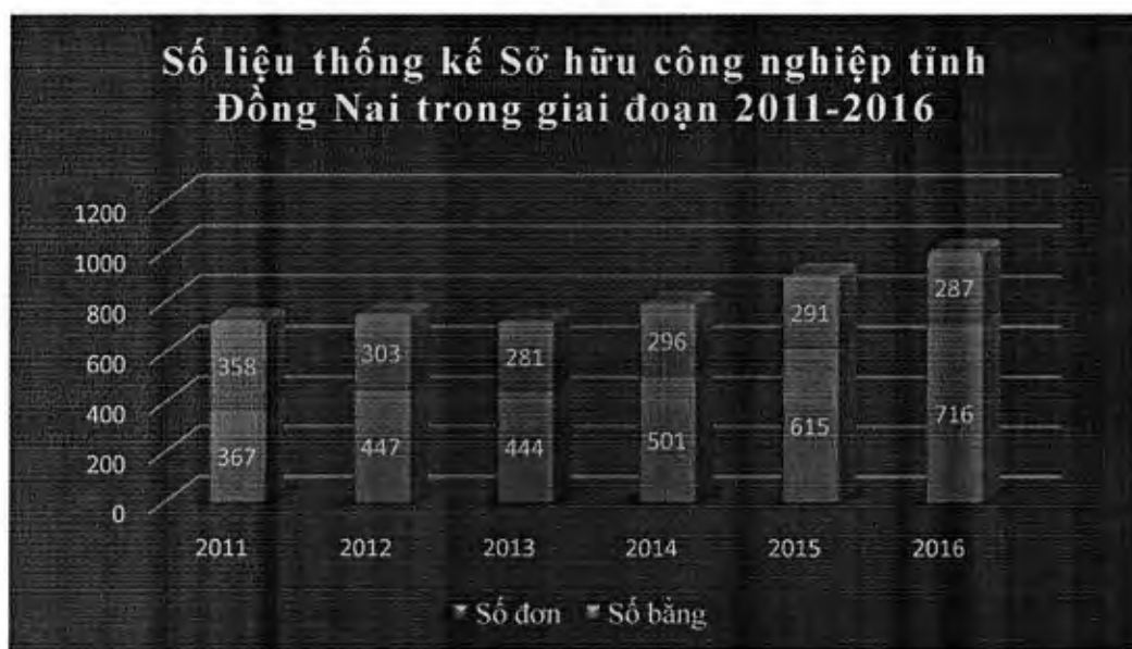
Biểu đồ thống kê số đơn và số văn bằng được cấp giai đoạn 2011-2016