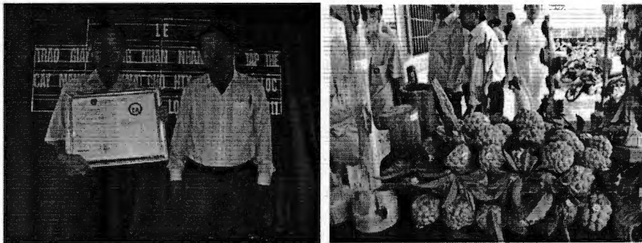
Trao giấy chứng nhận nhãn hiệu tập thể cho trái măng cầu na của Hợp tác xã dịch vụ - nông nghiệp Phú Lộc.

Bên cạnh đó, việc đăng ký bảo hộ đối tượng sở hữu công nghiệp ở một hoặc một số nước chính là nhằm giành được độc quyền sử dụng đối tượng sở hữu công nghiệp ở nước hoặc những nước đó. Vấn đề này có ý nghĩa thực tiễn to lớn, thể hiện rõ nhất là đối với nhãn hiệu và sáng chế.