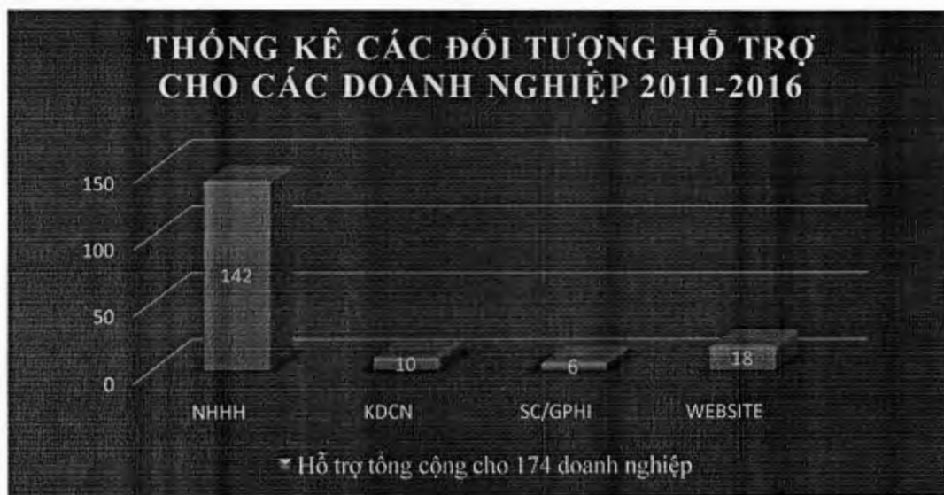
Biểu đồ thống kê chương trình KHCN hỗ trợ doanh nghiệp giai đoạn 2011-2016

Sản phẩm xuất khẩu mang nhãn hiệu trong nước có chất lượng cao trên cơ sở áp dụng công nghệ và sáng chế, nếu không đăng ký bảo hộ nhãn hiệu đó ở nước nhập khẩu thì khi đạt được uy tín với người tiêu dùng, sản phẩm này chắc chắn sẽ có người bắt chước cả về nhãn hiệu và công nghệ, sáng chế, thị trường tiêu thụ có thể giảm hoặc mất hoàn toàn; vì vậy, đăng ký nhãn hiệu, sáng chế ở nước ngoài để bảo vệ mặt hàng xuất khẩu trở thành vấn đề rất quan trọng và bức thiết đối với các doanh nghiệp tiến hành mở rộng thị trường kinh doanh thông qua xuất khẩu hàng hóa.