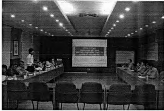
Hoạt động thanh tra về thực thi quyền sở hữu trí tuệ trong doanh nghiệp năm 2011