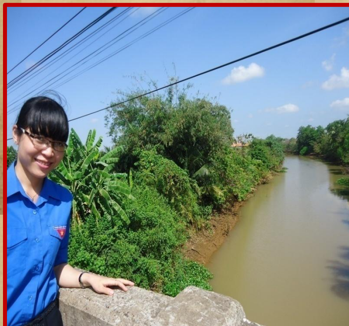
Rạch Cá (Rạch Bến Cá) Vĩnh Cửu – Đồng Nai

Theo tìm hiểu Nguyễn Hữu Cảnh từng làm Thống Suất đi đánh dẹp đã bày trận và đóng quân ở Rạch Cá (Rạch Bến Cá) nay thuộc Vĩnh Cửu – Đồng Nai.