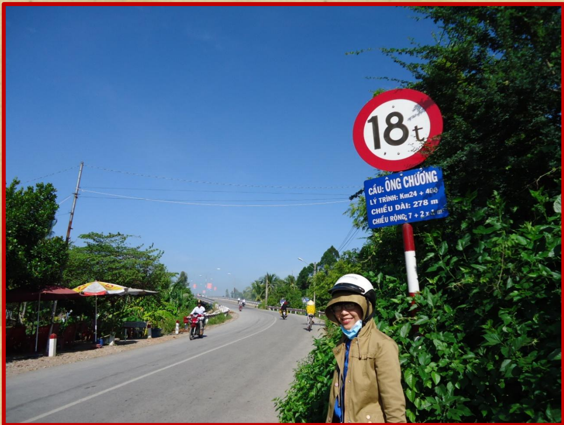
Cầu Ông Chường – Kiến An, Chợ Mới

* Những ngôi trường mang tên Lê Thành Hào Nguyễn Hữu Cảnh