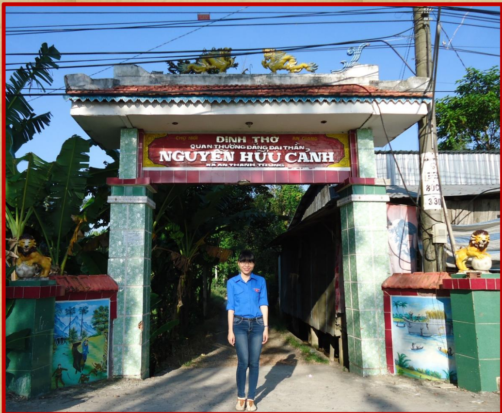
Cổng ngoài Dinh Thờ

* Dinh Thờ Nguyễn Hữu Cảnh – Cù lao Ông Chưởng, Chợ Mới