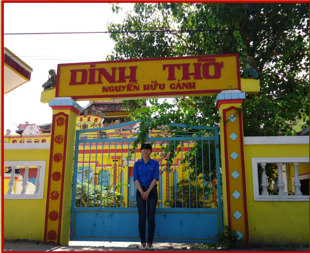
Cổng chính Đình Thờ Nguyễn Hữu Cảnh