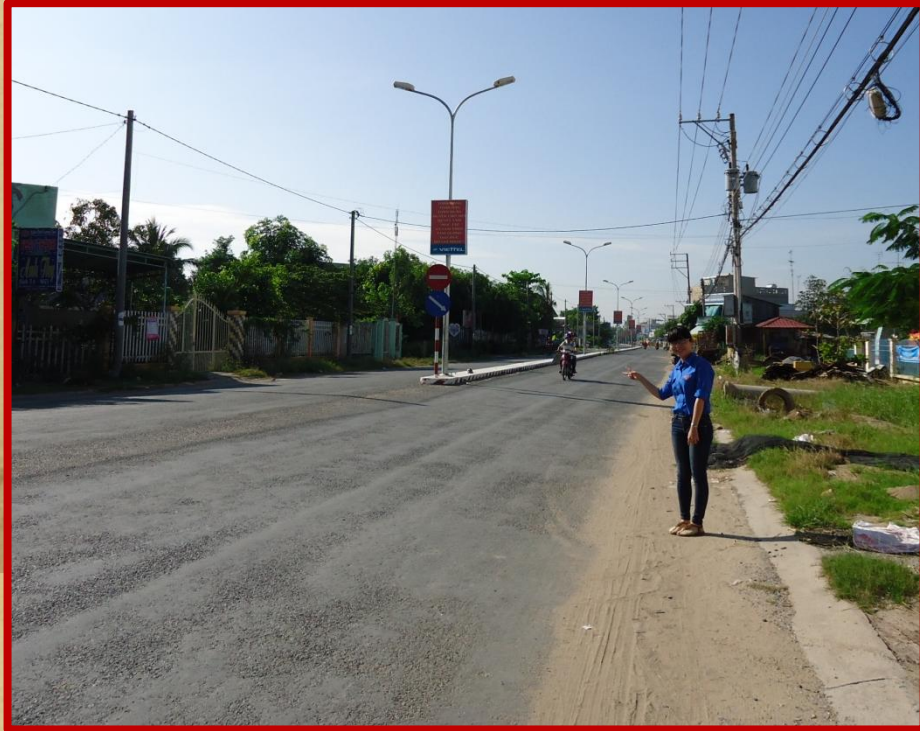
Đường Nguyễn Hữu Cảnh – Chợ Mới, An Giang