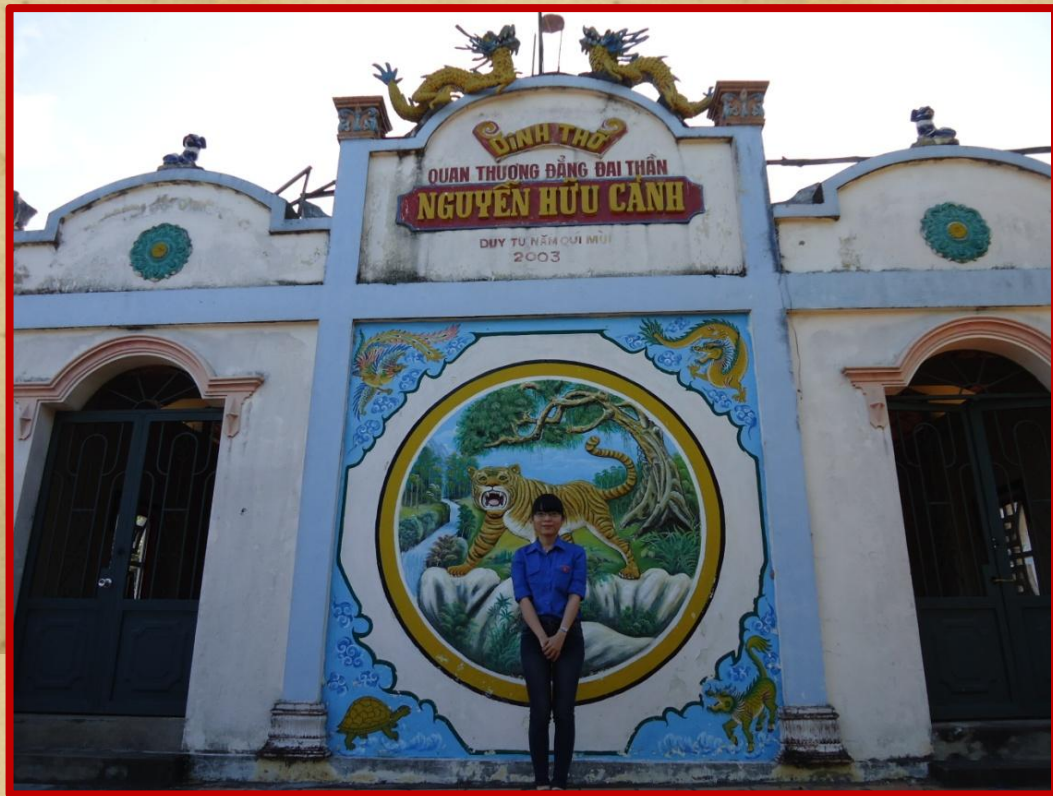
Phía trước mặt Dinh Thờ

*Rạch Ông Chưởng nằm dọc theo Cù Lao Ông Chưởng – Chợ Mới, An Giang