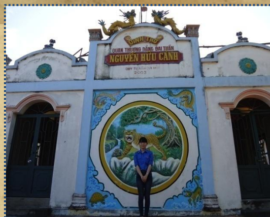
Tác giả đến thăm Dinh thờ Nguyễn Hữu Cảnh ở Cù lao Ông Lễ

Ngày 14 ông kéo binh về, ngày 16 (tức ngày 9 tháng 5 năm Canh Thìn) đến Sầm Giang (Rạch Gầm, Mỹ Tho) thì mất. Khi ấy chở quan tài về tạm trú ở dinh Trấn Biên (Biên Hòa), rồi đem việc tâu lên Chúa Nguyễn Phúc Chu, Ông rất thương tiếc, sắc tặng Nguyễn Hữu Cảnh là Hiệp tán Công thần, hưởng 51 tuổi. Người Cao Miên lập miếu thờ ông ở đầu châu Nam Vang. Nơi cù lao ông nghỉ bệnh, nhân dân