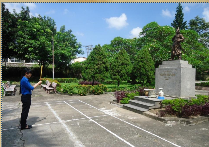
Tác giả cung kính thấp nhan tường nhớ công ơn của Thượng Đẳng Thần Nguyễn Hữu Cảnh

vuông, tường gạch, nền lát gạch tàu, mái lợp ngói. Hàng cột hành lang mặt trước đắp trang trí hình ảnh những con rồng cuộn, đôi châu với nhau. Nội điện có ba hàng cột gỗ lớn treo những liễn đối và các hoành phi, bao lam gỗ được chạm trổ tinh tế các đề tài dân gian. Các hoành phi thể hiện dưới dạng đại tự chữ Hán, liễn đối được trang trí hoa văn sơn son thếp vàng, các bàn hương án, nghệ thuật chạm khắc với đề tài dân gian sinh động. Đặc biệt, tại đền còn lưu giữ bộ áo mũ, tương truyền của Đức ông thuở sinh thời đến nay đã có tuổi đời hơn 300 năm.