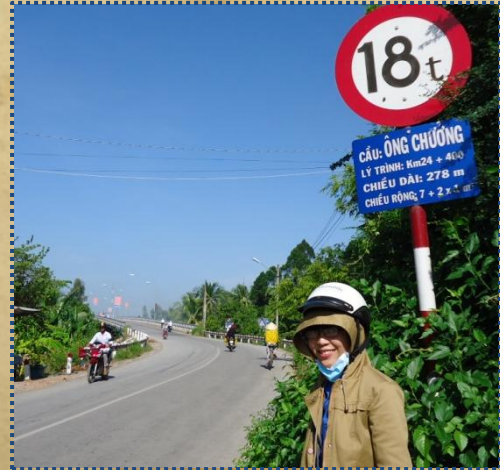
Tác giả có cơ hội đi qua cây cầu mang tên Ông

Dường như nơi đây tất cả đều mang dấu tích về ông, để tất cả ai khi thực hiện chuyến hành trình tìm hiểu lịch sử như tôi đây đều có thể cảm nhận được một quá khứ hào hùng đáng tự hào, đáng tìm hiểu và trân trọng.