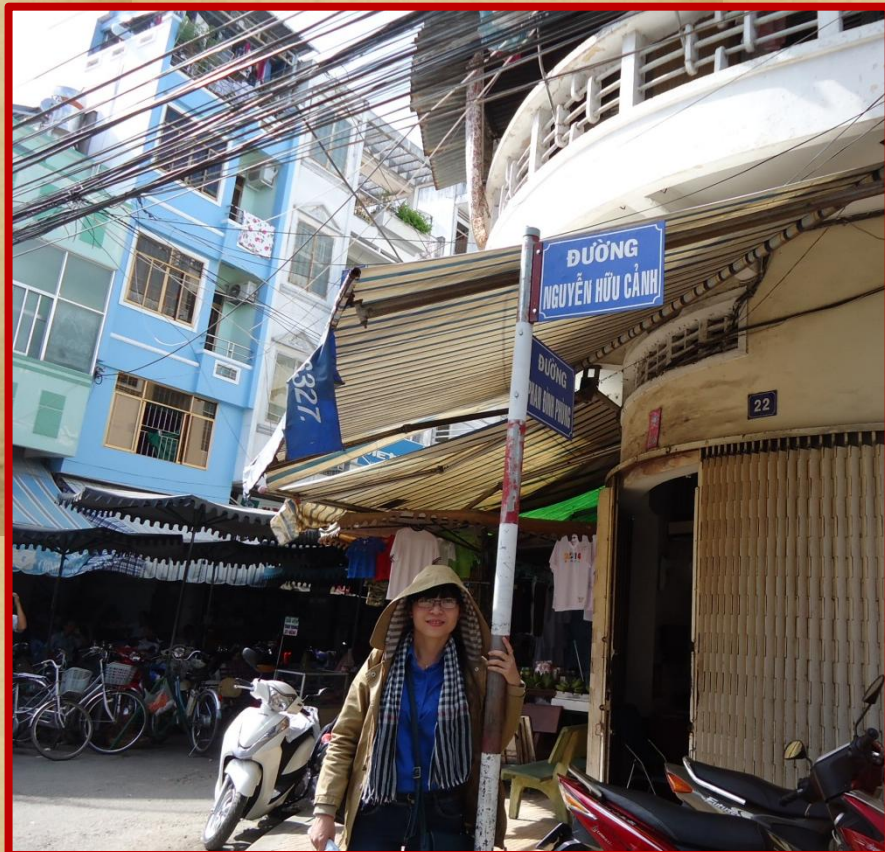
Đường Nguyễn Hữu Cảnh – Châu Đốc, An Giang