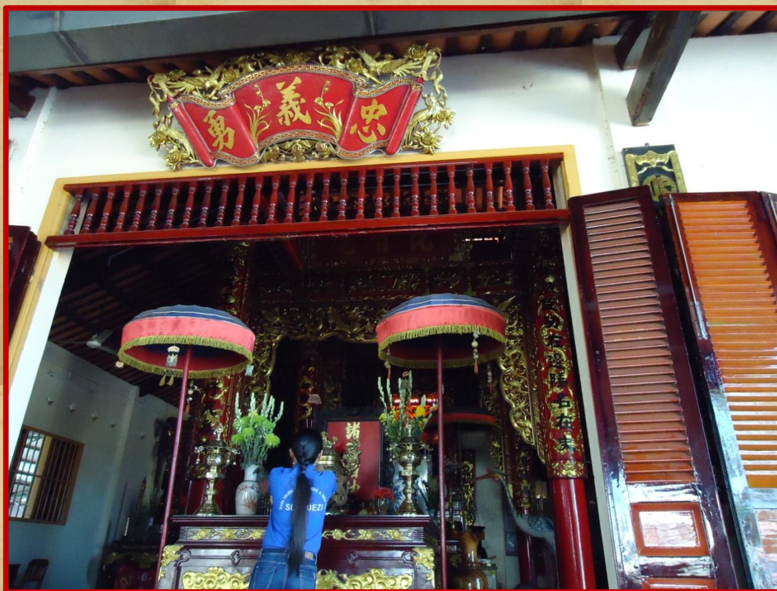
Bên trong Dinh Thờ