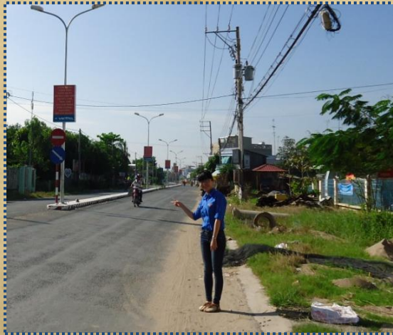
Đường Nguyễn Hữu Cảnh thị trấn Chợ Mới (trước Trường THPT Nguyễn Hữu Cảnh)

Ngoài ra, tại An Giang còn có những con đường, cây cầu mang tên Ông: