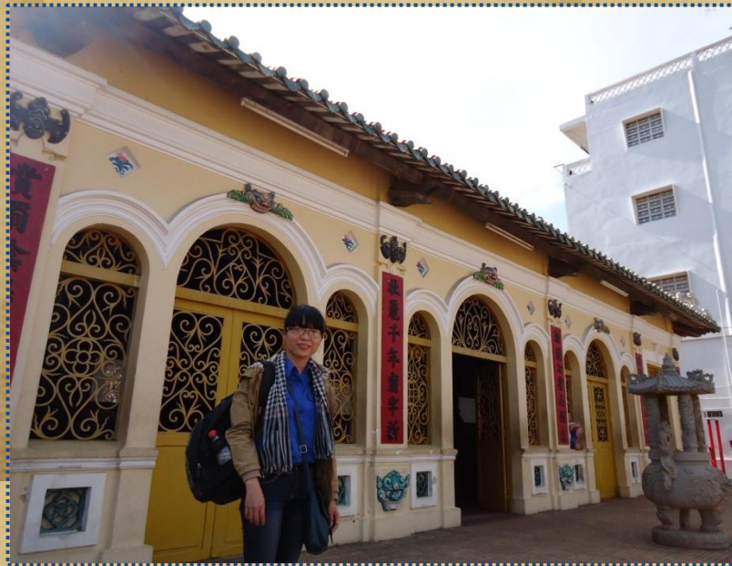
Hình ảnh hành lang phía trước Đình Châu Phú

tiên, chim muông, mai lan, cúc trúc...Tất cả các hàng cột đều có hoành phi và câu đối được sơn thiếp vàng lộng lẫy.