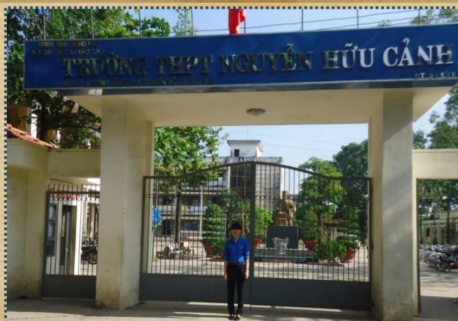
Tác giả bài viết trở về thăm lại trường xưa