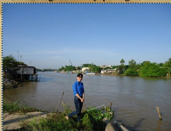
Rạch Ông Chưởng nằm dọc theo Cù lao Ông Chưởng – Chợ Mới, An Giang

Trong Gia Định thành thông chí có chép: “Đêm 26 tháng 4 Canh Thìn (1700), gió mưa tầm tã, nơi đầu cù lao đất