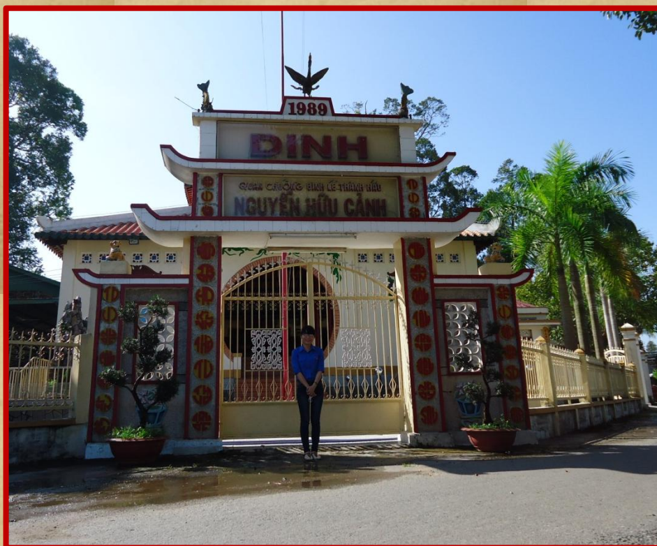
Phía trước cổng Dinh