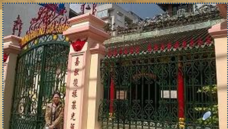
Tác giả đến thăm và tìm hiểu đền Minh Hương Gia Thạnh, Quận 5, TP.HCM

Năm 1698, một số con cháu người Hoa đã ngụ cư từ lâu ở đình Phiên Trấn xin thành lập làng Minh Hương. Tuy nhiên, theo Hương ước của làng, thì năm 1789, mới là năm chính thức lập "Minh Hương xã". Và liền sau đó, một ngôi đình do