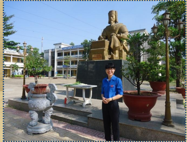
Tác giả bài viết trở về thăm lại trường xưa

Trường Trung học Phổ thông Nguyễn Hữu Cảnh là ngôi trường cấp ba tôi từng theo học, tôi tự thấy mình thật vinh dự khi đã được học ngôi trường mang tên Ông. Tôi từng là thành viên của đội tuyển học sinh giỏi Sử của Trường lúc ấy, và cũng từng có những niềm vui thích, mong muốn được tìm hiểu lịch sử về Ông, người mà tên của Ông đang được đặt nơi ngôi trường mình đang học, nhưng dường như khoảng thời gian học cấp ba không cho phép tôi đi xa quá với những kiến thức tôi cần tập trung cho chương trình thi đại học. Tôi chăm chỉ học tập, với khát vọng phải đỗ bằng được đại học, phải đạt thành tích thật cao, phải định hướng trước cho con đường sự nghiệp sau này. Và cứ như thế, niềm vui thích được tìm hiểu lịch sử về Ông của cô bé học trò ngày ấy dần đi vào quên lãng.