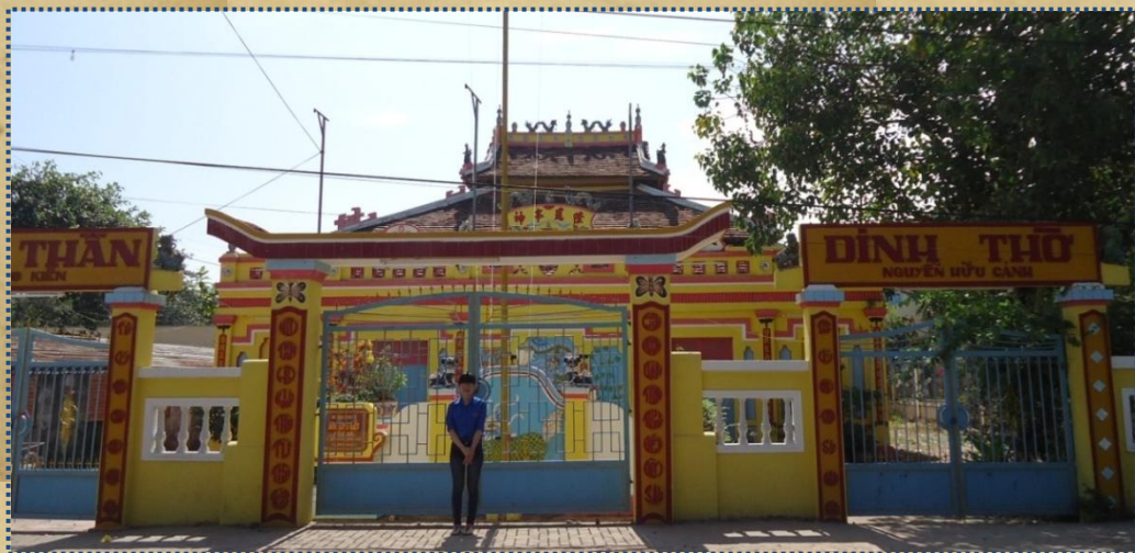
Đình Long Kiến nơi đặt Dinh thờ Nguyễn Hữu Cảnh ở Thị Trấn Chợ Mới

Tại đình Long Kiến (đình thờ và đình cũ lúc trước đều dựng ở hai bên đầu Sông ông Chưởng, do bị đất lở sụp nhân dân dời đình và dinh vào trong và nhập lại làm một) - đây là di tích do nhân dân dựng lên thờ ông sớm nhất ở An Giang. Về đền thờ tại đình Long Kiến, Đại Nam nhất thống chí có ghi: "Lại ở bãi Cây Sao giữa sông Hậu Giang, là chỗ trước kia Lễ Thành Hầu thắng trận, trở về đóng ở đây. Sau khi chết, dân bãi lập đền thờ".