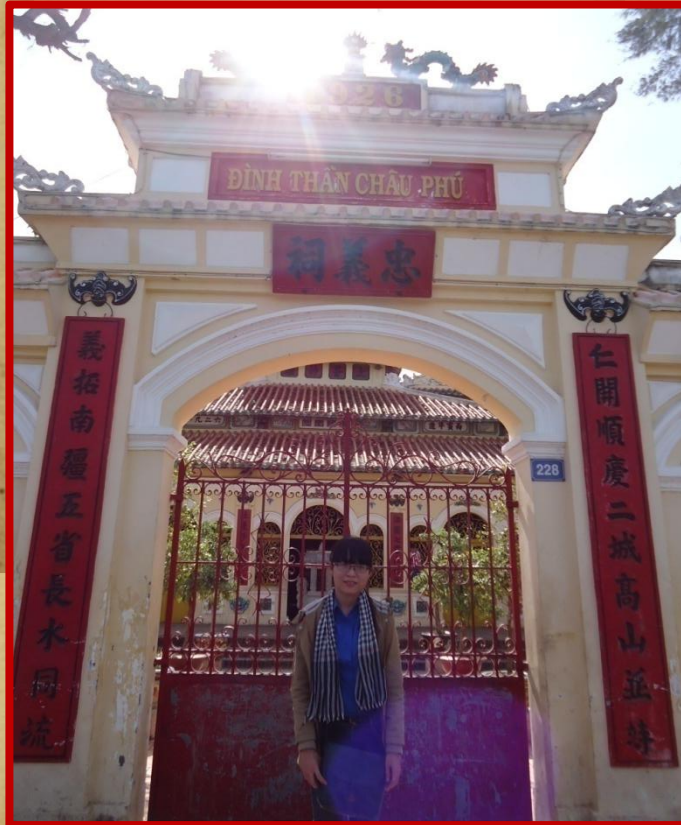
Cổng Đình Thần