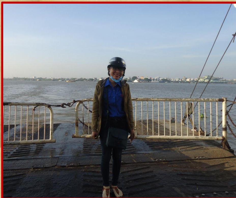
Phà qua Sông Hậu