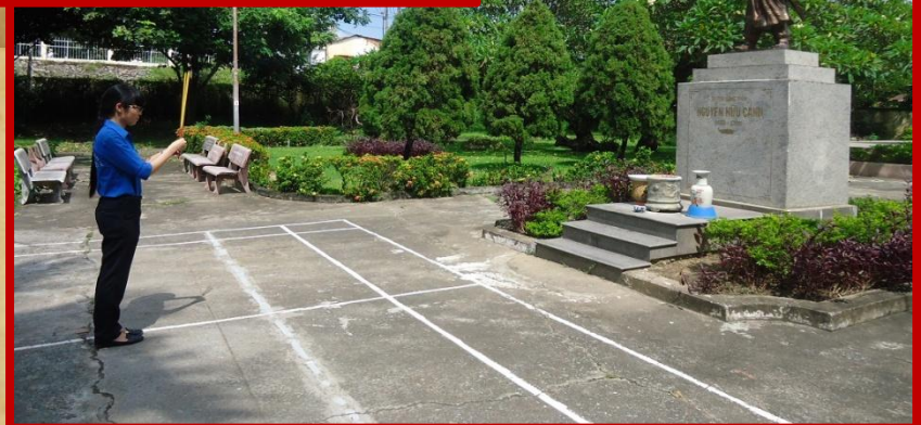
Khuôn viên bên trong Đền Thờ Lễ Thành Hầu Nguyễn Hữu Cảnh tại Cù lao Phố