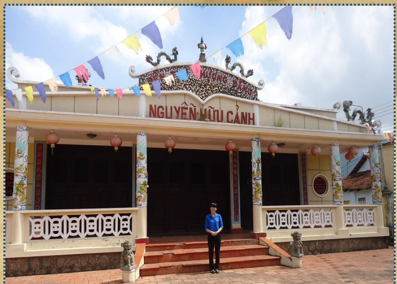
Tác giả thăm và tìm hiểu về Đền thờ Thượng Đẳng Thần Nguyễn Hữu Cảnh

Mặt đền nhìn ra sông Đồng Nai theo hướng Tây Nam, dưới chân cầu Ghềnh, sân đền rộng, chánh điện hình