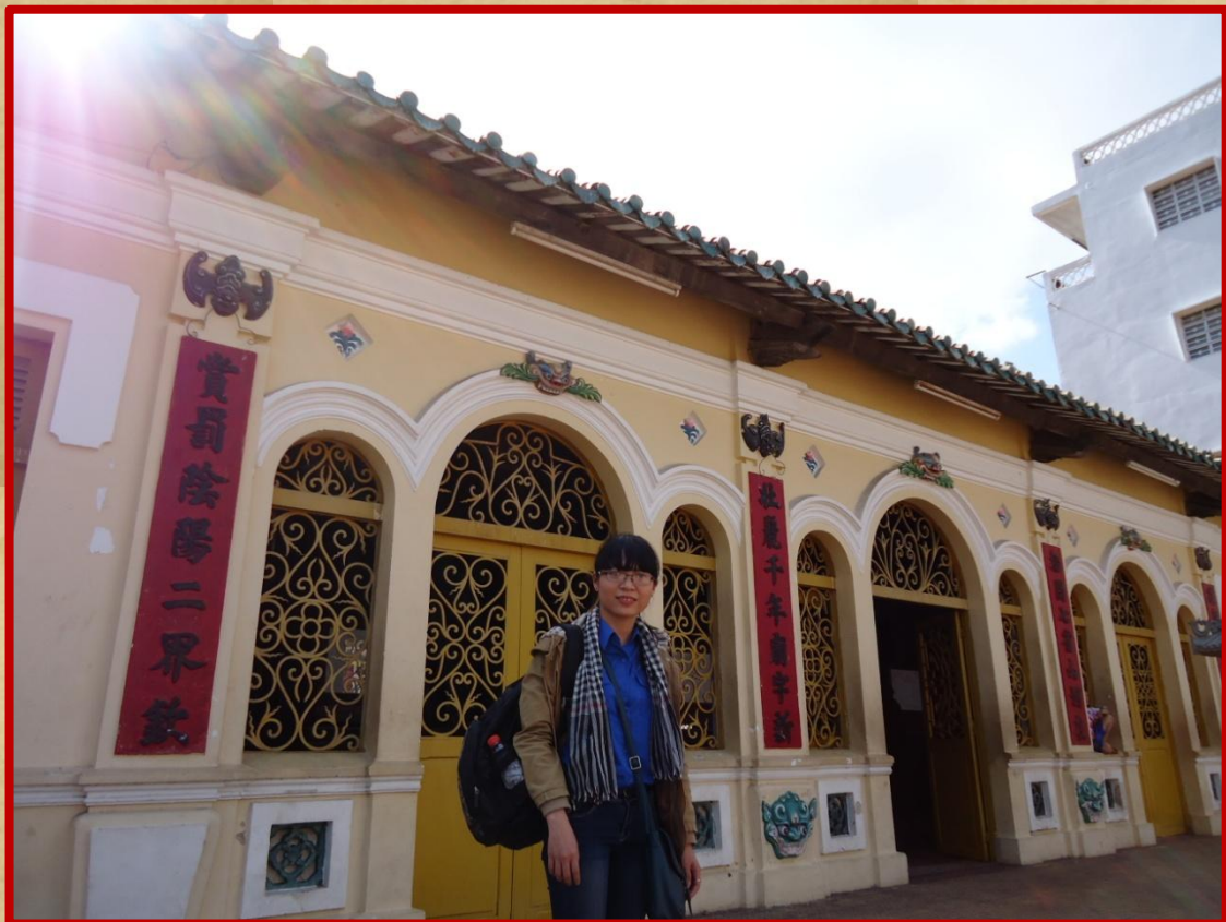
Mặt trước hành lang Đình Thần