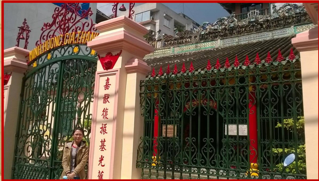
Cổng chính đình Minh Hương Gia Thạnh