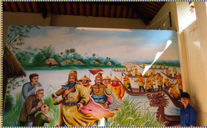
Hình ảnh phác họa ở bên trong Dinh thờ Kiến An

Ngoài ra, bên trong Dinh còn thể hiện lại những hình ảnh về một thời hào hùng của Ông.