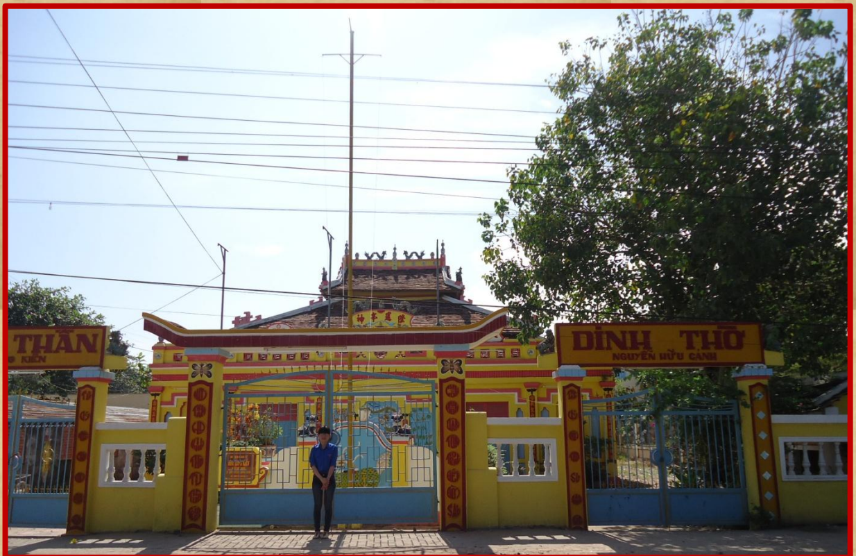
Cổng lớn – Bên trái mang tên Đình Thần Long Kiến, bên phải mang tên Đình Thờ Nguyễn Hữu Cảnh