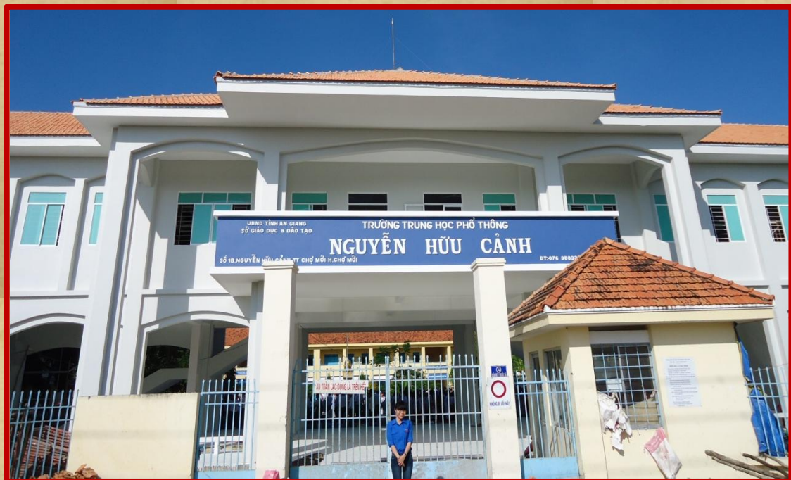
Trường THPT Nguyễn Hữu Cảnh – Chợ Mới, An Giang

* Những ngôi trường mang tên Lê Thành Hào Nguyễn Hữu Cảnh