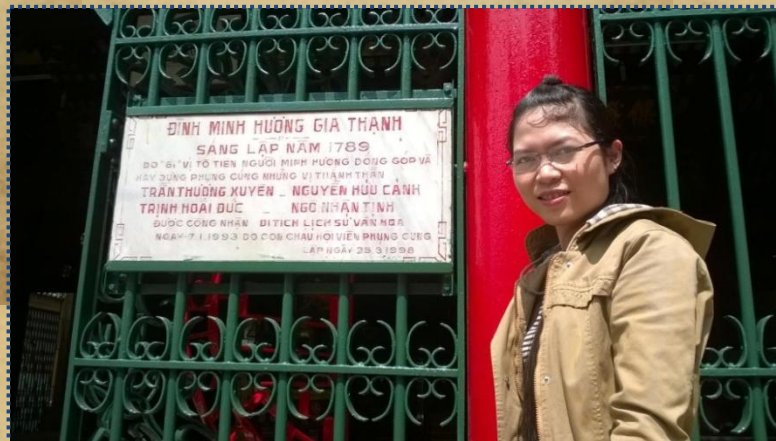
Cổng bên trong đình Minh Hương Gia Thạnh

Ở đây có phối tự các nhân vật tiêu biểu của đất Gia Định xưa gồm: Nguyễn Hữu Cảnh, Trần Thượng Xuyên, Trịnh Hoài Đức, Ngô Nhân Tịnh.