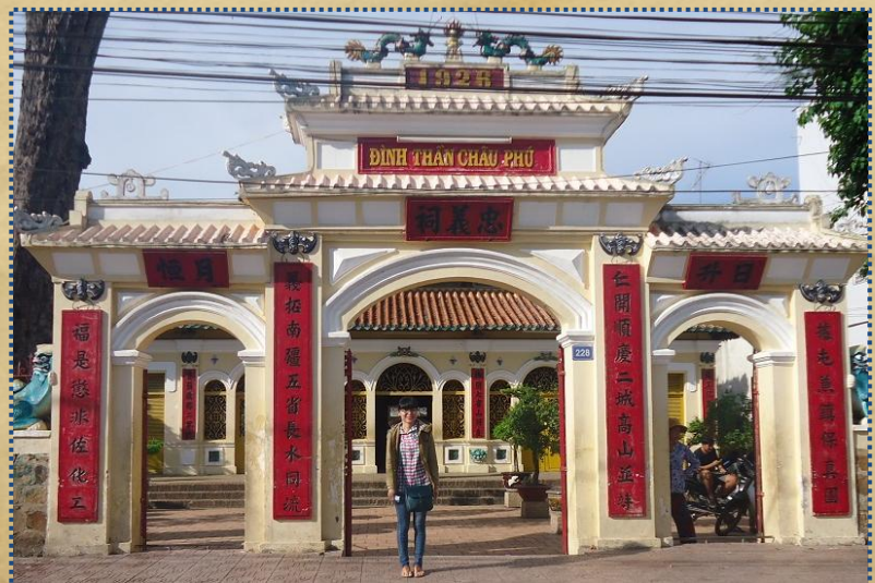
Tác giả bài viết đến thăm và tìm hiểu về Đình Thần Châu Phú-nơi thờ Lễ Thành Hầu Nguyễn Hữu Cảnh