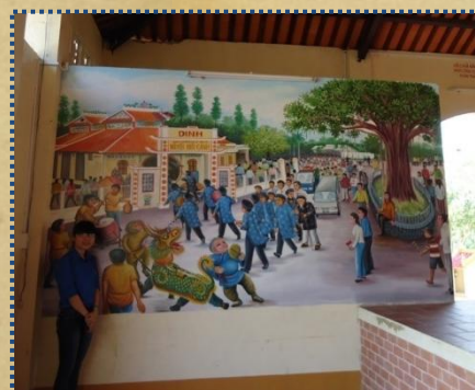
Hình ảnh phác họa lại lễ hội trước Dinh Ông ở bên trong Dinh thờ Kiến An

Tại Kiến An, thị trấn Chợ Mới, Dinh Quan Chưởng binh Lễ Thành hầu Nguyễn Hữu Cảnh tọa lạc trên diện tích khoảng 2.000m 2 với lối kiến trúc đặc trưng Nam bộ cùng một số công trình đậm nét văn hóa dân tộc. Trước cổng dinh là một cây đa um tùm tàn lá, gốc rất lớn,