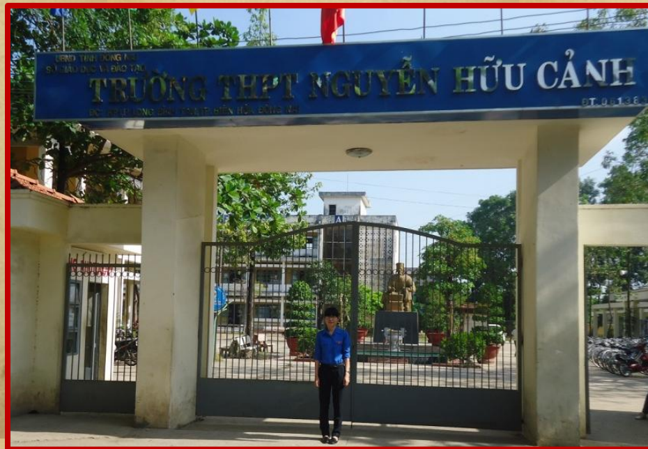
Trường THPT Nguyễn Hữu Cảnh – Biên Hòa, Đồng Nai