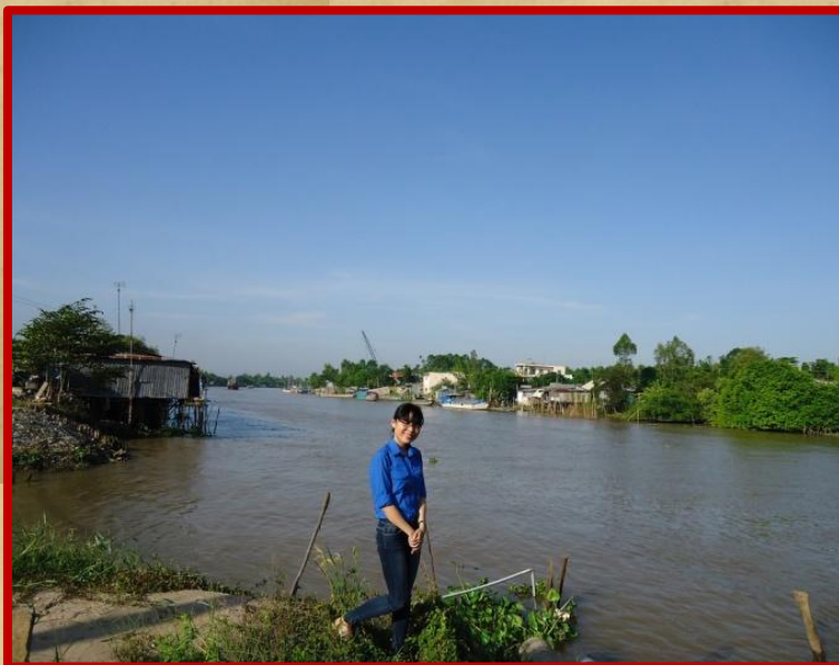
Một đoạn Rạch Ông Chưởng

*Rạch Ông Chưởng nằm dọc theo Cù Lao Ông Chưởng – Chợ Mới, An Giang