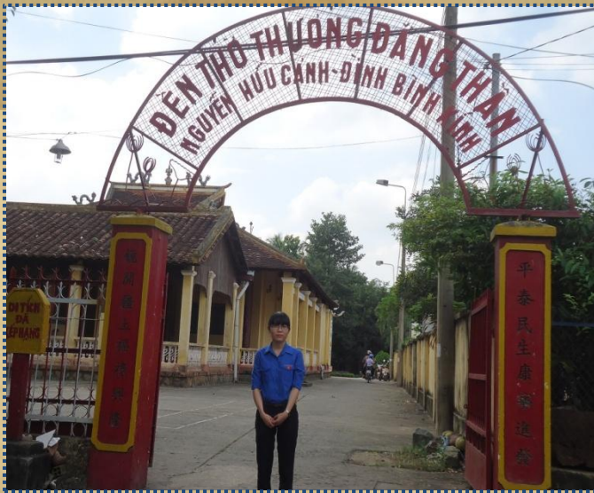
Tác giả đến thăm Đình Bình Kính

Đền thờ Nguyễn Hữu Cảnh còn gọi là Đình Bình Kính tọa lạc bên tả ngạn sông Đồng Nai, xưa kia thuộc ấp Bình Kính, thôn Bình Hoàn, tổng Trấn Biên, nay là ấp Nhị Hòa, xã Hiệp Hòa, thành phố Biên Hòa, được xếp hạng là di tích lịch sử cấp quốc gia năm 1991.