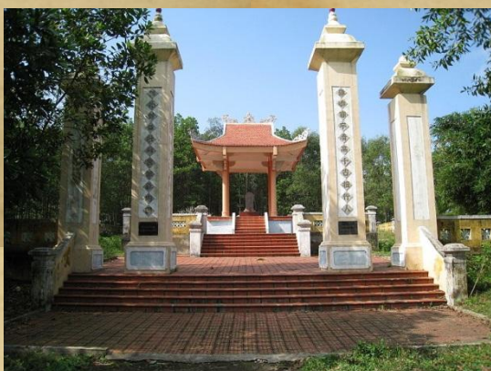
Lăng Nguyễn Hữu Cảnh ở Quảng Bình

cũng lập đền thờ, được mạng danh là Cù lao ông Lễ. Còn chỗ đình quan tài ở dinh Trấn Biên cũng lập miếu thờ.