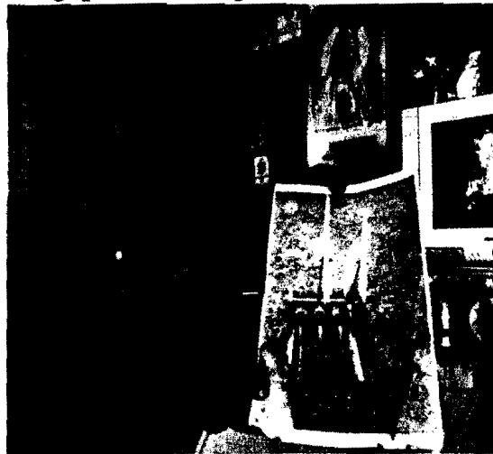
Ông Thành giới thiệu với khách hàng về chiếc xe tía hạt thế hệ thứ 1 bằng gỗ ngộ nghĩnh

Nhìn khu đất trũng rộng trên 1ha tại ấp Thanh Thọ 1 quanh năm ngập nước, ông Thành bàn với bà