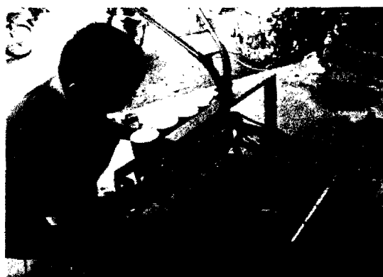
Công việc thường ngày của nhà sáng chế nông dân Lê Công Thành

nghĩa quá dờ: “Tại sao mình không tạo ra một