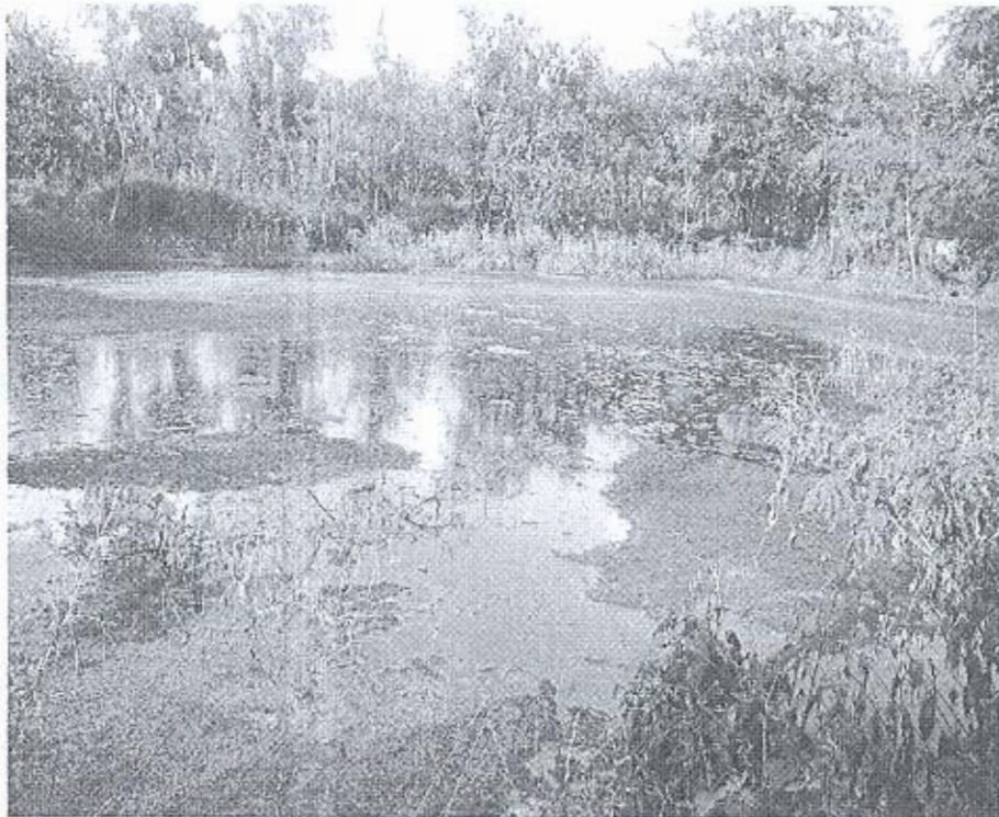
Ao cá rộng gần 2000m 2 của gia đình chị Thu

Đến nay chị đã phát triển đàn heo được 200 con với heo lú và heo nhỏ. Chị khó thu dọn nguồn phân khô, chị đem ủ để làm phân bón cho cây trồng, dư thì đem bán kiếm thêm thu nhập. Khâu tưới xịch vệ sinh chuồng sẽ theo hệ thống xuống hầm biogas xử lý chất thải. Như vậy vừa đảm bảo vệ sinh môi trường, vừa tận dụng được nguồn nhiên liệu sử dụng trong sinh hoạt, và là nguồn thức ăn cung cấp cho ao cá. Nhờ vậy gia đình chị đã tiết kiệm được một khoảng tiền lớn. Ngoài ra, nguồn lá từ các loại cây trong vườn cũng là nguồn thức ăn phong phú cho ao cá bên cạnh thức ăn công nghiệp.