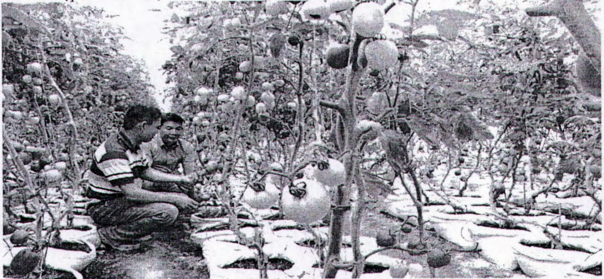
(Mô hình sản xuất rau, củ, quả sạch trong nhà màng tại trang trại Việt, ngụ ấp Tân Hữu, xã Xuân Thành, huyện Xuân Lộc)