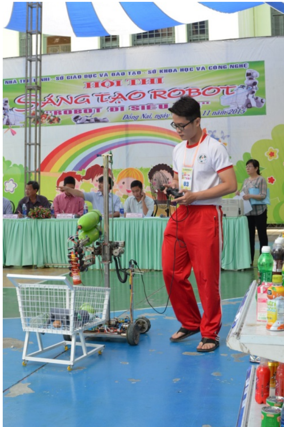
Ảnh: Học sinh trường Song ngữ Lạc Hồng tham gia hội thi Sáng tạo Robot năm 2015 do Nhà Thiếu nhi, Sở Giáo dục và Đào tạo, Sở Khoa học và Công nghệ phối hợp tổ chức.