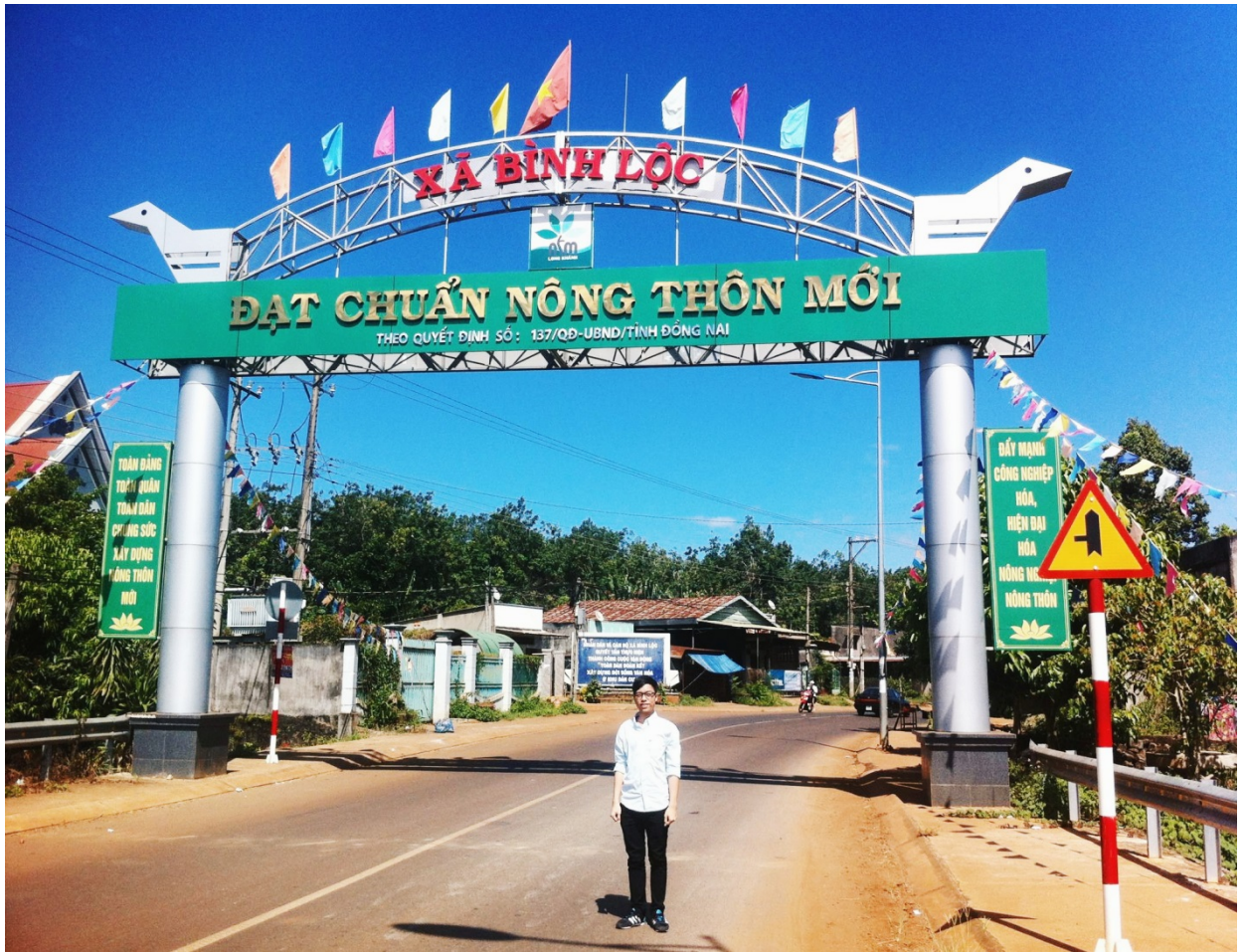
Ảnh: Tác giả chụp ảnh tại cổng chào xã Bình Lộc, TX.Long Khánh, tỉnh Đồng Nai.

Con đường vào xã nay đã được nhựa hóa, hai bên nhà dân được xây dựng kiên cố, nhiều trường học khang trang ở các cấp học. Ngoài ra, tôi còn đến thăm cầu D22 nằm tại ấp Cây Da, giáp ranh huyện Xuân Lộc và huyện Định Quán. Trước đây, cầu được làm bằng gỗ và đã xuống cấp, vào mùa mưa bão người dân rất sợ khi đi qua. Khi triển khai bộ tiêu chí nông thôn mới nâng cao, nội dung đầu tiên được xã thực hiện là hoàn thành hồ sơ và tiến hành xây mới 2 cây cầu trên địa bàn, đó là cầu D52 và cầu Bồi với kinh phí trên 1 tỷ 300 triệu đồng từ nguồn hỗ trợ ngân sách của thị xã. Đến nay, cầu D22 đã được xây dựng kiên cố, bà con ai cũng vui mừng phấn khởi vì việc đi lại, vận chuyển hàng hóa, nông sản của sẽ dễ dàng hơn, trẻ em an toàn đến trường, người lớn an tâm sản xuất.