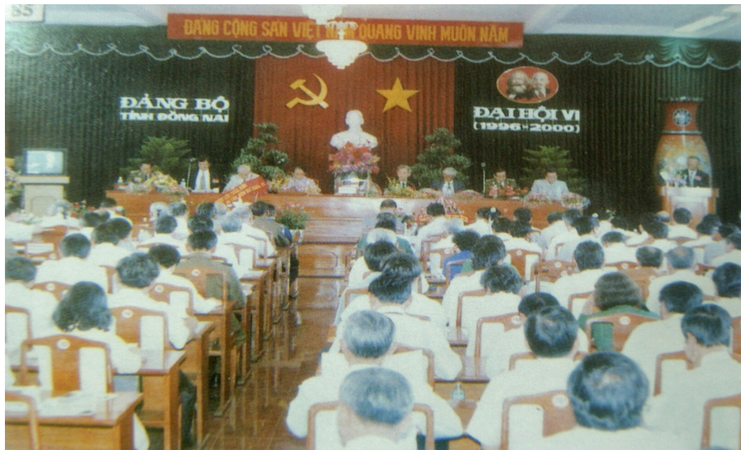
Ảnh: Đại hội đại biểu Đảng bộ tỉnh Đồng Nai lần thứ VI

Từ ngày 02 đến ngày 04/5/1996, Đại hội Đại biểu Đảng bộ tỉnh Đồng Nai lần thứ VI đã được triệu tập. Tham dự Đại hội có 353 đại biểu chính thức đại diện cho trên 16.000 đảng viên của 15 Đảng bộ trực thuộc và 670 tổ chức cơ sở Đảng trong toàn tỉnh.