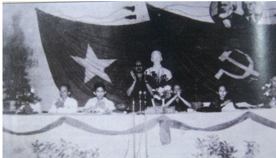
Ảnh: Đại hội đại biểu Đảng bộ tỉnh Đồng Nai lần thứ nhất

Đại hội đại biểu Đảng bộ tỉnh Đồng Nai lần thứ nhất (vòng 1) tiến hành từ ngày 11 đến 21/11/1976 tại thành phố Biên Hoà. Tham dự có 420 đại biểu chính thức gồm 367 đại biểu nam, 52 đại biểu nữ, có 11 đại biểu dân tộc thiểu số, đại diện cho 6.810