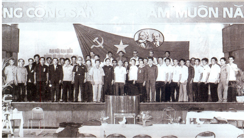
Ảnh: Đại hội đại biểu Đảng bộ tỉnh Đồng Nai lần thứ III

Đại hội đề ra các mục tiêu chung về kinh tế - xã hội, đây là mục tiêu tổng quát của đại hội: