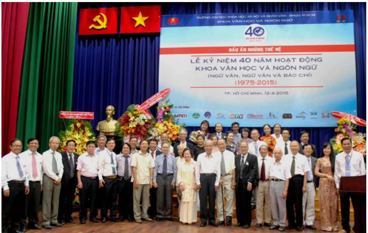
Ảnh: Các thế hệ giảng viên chụp ảnh lưu niệm tại Lễ kỷ niệm 40 năm hoạt động Khoa Văn Học và Ngôn ngữ (1975 – 2015).