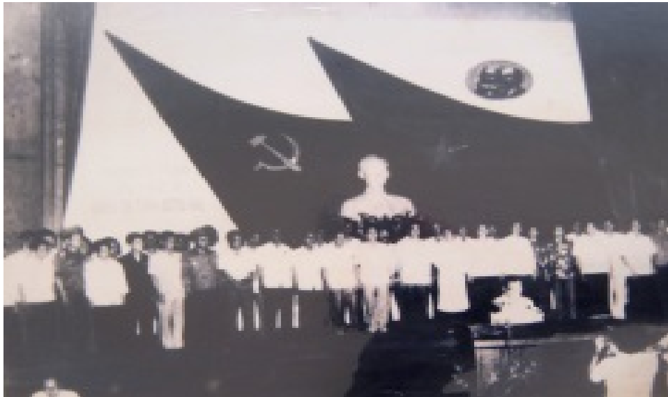
Ảnh: Đại hội đại biểu Đảng bộ tỉnh Đồng Nai lần thứ IV

Đại hội họp từ ngày 20/10 đến ngày 26/10/1986. Về dự Đại hội có 447 đại biểu thay mặt cho trên 12.000 đảng viên của Đảng bộ 07 huyện, 01 thị xã, 01 thành phố và 10 Đảng uỷ trực thuộc.