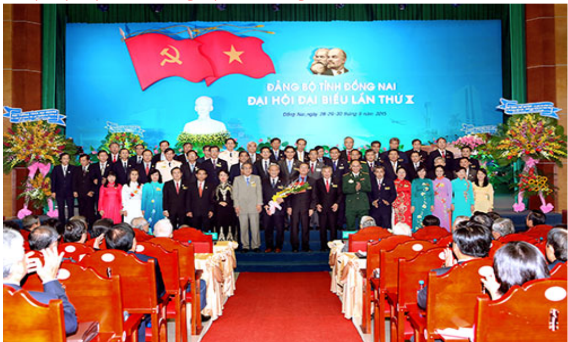
Ảnh: Đại hội đại biểu Đảng bộ tỉnh Đồng Nai lần thứ X