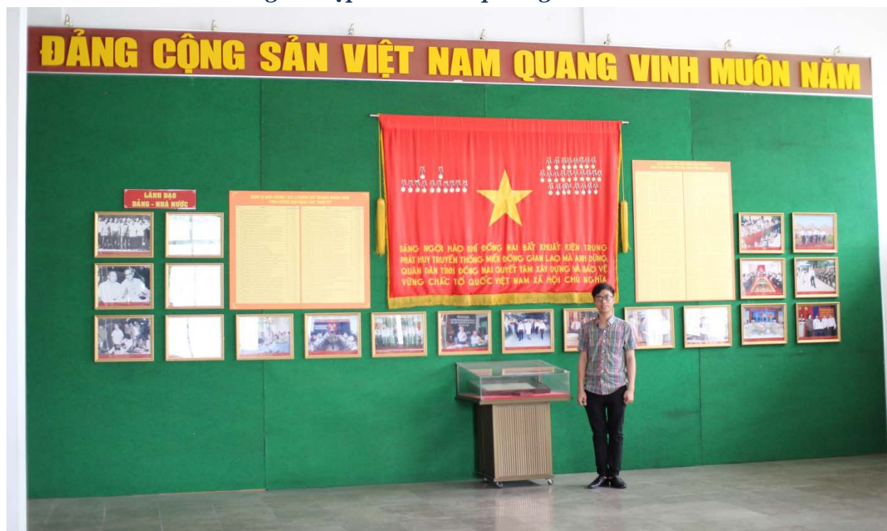
Ảnh: Tác giả chụp ảnh lưu niệm trong phòng triển lãm.