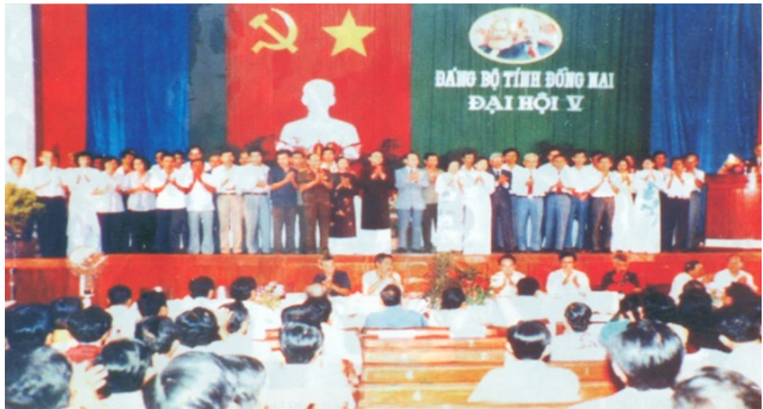
Ảnh: Đại hội đại biểu Đảng bộ tỉnh Đồng Nai lần thứ V

Vòng 1 tiến hành từ ngày 23 đến 25/4/1991, tham dự có 349/350 đại biểu được bầu cử dân chủ từ Đại hội của 17 Đảng bộ trực thuộc. Vòng 2 được tổ chức từ ngày 28/10 đến ngày 01/11/1991 với 288 đại biểu đại diện cho 14650 đảng viên trong 15 Đảng bộ trực thuộc tỉnh dự Đại hội.