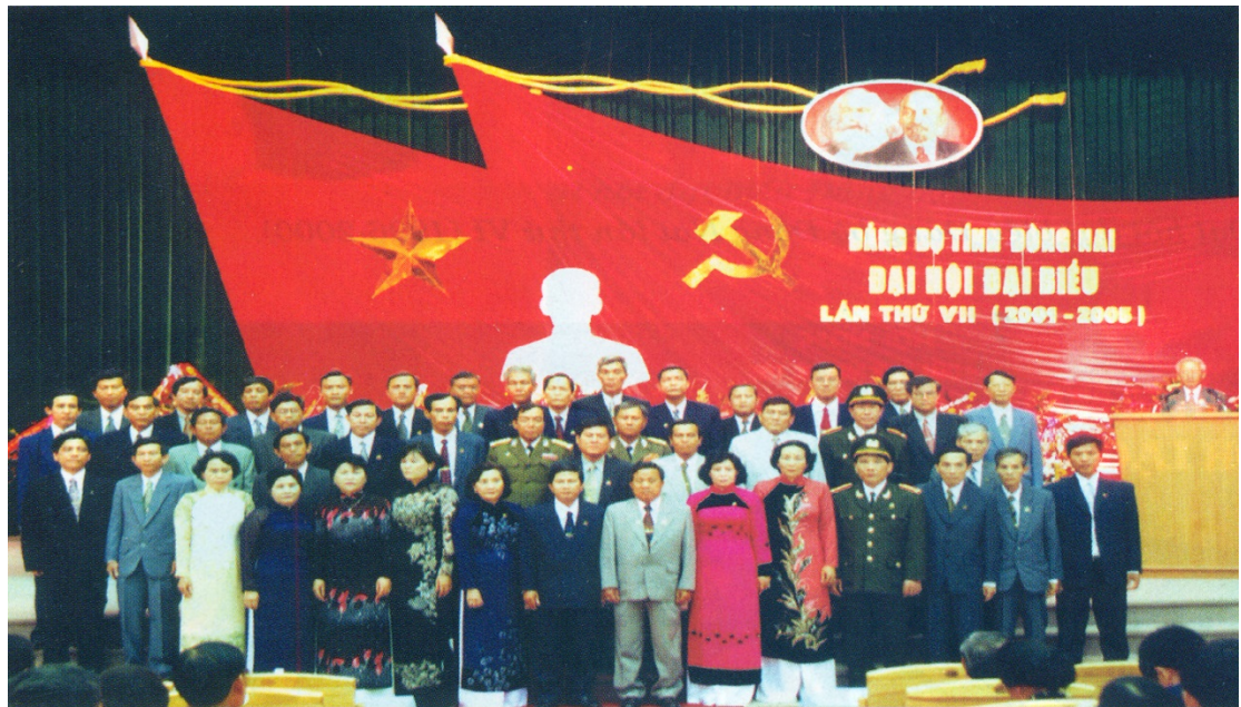
Ảnh: Đại hội đại biểu Đảng bộ tỉnh Đồng Nai lần thứ VII

Đại hội Đại biểu Đảng bộ tỉnh Đồng Nai lần thứ VII (nhiệm kỳ 2001 – 2005) được tiến hành tại thành phố Biên Hoà trong hai ngày 28 và 29/12/2000. Dự Đại hội có 350 đại biểu chính thức thay mặt cho 22.626 đảng viên thuộc 14 Đảng bộ trực thuộc tỉnh.