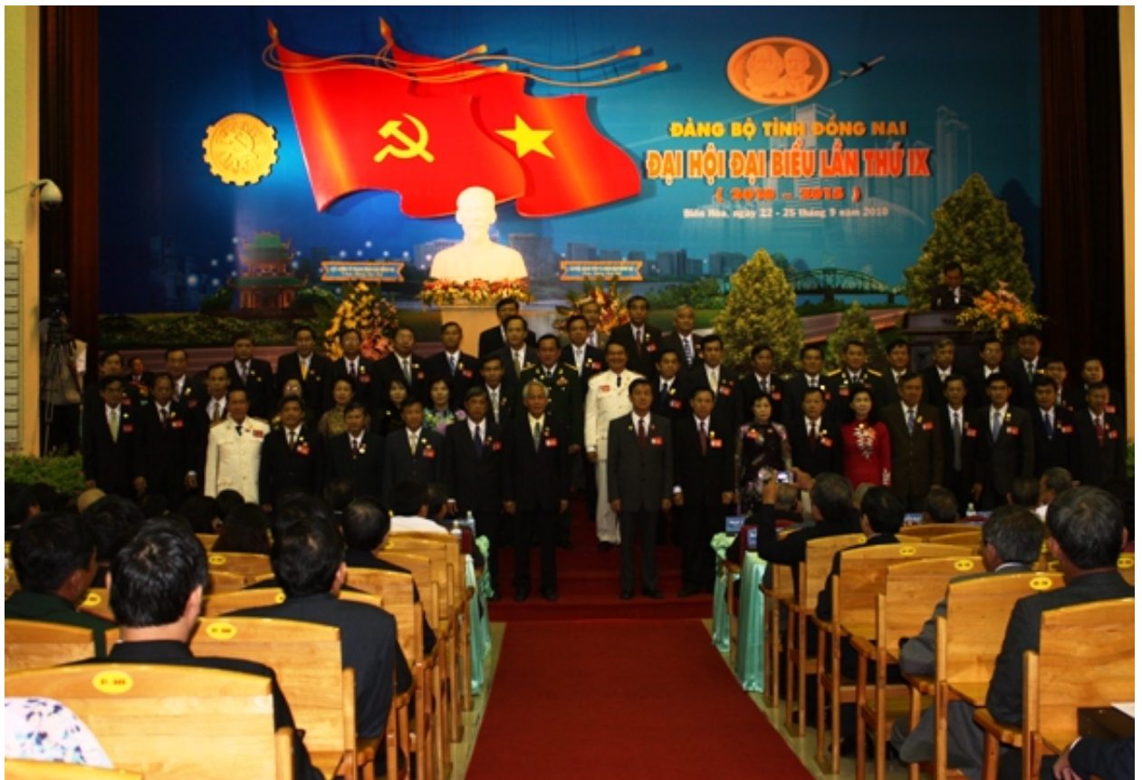
Ảnh: Đại hội đại biểu Đảng bộ tỉnh Đồng Nai lần thứ IX