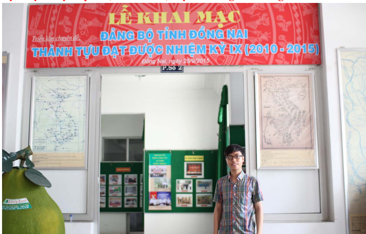
Ảnh: Tác giả chụp ảnh trước phòng triển lãm.