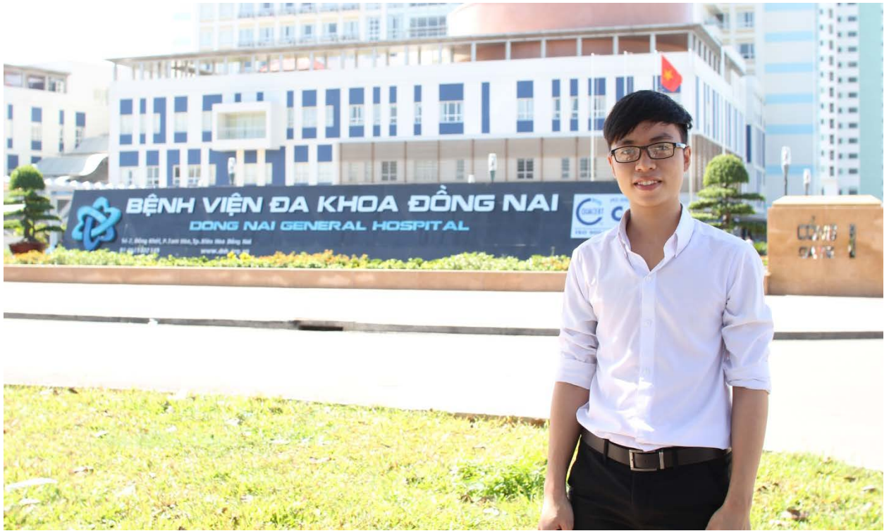
Ảnh: Tác giả chụp ảnh tại công trình Bệnh viện Đa khoa Đồng Nai (công trình đưa vào hoạt động từ tháng 4/2015).