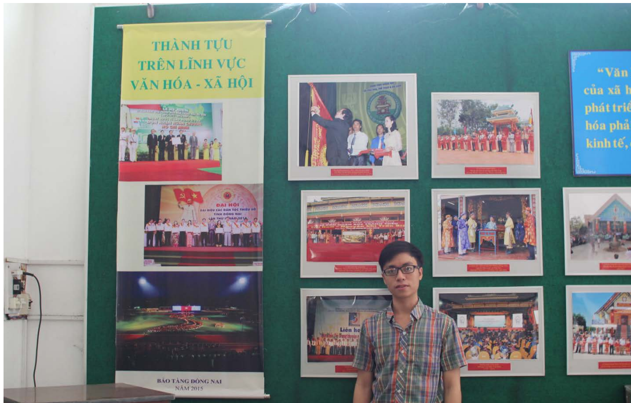
Ảnh: Tác giả chụp ảnh lưu niệm trong phòng triển lãm.