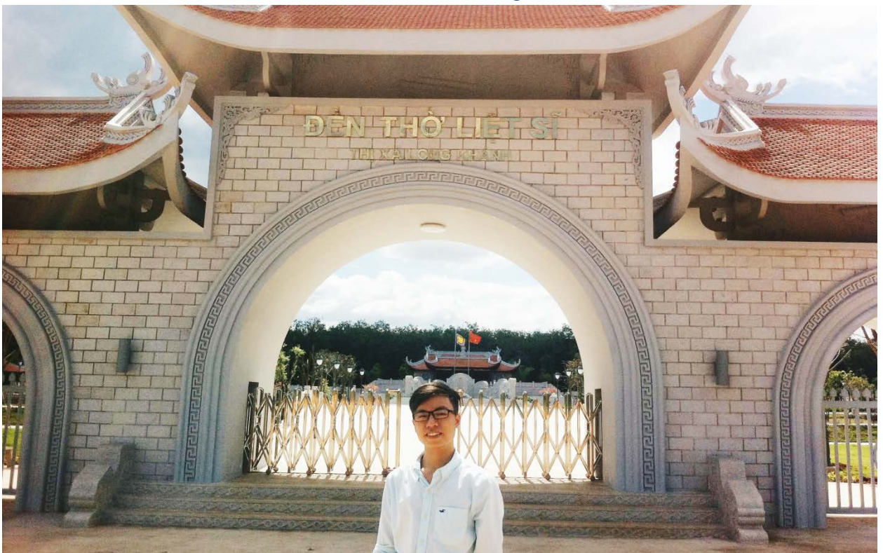
Ảnh: Tác giả chụp ảnh tại cổng Đền thờ liệt sĩ Long Khánh (được khánh thành vào ngày 14/9/2015).