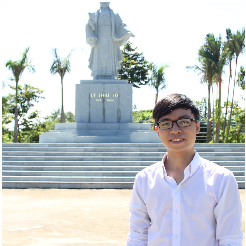
Ảnh: Tác giả chụp ảnh cùng tượng Vua Lý Thái Tổ tại Vườn tượng Danh nhân văn hóa tại Văn miếu Trấn Biên (vườn tượng được khánh thành ngày 22/9/2015).