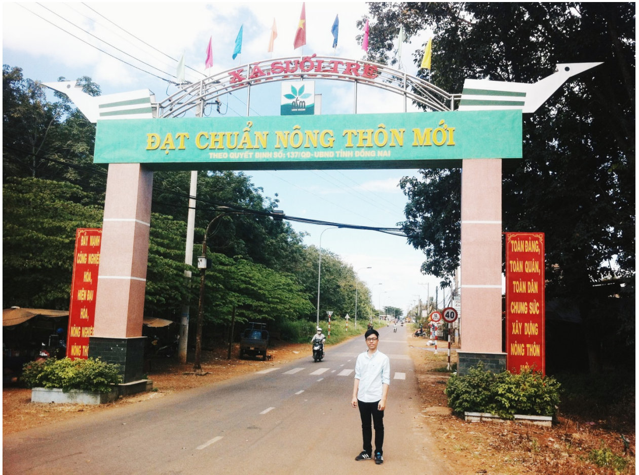
Ảnh: Tác giả chụp ảnh tại cổng chào xã Suối Tre, TX. Long Khánh, tỉnh Đồng Nai