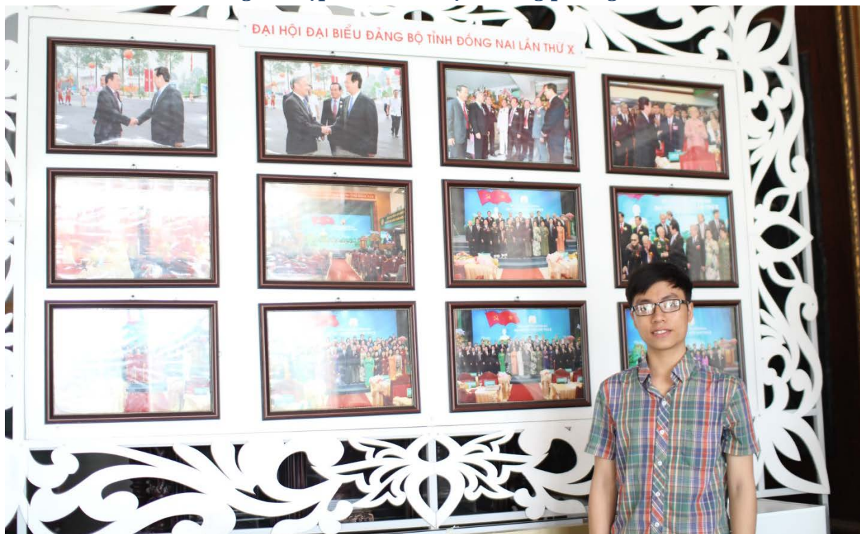
Ảnh: Tác giả chụp ảnh tại bảng hình ảnh Đại hội Đại Biểu Đảng bộ tỉnh Đồng Nai lần thứ X.