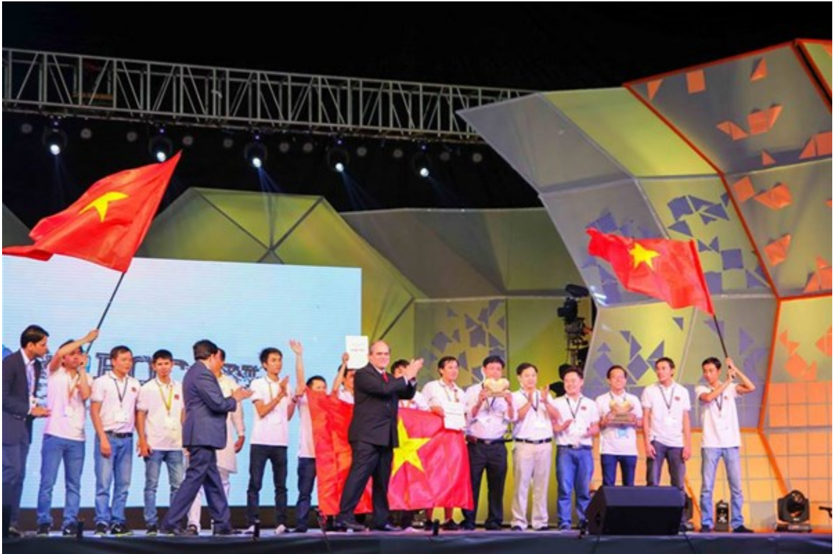
Ảnh: Đội tuyển Robocon Việt Nam (do trường Đại học Lạc Hồng đại diện) đăng quang cuộc thi Robocon châu Á – Thái Bình Dương năm 2014. Nguồn ảnh: Trang thông tin điện tử trường Đại học Lạc Hồng.

Tôi được sinh ra và lớn lên tại vùng đất Biên Hòa – Đồng Nai, nơi nổi tiếng là vùng đất hiếu học với nhiều nhân tài. Từ nhỏ, tôi đã thích học văn; cấp 2 tôi theo học lớp Văn tại trường THCS Nguyễn Bình Khiêm, thành phố Biên Hòa – đây là nơi đã nhen nhóm trong tôi tình yêu với các môn xã hội, đặc biệt là môn văn và sử. Tôi nhớ hoài những bài giảng của cô giáo dạy văn lớp 8, cũng là giáo viên chủ nhiệm của lớp về việc môn văn rất quan trọng trong cuộc sống: Vì cuộc đời là nơi bắt đầu và cũng nơi đi đến của văn chương, học văn giỏi sẽ giúp chúng ta nhìn cuộc sống một cách đa diện, đa chiều, từ đó giúp mỗi người có tâm hồn đẹp, trở thành những người có ích cho xã hội. Để rồi tôi tìm hiểu làm như thế nào để có thể viết văn hay, học văn giỏi, giao tiếp tốt. Và tôi hiểu rằng, khi có vốn từ tốt, cách sử dụng từ hay thì ta sẽ viết và nói tốt. Vậy là tôi quyết định đăng kí thi vào chuyên ngành Ngôn ngữ học - Khoa Văn học và Ngôn ngữ, trường Đại học Khoa học Xã hội và Nhân văn, Đại học Quốc gia Thành phố Hồ Chí Minh.