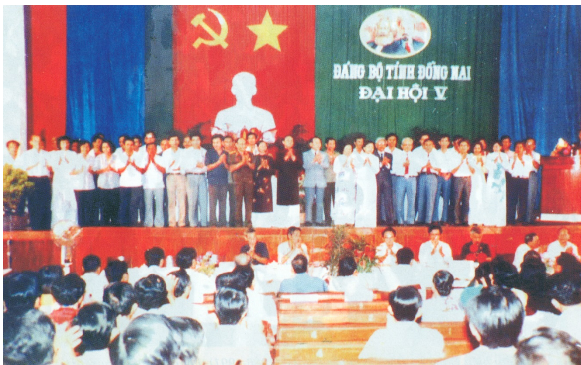
Đại hội lần V

Trên cơ sở quán triệt Thông tri 01-TT/TW ngày 22-7-1991 của Ban Bí thư về việc tiến hành Đại hội Đảng các cấp (vòng 2), Đại hội Đại biểu Đảng bộ tỉnh Đồng Nai lần thứ V được tổ chức từ ngày 28-10 đến ngày 01-11-1991. Giáo sư – Tiến sĩ Nguyễn Đình Tứ – Bí thư Trung ương Đảng thay mặt Ban Bí thư Trung ương Đảng về dự và chỉ đạo trực tiếp Đại hội. 288 đại biểu chính thức đại diện cho 14.650 đảng viên trong 15 Đảng bộ trực thuộc tỉnh dự Đại hội.