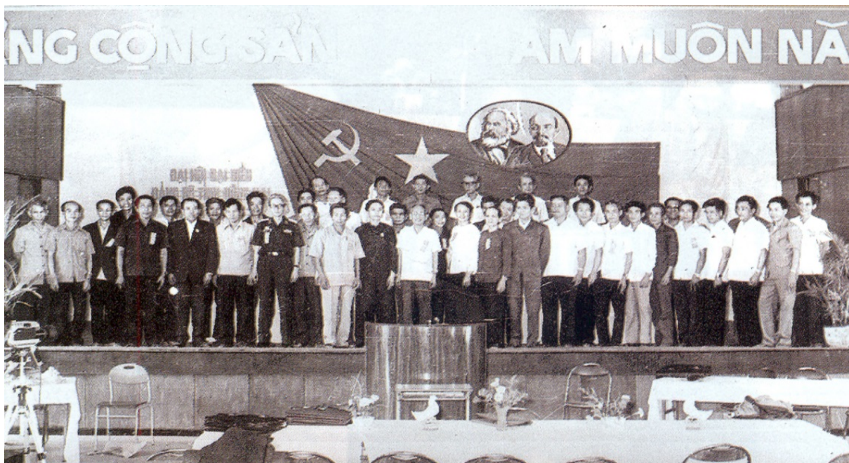
Đại hội lần III - ảnh (daihoi.dongnai.gov.vn)

Mục tiêu tổng quát của Đại hội: Đáp ứng những nhu cầu cấp thiết nhất, dần dần ổn định, tiến lên cải thiện một bước đời sống vật chất và văn hóa của nhân dân; Tiếp tục xây dựng có trọng điểm cơ sở vật chất kỹ thuật, nâng cao hiệu quả của vốn đầu tư; Đẩy mạnh cải tạo xã hội chủ nghĩa, không ngừng củng cố và hoàn thiện quan hệ sản xuất; Phấn đấu nâng cao chất lượng và phát triển phong trào văn hóa xã hội; Thường xuyên nâng cao cảnh giác cách mạng về mọi mặt và không ngừng tăng cường quốc phòng toàn dân, ra sức giữ vững an ninh chính trị, trật tự an toàn xã hội; Thực hiện tốt nghĩa vụ đối với sự nghiệp cách mạng cả nước và làm tròn nghĩa vụ quốc tế được giao; Tiếp tục củng cố hệ thống chuyên chính vô sản.