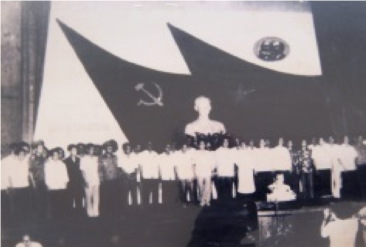
Đại hội lần IV - ảnh (daihoi.dongnai.gov.vn)

tưởng và quan điểm mới của Đảng trong lãnh đạo toàn diện nói chung, Đảng bộ Đồng Nai phải đề ra được những bước đi cụ thể, những biện pháp có hiệu quả, thiết thực để làm cho tình hình sản xuất của địa phương phát triển, phát huy tốt các khả năng hiện có để thúc đẩy kinh tế có những bước phát triển mới, ổn định tình hình, cải thiện đời sống nhân dân, giữ vững an ninh quốc phòng, tạo tích lũy cho sự nghiệp xây dựng xã hội chủ nghĩa của tỉnh.