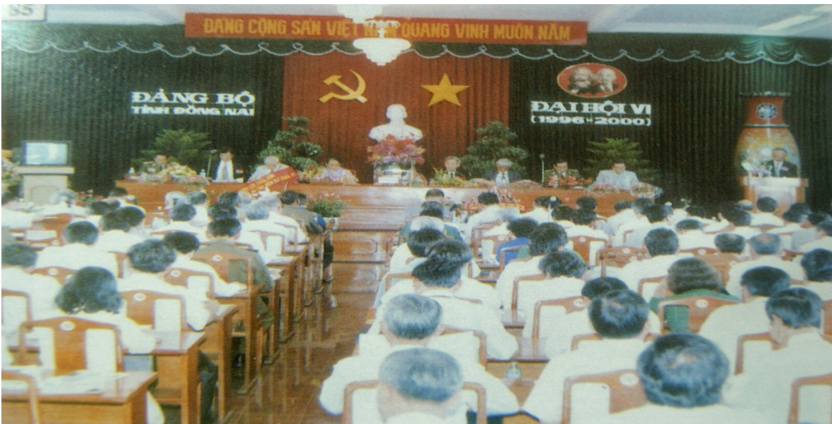
Đại hội lần VI

Đại hội Đại biểu Đảng bộ tỉnh Đồng Nai lần thứ VI đã thảo luận và đóng góp ý kiến vào các văn kiện sẽ trình tại Đại hội Đảng toàn quốc lần thứ VIII gồm: Báo cáo chính trị, Báo cáo Điều lệ Đảng sửa đổi và Phương hướng, nhiệm vụ kế hoạch phát triển kinh tế - xã hội 05 năm 1996–2000. Đại hội kiểm điểm việc thực hiện Nghị quyết Đại hội Đảng bộ tỉnh Đồng Nai lần thứ V và đề ra Nghị quyết về phương hướng, mục tiêu, nhiệm vụ và các giải pháp của Đảng bộ trong 05 năm 1996–2000.