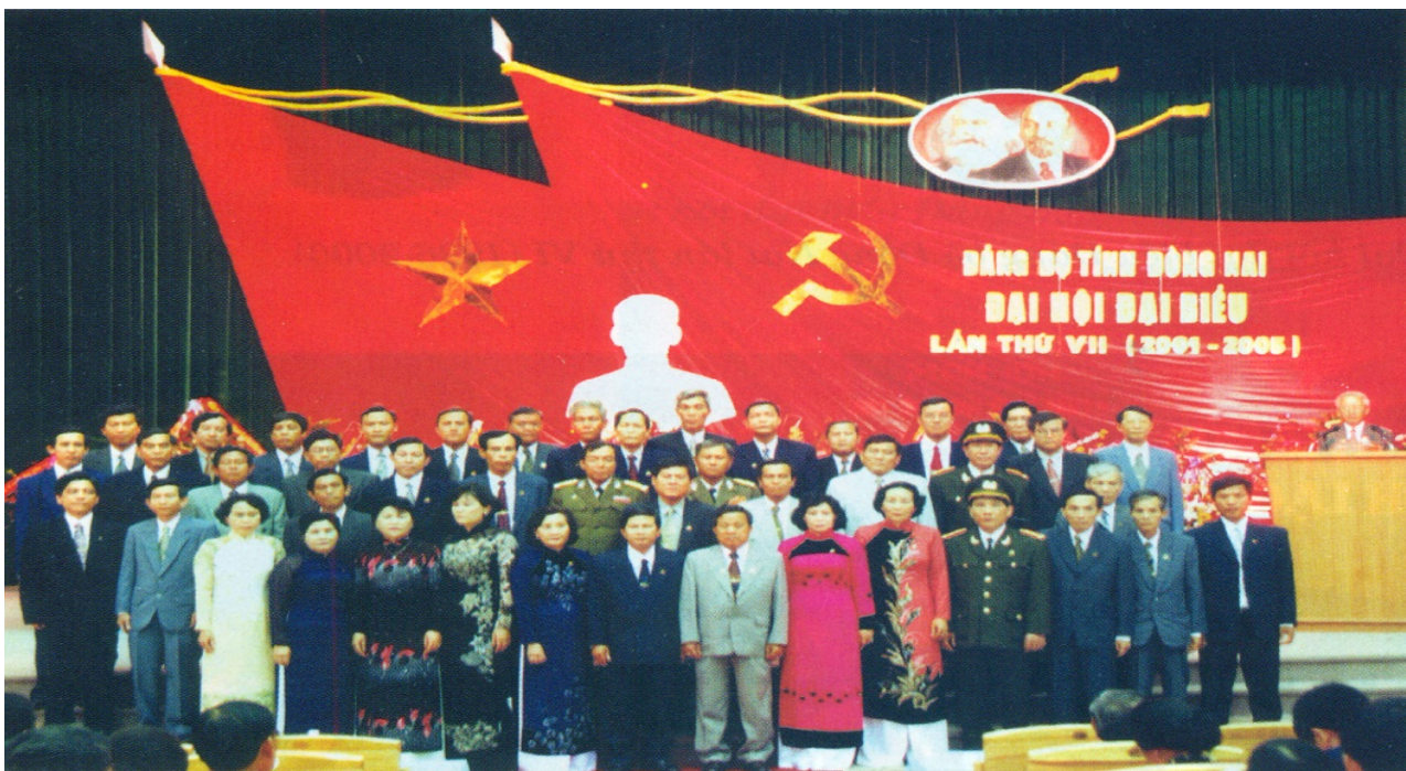
Đại hội lần VII

Trong không khí phấn khởi, sau thời gian chuẩn bị chu đáo về nội dung văn kiện và công tác nhân sự, Đại hội Đại biểu Đảng bộ tỉnh Đồng Nai lần thứ VII (nhiệm kỳ 2001– 2005) được tiến hành tại thành phố Biên Hoà trong hai ngày 28 và 29-12-2000. Dự Đại hội có 350 đại biểu chính thức thay mặt cho 22.626 đảng viên thuộc 14 Đảng bộ trực thuộc tỉnh. Đồng chí Nguyễn Mạnh Cầm, Ủy viên Bộ Chính trị, Phó Thủ tướng Chính phủ cùng nhiều đồng chí lãnh đạo các Ban Đảng của Trung ương về dự.