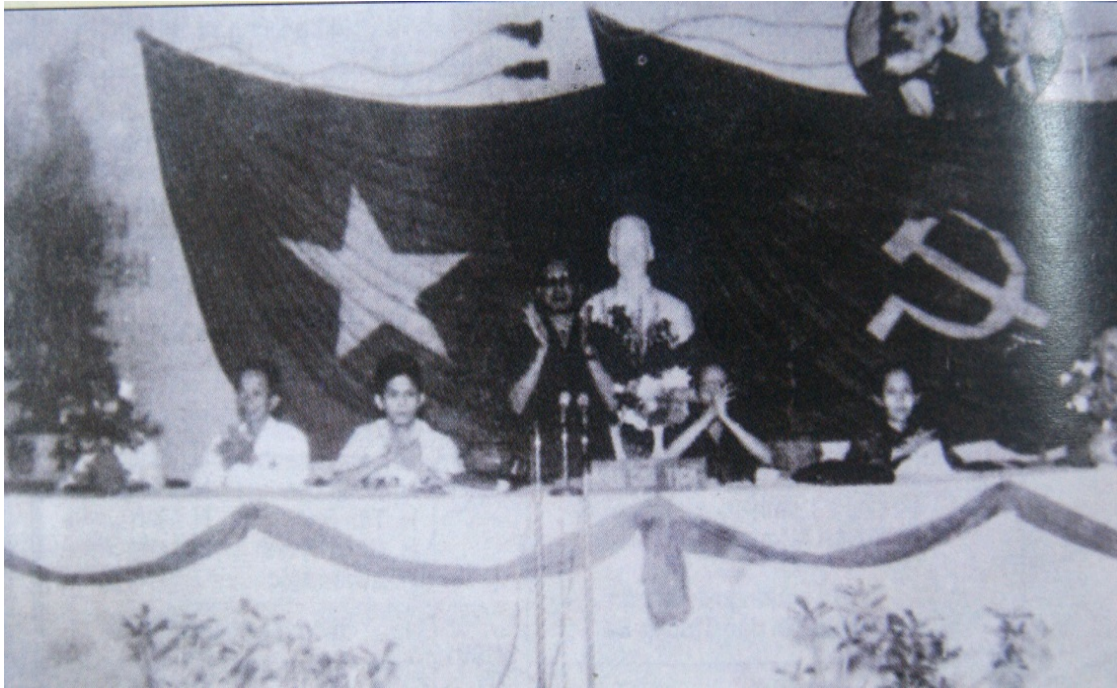
Đại hội lần I - ảnh (daihoi.dongnai.gov.vn)

dân khắc phục khó khăn, giành được thắng lợi một số mặt về khôi phục, phát triển kinh tế, văn hoá, bảo đảm an ninh chính trị, trật tự xã hội, đưa tình hình của tỉnh phát triển hoà nhịp chung với sự phát triển chung của cả nước.