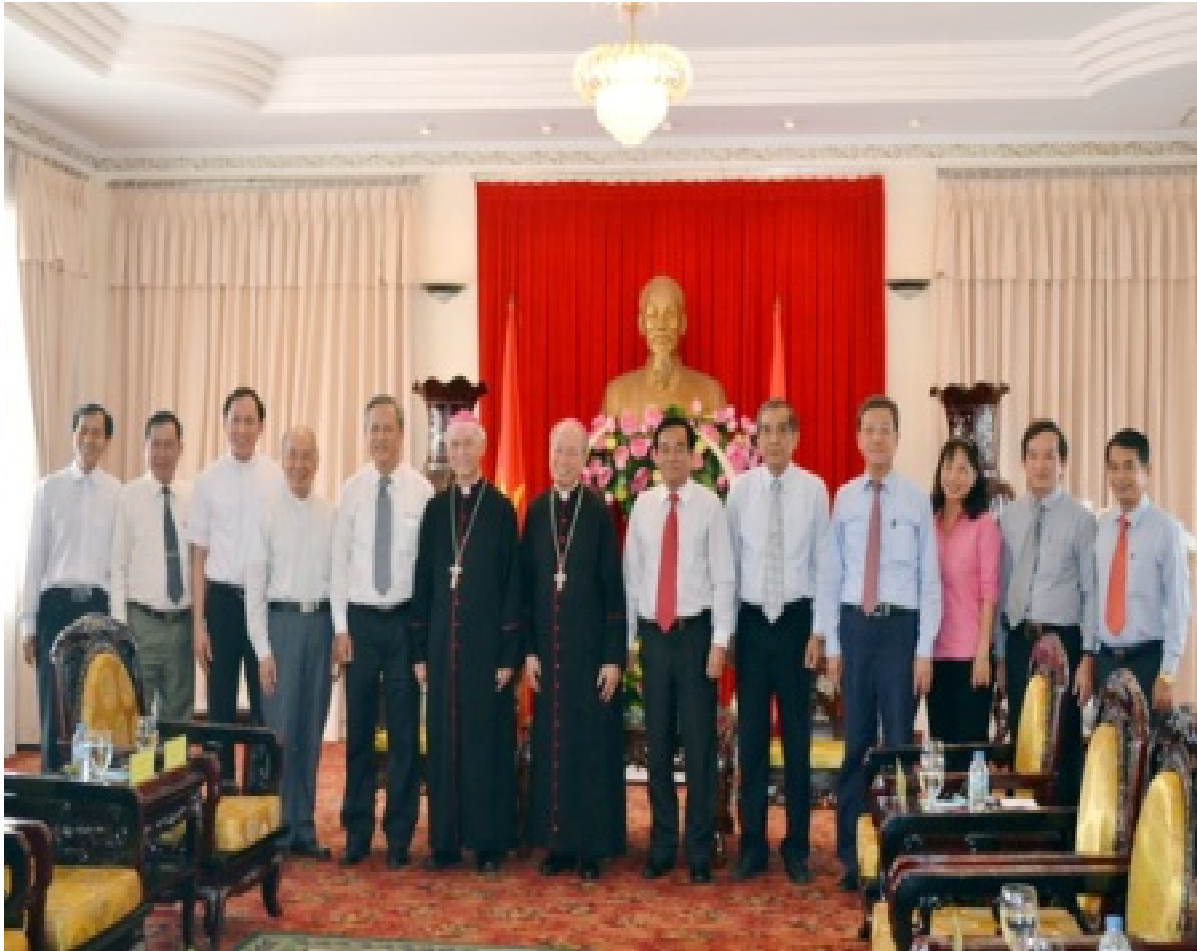
Đoàn Giám mục Xuân Lộc chụp hình lưu niệm cùng Lãnh đạo tỉnh( theo ban tôn giáo tỉnh Đồng Nai)

Câu hỏi 3: Cảm nhận của bạn về lĩnh vực giáo dục- đào tạo nói chung và về trường hoặc chuyên ngành nơi bạn đang học tập nói riêng.