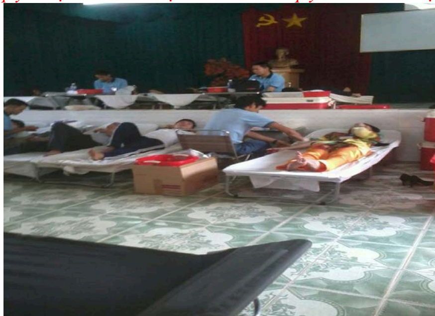
Hiển máu nhân đạo(*)