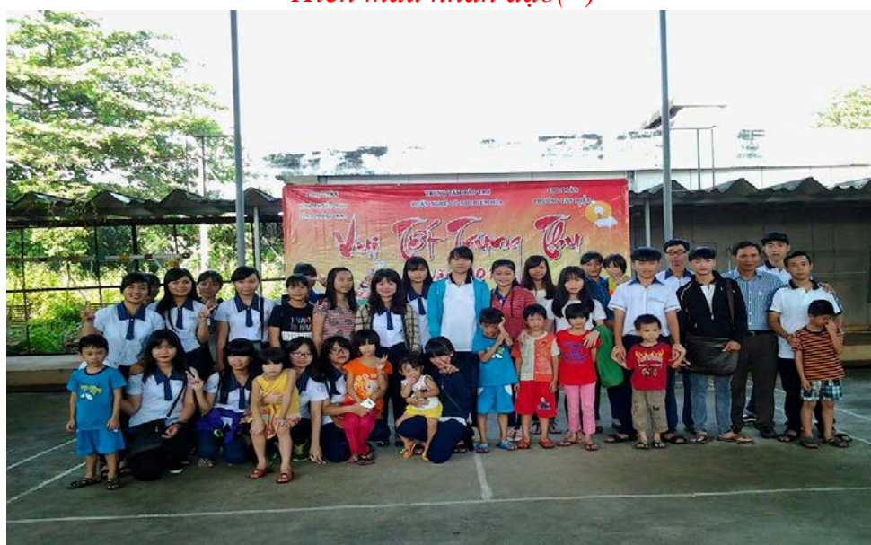
Vui tết trung thu (*)