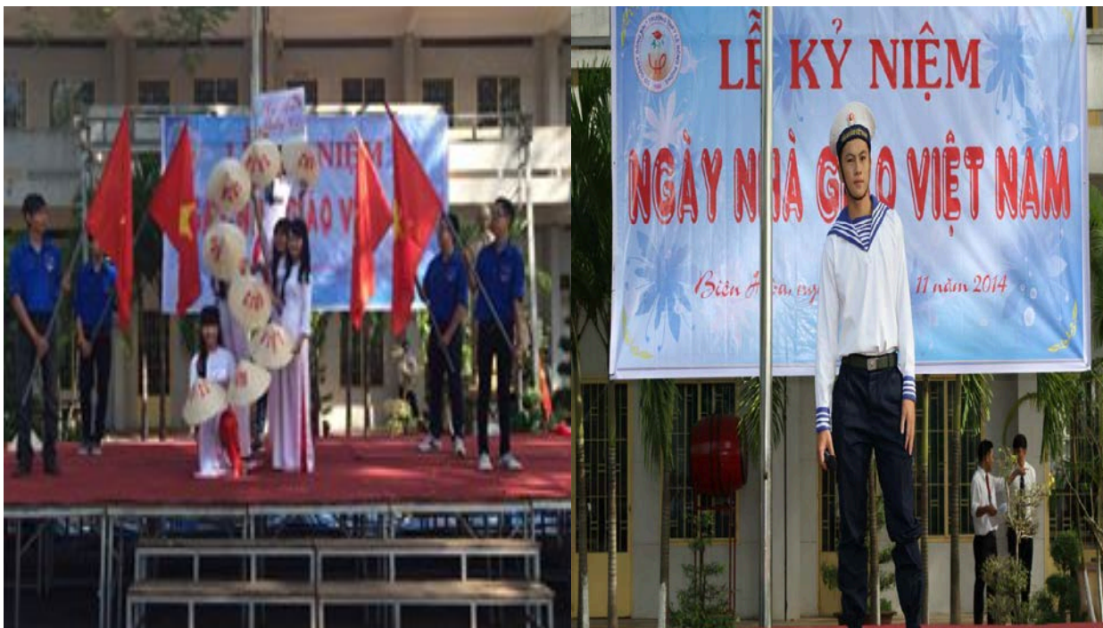
Văn nghệ kỉ niệm ngày nhà giáo 20/11(*)