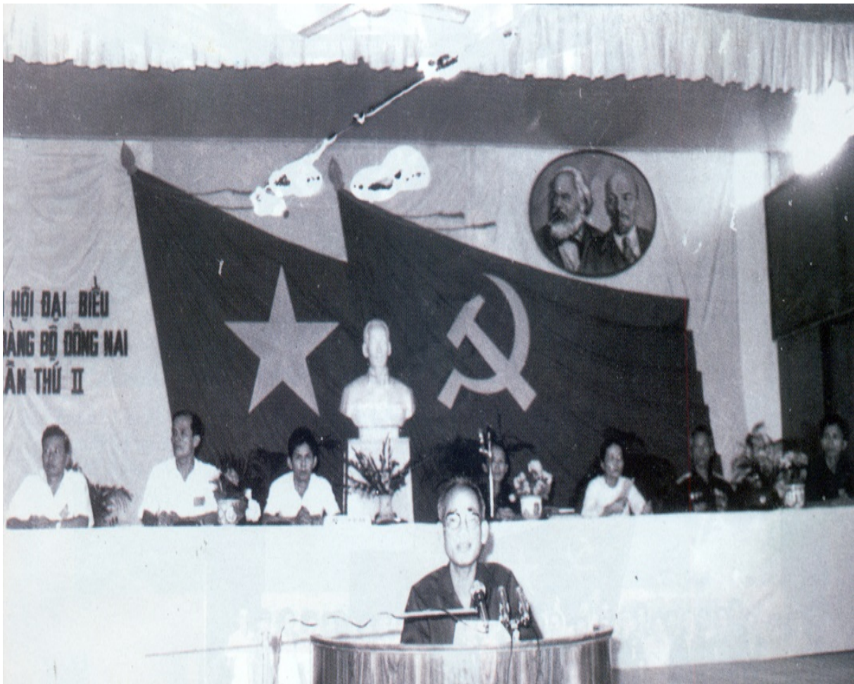
Đại hội lần II - ảnh (daihoi.dongnai.gov.vn)

Đại hội Đại biểu Đảng bộ tỉnh lần thứ II họp từ ngày 10 đến ngày 12-7-1979 tại thành phố Biên Hoà. Tham dự Đại hội có 401 đại biểu đại diện cho trên 8.000 đảng viên trong toàn tỉnh. Đại hội đã kiểm điểm, tổng kết việc thực hiện Nghị quyết Đại hội Đảng bộ lần thứ nhất, đề ra nhiệm vụ, phương hướng thực hiện hai nhiệm vụ chiến lược là bảo vệ Tổ quốc xã hội chủ nghĩa và xây dựng cơ sở vật chất của chủ nghĩa xã hội, hoàn thành kế hoạch Nhà nước 5 năm lần thứ 2 (1976–1980).