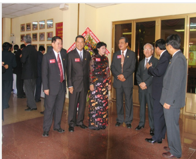
Đại hội lần VIII - ảnh (daihoi.dongnai.gov.vn)