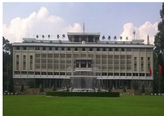
Tổ chức tham quan các di tích lịch sử, di sản văn hoá,... (Bảo tàng chiến tích chiến tranh, Dinh Độc Lập) (*)

Các ngày lễ lớn như 20/11 luôn là thời điểm học sinh các khối mong chờ nhất. Ngày mà học sinh có thể tự bày tỏ lòng biết ơn của mình với thầy cô. Học sinh trường THPT Lê Hồng Phong thể hiện được tấm lòng của mình qua từng dòng tâm