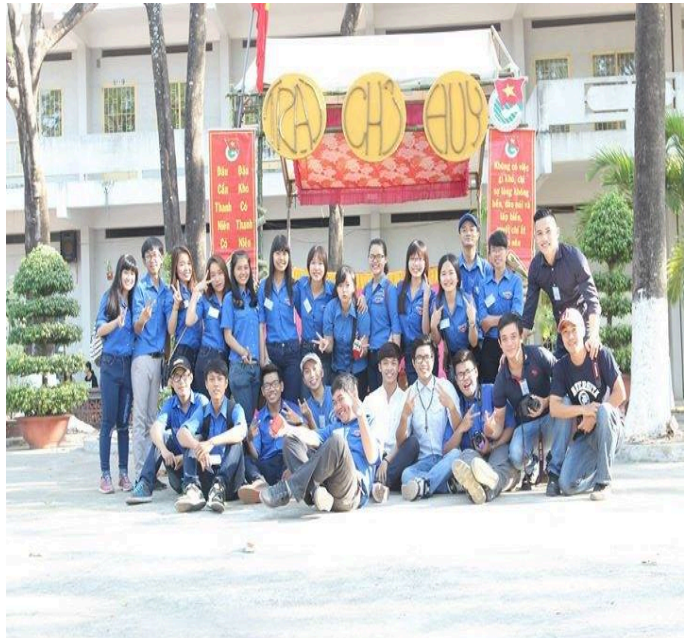
Thi dựng công trại chủ đề đất nước và biển đảo(*)