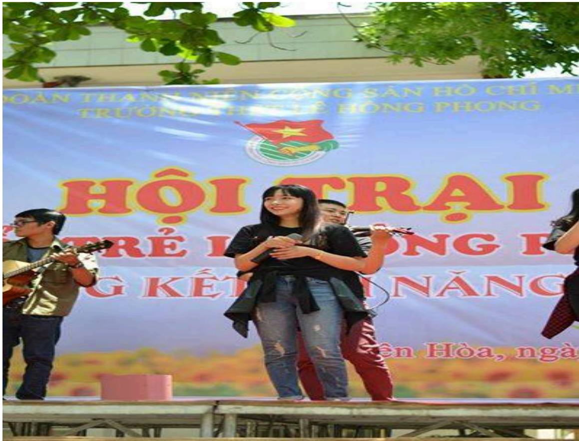
Hội trại tuổi trẻ Lê Hồng Phong ( 26/3/2015) (*)