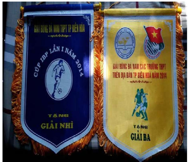
Giải bóng đá nam các trường THPT trên địa bàn Tp. Biên Hòa(*)