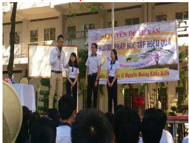
Tổ chức các buổi tư vấn tâm lý, tư vấn tuyển sinh, hướng nghiệp,... (*)