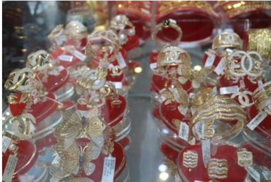
Vàng trang sức thường bị ăn gian tuổi (ảnh minh họa)

quan, lơ là, tiếp tục đưa ra lưu thông trên thị trường sản phẩm vàng non, kém chất lượng, gây ảnh hưởng xấu đến tâm lý người tiêu dùng và doanh nghiệp làm ăn chân chính.