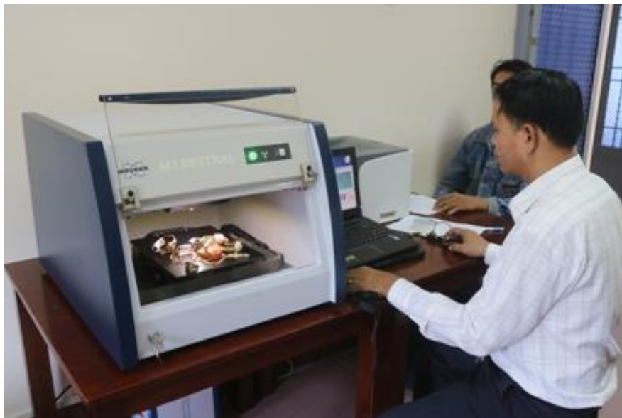
Cán bộ Chi cục Tiêu chuẩn Đo lường Chất lượng đang hỗ trợ doanh nghiệp xác định lại tuổi vàng máy quang phổ

Nhiều doanh nghiệp đã tự giác nấu lại vàng có tuổi vàng thực tế thấp hơn tuổi vàng khắc trên nữ trang hoặc đem đổi lại nơi sản xuất vàng nữ trang ở Thành phố Hồ Chí Minh hoặc xin công bố và làm lại tem nhãn phù hợp với tuổi vàng thực tế. Nhiều trường hợp doanh nghiệp tự giác đem sản phẩm tới Sở Khoa học và Công nghệ nhờ thẩm định lại chất lượng vàng. Hoặc nhờ hỗ trợ Sở Khoa học và Công nghệ kiểm tra tại doanh nghiệp để đảm bảo việc kinh doanh của mình theo đúng quy định của pháp luật.