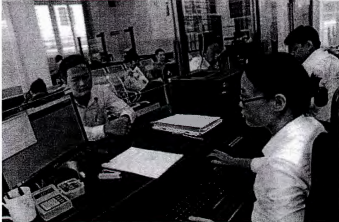
Hướng dẫn người dân làm TTHC tại bộ phận “Một cửa” sở Kế hoạch và Đầu tư